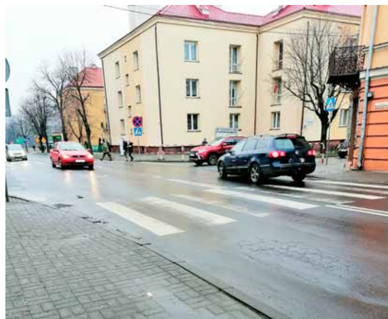
Do szokującego zdarzenia doszło na skrzyżowaniu ulic Belwederskiej i Ozorkowskiej

Policjanci zostali zawiadomieni o tym zdarzeniu i na podstawie rysopisu przekazanego przez pokrzywdzonego jeszcze tego samego dnia zatrzymali agresora. Okazał się nim mieszkaniec pow. zgierskiego, który w chwili zatrzymania był nietrzeźwy. Dodatkowo policjanci podczas przeszukania 23-latka zabezpieczyli przy nim dwie dilerki z amfetaminą. Mężczyzna trafił do