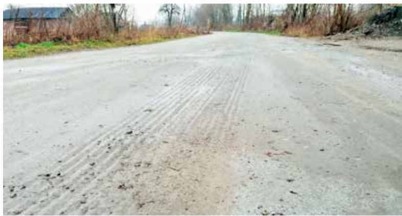
Dziury zostały wyrównane

„PLK zobowiązały wykonawcę prac na stacji Łęczyca do naprawy drogi dojazdowej prowadzącej do placu budowy. Droga została wyrównana a ubytki wypełnione kruszywem. Po zakończeniu robót