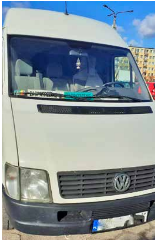
Spółdzielnia ma dwa busy służbowe

byli potrzebni jedynie do wpłacania pieniędzy.