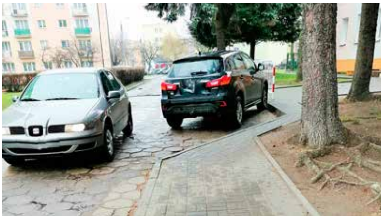
Jedna z mieszkanki mówiła o uciążliwościach związanych z dużym ruchem na osiedlowej uliczce przy przedszkolu nr 1

- Brak obwodnicy Łęczyczy rozwiązał się sam. Mieszkam w bloku przy Konopnickiej 8b. Od czasu, kiedy przy przedszkolu nie ma słupków, osiedlową drogą porusza się mnóstwo samochodów. Kierowcy robią sobie skrót do ulicy Zachodniej omijając ulicę Kaliską. Jeszcze tylko tirów brakuje - mówiła mieszkanka. - Droga osiedlowa nie powinna być tak ruchliwa. Chodzą nią dzieci do szkoły i przedszkola. Proszę ten problem rozwiązać, bo tak nie może zostać.