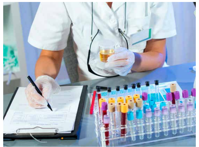
W pracowni diagnostyki laboratoryjnej brakuje techników