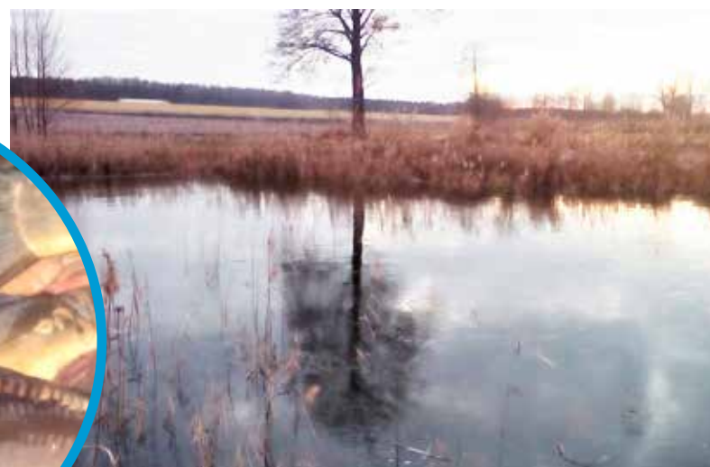
Ze stawu w Wiktorowie z pewnością karpie trafią na wigilijne stoły