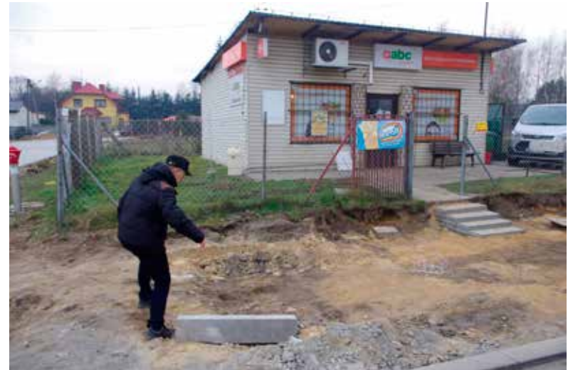
Trudne dojście do sklepu z powodu głębokiego wykopu

- Na pewno dobrze wiedzieli dla kogo robią ten podjazd. Poza tym jest dla mnie oczywiste, że interes społeczny powinien być ważniejszy od interesu jednego człowieka. Ze sklepu na pewno korzysta więcej mieszkańców, niż liczba domowników z sąsiedniego domu pani radnej. Ciekawe, jakby jakiś klient sklepu złamał nogę na tych nierów-