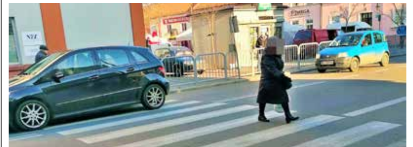
Samochód najechał na stopę Wiesławy Bednarek na przejściu dla pieszych