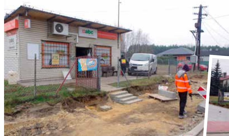
Robotnicy zapewniali, że wkrótce wyremontują teren