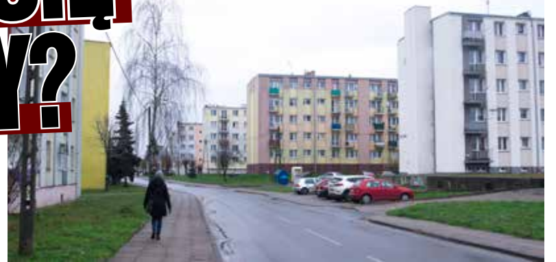
Problem komentowany jest głównie na Sucharskiego