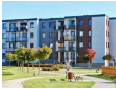
Dotychczas na osiedlu wybudowano 5 nowych bloków, których administratorem jest spółka PGK „Termy Uniejów”

W kwestii ceny zakupu, metr kwadratowy nowych mieszkań może oscylować w okolicach 5 tys. zł. Taki wzrost ceny w stosunku do wcześniej budowanych bloków wynika z dra-