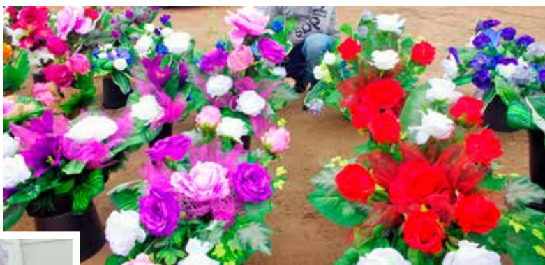
Mieszkańcy w tym roku chętnie wybierają wiązanki w odcieniach fioleto i połączenie czerwieni z zielenią

W tym roku, jak zauważają handlujący, większość mieszkańców wybiera znicze klasyczne, z jak najmniejszą liczbą ozdób, w przeciwieństwie do roku ubiegłego, kiedy najczęściej sprzedawało