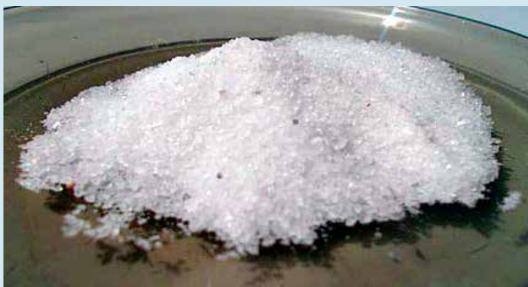
Moczenie stóp w wodzie z solą przyniesie im ulgę

Moczenie stóp w naparze z czarnej herbaty, która ma silne właściwości ściągające, zabijające bakterie i zamykające pory i tym