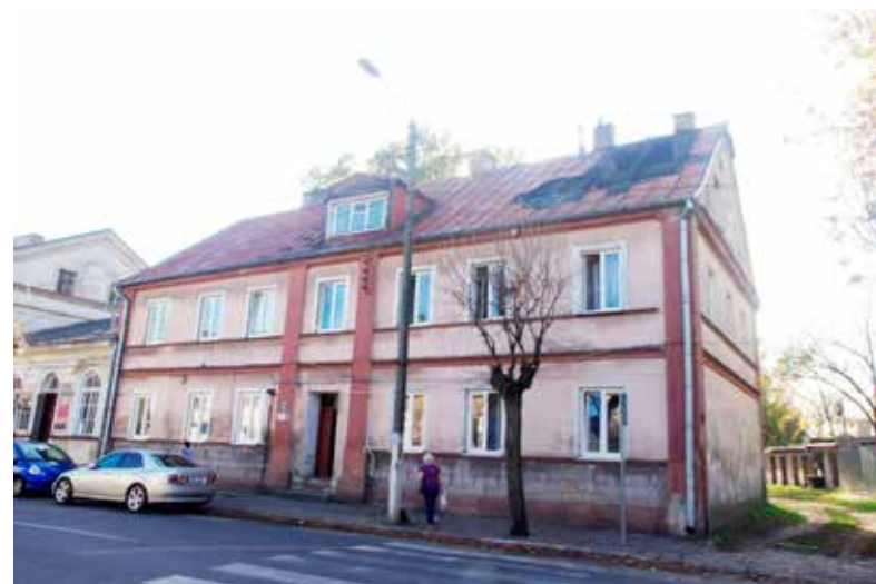
W pożarze tej kamienicy na szczęście nikt nie ucierpiał