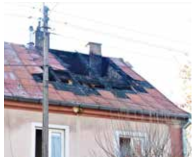
Dziura w dachu została pod koniec ub. tygodnia zabezpieczona