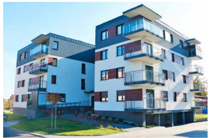
Na zdjęciu jeden z ostatnich parę bloków wybudowanych przez „Termy”. Inwestycja powstała na przełomie 2016/17. Jeżeli ruszy budowa kolejnych bloków w Uniejowie, można się spodziewać, że standardem oraz estetyką będą nawiązywały do tych już istniejących.

Aktualnie prowadzone są zapisy i rezerwacje na lokale mieszkalne. Warto dodać, że powodzenie i szansa realizacji inwestycji w bardzo dużym stopniu uzależniona jest od zainteresowania potencjalnych nabywców. Jest to kluczowy element dla opłacalności inwestycji. Jeśli dojdzie do realizacji, budowa może rozpocząć się już wiosną