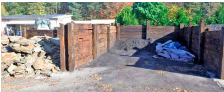
Polskiego węgla na składach brakuje