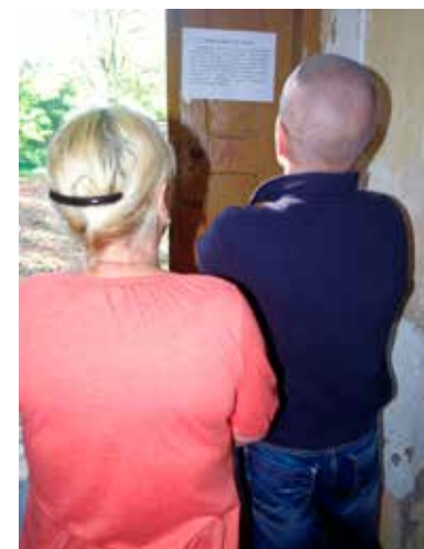
Lokatorzy czytają ogłoszenia o planowanych pracach porządkowych