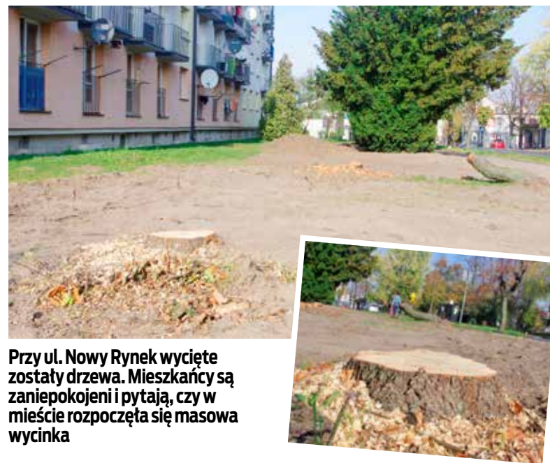
Przy ul. Nowy Rynek wycięte zostały drzewa. Mieszkańcy są zaniepokojeni i pytają, czy w mieście rozpoczęła się masowa wycinka