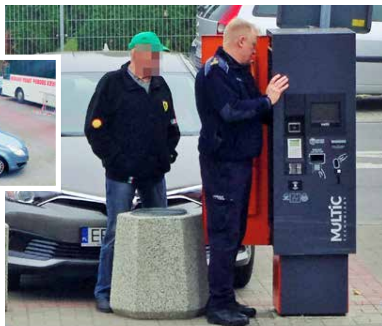
Urządzenie naprawiał komendant straży miejskiej