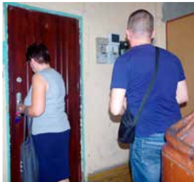
Pogorzelnicy tuż po pożarze uważali, że nie mieli dostatecznej pomocy ze strony miasta