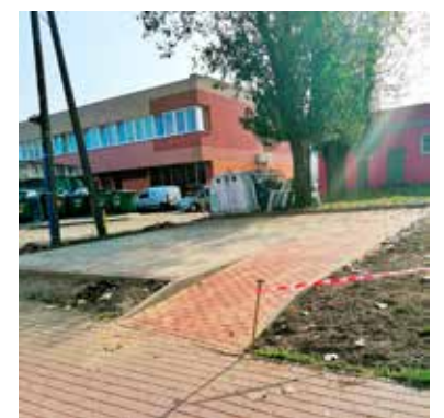
Grunt pod nową pergolę został już utwardzony

Teren na tyłach siedziby „Łęczycanki” jest już objęty monitoringiem, ale kamery nie obejmowały by nowej pergoli.