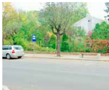
Busy wracające z Łodzi nie zatrzymują się na tym przystanku

Przewoźnicy nie mają obowiązku korzystania ze wszystkich przystan-