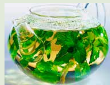
Herbata miętowa skutecznie nas ochłodzi

ciśnienie, przez co działa moczopędnie, wypłukując potas z organizmu. Tym, którzy nie wyobrażają sobie dnia bez filiżanki kawy, w czasie upałów lekarze polecają szklankę schłodzonego latte lub kawę bezkofeinową.