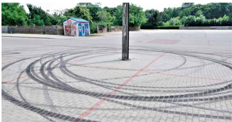
Niedawno kręcone były kółka wokół lampy