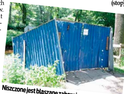
Niszczony jest blaszane zabezpieczenie nad rzeką