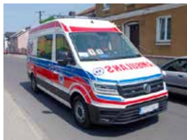
W upalne dni jest dużo wyjazdów karetek pogotowia

- Wyjazdów mamy jeszcze raz tyle, co przed tymi upałami - uszliśmy od ratowników medycznych. - Niektórzy, niestety, zapominają, że w czasie takiej pogody należy po prostu uważać na siebie. Nie można na przykład w samo południe pracować w przydomowym ogródku lub bez nakrycia