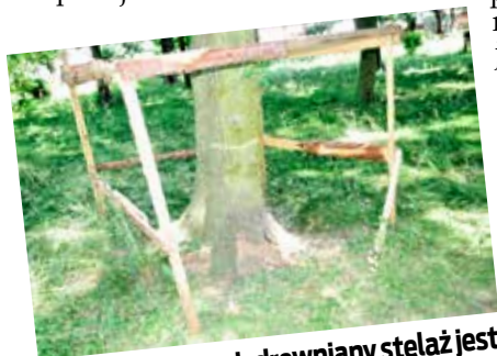
W wielu miejscach drewniany stelaż jest potamany

zabezpieczenie ustawione na przyczółkach mostku.