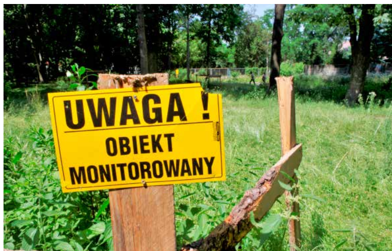
W parku pojawiły się informacje o monitoringu

Kilka dni temu w parku pojawiły się tabliczki z ostrzeżeniem, że teren jest monitorowany. To efekt zniszczeń w parku. Łamane są drewniane płotki okalające drzewa. Notorycznie kopane jest też blaszane