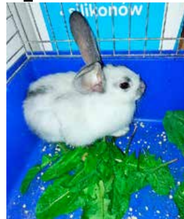
Królik czeka na swoich właścicieli. Można go odebrać w siedzibie SM w Łęczycy

- Mój sąsiad rano przyszedł i powiedział, że w krzakach przy mostku na Waliszewie schowały się trzy szczenięta. Ktoś je porzucił dzień wcześniej, bo były całkiem przemoczone po czwartkowej burzy. Zabrałam je do siebie, nakarmiłam i wyczeszałam - usłyszałam od mieszkanki, która