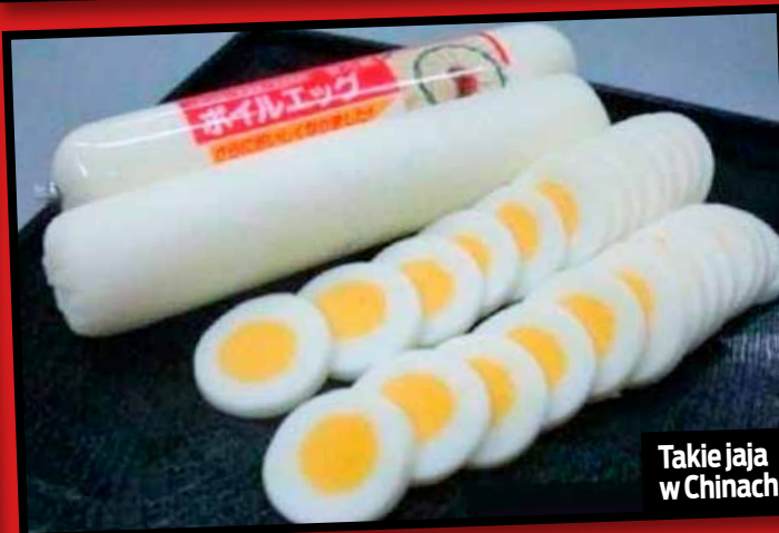
Takie jaja w Chinach