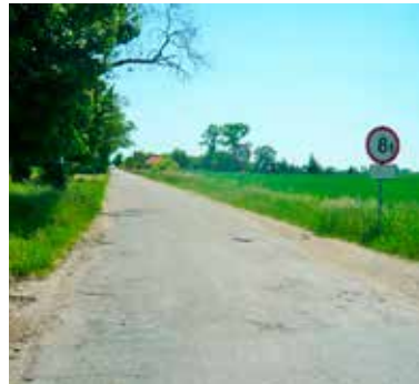
Mieszkańcy gminy Daszyna narzekają m.in. na zły stan drogi prowadzącej od krajówki do Mazewa

- Jest coraz cieplej, w mieście odbywają się imprezy plenerowe, na ulicach odnotowujemy wzmożone natężenie ruchu, a skrzyżowanie ulicy Belwederkiej z Lotniczą przypomina