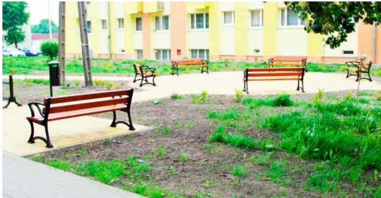
Oprócz ławek na zrewitalizowanym terenie, mieszkańcy poprosili o dodatkowe ławki w cieniu