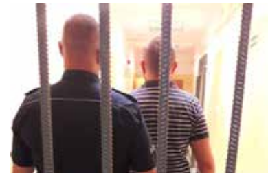
Informację z groźbą wybuchu bomby w szkole wystąpił do starostwa powiatowego w Łęczycy 36-latek

W tym samym czasie policjanci wydziału kryminalnego współpracując z funkcjonariuszami wydziału do walki z cyberprzestępczością KWP