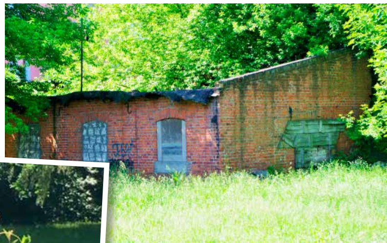
Kobieta i mężczyzna zadomowili się przy pustostanie

dniach opuścili pustostan. Nie wiadomo, gdzie się ulokowali, ale często można ich spotkać śpiących na ławkach - na ulicy Kaliskiej lub w alejach Jana