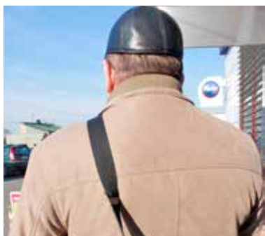
Pan Jacek obawia się eskalacji konfliktu na linii USA - Iran

- Wydaje mi się, że ten temat jest przez lokalną władzę ignorowany. Czy ostatnio były jakieś zakupy masek przeciwgazowych? A co ze schronami, w których w razie jakiegos zagrożenia mogliby się ukryć mieszkańcy? Czy na terenie naszego miasta są takie schrony? Czy miasto organizuje ćwiczenia symulacyjne? - zadaje szereg pytań mężczyzna.