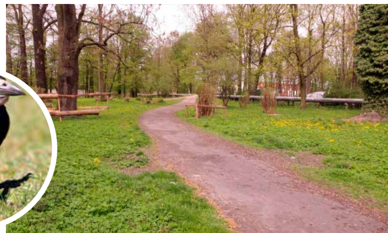
Przez gawrony prace zostały przerwane. W tym tygodniu ekipa ma ponownie zabrać się za przycinanie gałęzi w parku miejskim

związku z czym na początku czerwca wykonawca przystąpi do kontynuowania przerwanych przez ekologów