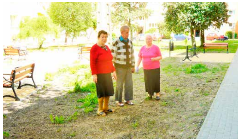
Mieszkańcy pytają o zrealizowany projekt

- Po pierwsze na klatkach schodowych nie eksponowaliśmy pro-