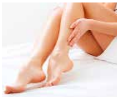
Po goleniu maszynką skóra na nogach jest podrażniona. Często pojawiają się czerwone krostki

Chronicznie nawracające krostki po goleniu traktuj właśnie tym. To główny składnik większości powszechnie dostępnych kosmetyków przeciwtrądzikowych. Krostki, które nie chcą zniknąć albo uporczywie nawracają, zaczynają zachowywać się jak trądzik, zatrzymując sebum w mieszkach włosowych, co z kolei prowadzi do produkowania ropy. Nadtlenek benzoilu leczy zmie-