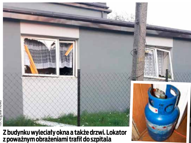
Z budynku wyleciały okna a także drzwi. Lokator z poważnymi obrażeniami trafił do szpitala