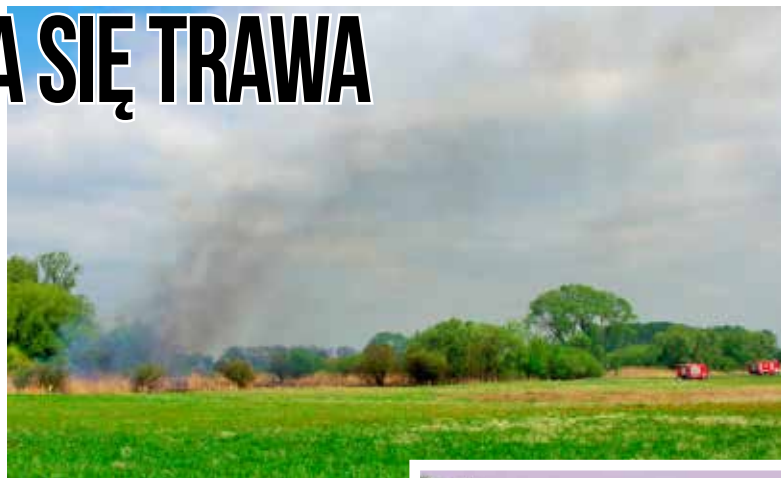
Ciemny dym widoczny był z daleka

ogień nie rozprzestrzenił się na większą powierzchnię. (zz)