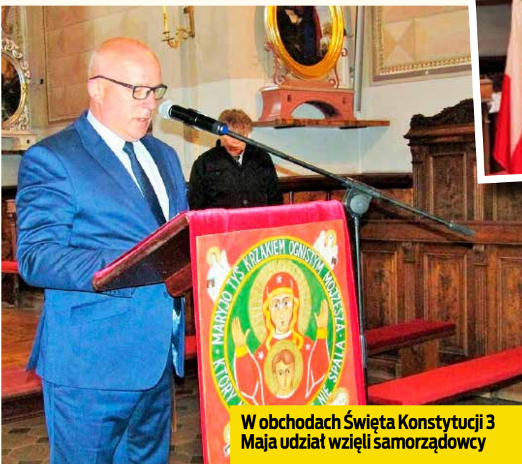
W obchodach Święta Konstytucji 3 Maja udział wzięli samorządowcy