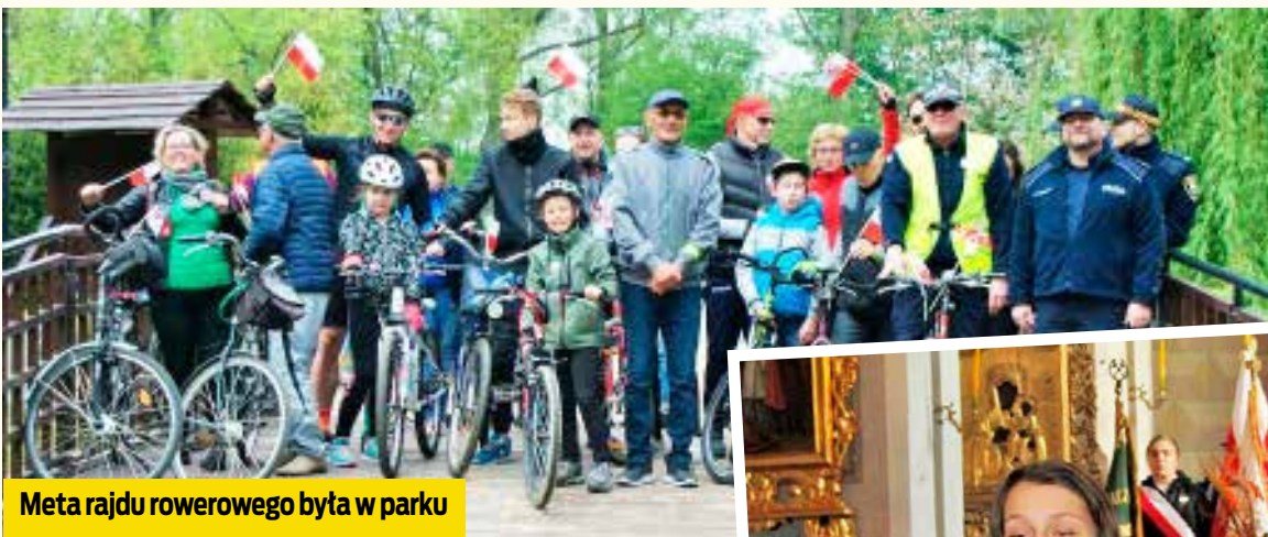
Meta rajdu rowerowego była w parku