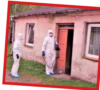
Pracownicy zdezynfekowali komunalne mieszkanie

- Tu działy się straszne rzeczy. Córki praktycznie nie interesowały się matką. A wnuczki biły swoją babcię. Bardzo często dochodziło do rękoczynów. Przyjeżdżała policja, jednak nikt nie potrafił skutecznie ostudzić zapędów wnuczków. To jest bardzo smutne. Sąsiadka miała dobre serce i niestety nie składała formalnych zeznań przeciwko swoim dręczycielom. A obrażenia były poważne. Od tego bicia sąsiadka miała krwiaka na głowie, musiała poddać się operacji. Jestem pewna, że organizm kobiety w końcu nie wytrzymał tego wszystkiego. Skrajnie wyczerpana odeszła w