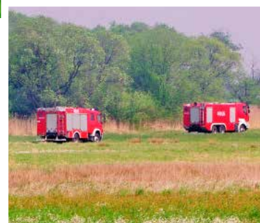
Na taką szybko przyjechali strażacy

ogień nie rozprzestrzenił się na większą powierzchnię. (zz)