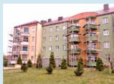
W tym roku remontowane są balkony i elewacje trzech bloków. Na zdjęciu blok przy ul. Słonecznej

Prezes Gławęda dodaje, że niedługo wyremontowane też zostaną wiatrołapy i drzwi wejściowe w blokach przy ul. Sobieskiego 8 i 10a. To nie wszystko. Władze spółdzielni planują również inwestycję przy ul. Zielonej.