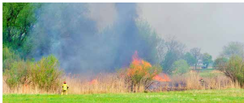
Ogień na skraju parku i tak był duży