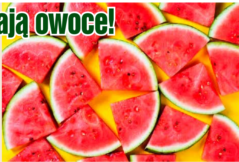
Arbuzem można zająć się do woli. Jest najmniej kalorycznym owocem

Arbuz zachwyca, jeśli chodzi o jego niskokaloryczność - w 100 g tego owocu znajdziemy 30 kilokalorii. Trzeba jednak pamiętać, że waga jednego plastra arbuza to około 350 g i choć owoc składa się w 92 procentach z wody, witamin i składników mineralnych zawiera niewiele. W arбуzie znajdziemy za to opóźniające proces zdarzenia i zmniejszające ryzyko wystąpienia nowotworu antyoksydanty oraz wspomagający regenerację mięśni aminokwas - cytrulinę. Arbuz działa również moczopędnie i poprawia przemianę materii.