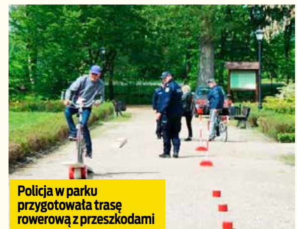
Policja w parku przygotowała trasę rowerową z przeszkodami