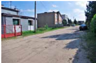
Do groźnego zdarzenia doszło na ul. Wiatracznej

Dochodziła godzina 18.30, gdy na osiedlu rozległ się potężny huk. Wielu mieszkańców wybiegło przed domy.