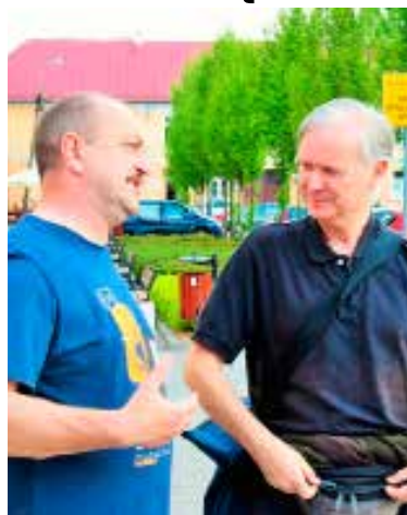
Podróżnik z Wlk. Brytanii (z prawej) odwiedził Łęczycę

Gm. Łęczyca Przypadkowi świadkowie, na jednej z dróg gminy Łęczyca zwrócili uwagę na jadące "wężykiem" osobowe renault. Kiedy kierowca zatrzymał auto, mając podejrzenie co do jego stanu trzeźwości, świadkowie zatrzymali się tuż za nim, aby zareagować na ewentualne niebezpieczeństwo na drodze. Zanim zdążyli zadzwonić na numer alarmowy, na miejscu był już patrol policji. Czujni świadkowie przekazali swoje spostrzeżenia wracającym z interwencji stróżom prawa. Mężczyznę, który kierował osobówką był 43-letni obywatel Ukrainy, a podejrzenia co do jego stanu trzeźwości były słuszne. Policjny alkomat wykazał ponad dwa promile alkoholu w jego organizmie. Policjanci zatrzymali mu uprawnienia, a on sam noc spędził w policyjnym areszcie. Za prowadzenia auta w stanie nietrzeźwości grozi kara nawet do 2 lat pozbawienia wolności, wysoka grzywna oraz zakaz prowadzenia pojazdów.