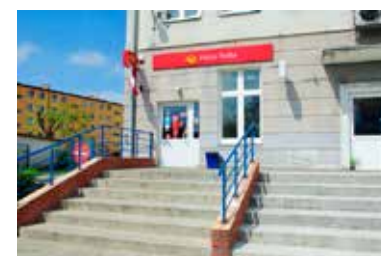
Czy protest listonoszy wpłynie na obsługę klienta w łęczycyjskiej placówce?

- Jednocześnie pracodawca zaprosił do kontynuowania rozmów w następnym tygodniu. Obecne postulaty organizacji reprezentatywnych wiążą się ze zwiększeniem kosztów wynagrodzeń do kwoty 660 mln w tym roku. Od 2016 roku systematycznie i zgodnie z założoną strategią podnoszone są zarobki. W efekcie, przeciętny koszt wynagrodzenia na pracownika (włączając wynagrodzenie zasadnicze,