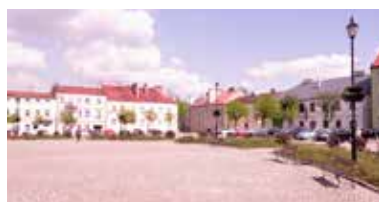
Na pl. Jana Pawła II póki co ogródka piwnego nie ma

Starsi lokatorzy kamienic przy pl. Jana Pawła II trzymają kciuki, aby w centrum Ozorkowa nie został rozstawiony ogródek piwny. Złe wspominają okres, gdy działał. Wówczas mieszkańcy narzekali na hałas. Z kolei młodszy ozorkowianin