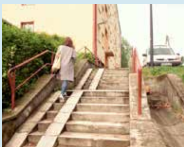
Spółdzielnia wyremontuje również duże schody prowadzące od bloku przy ul. Zielonej do Przejazd

szymy. - W pierwszym roku wyremontowaliśmy balkony i