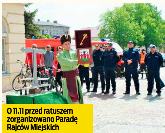
O 11.11 przed ratuszem zorganizowano Paradę Rajców Miejskich