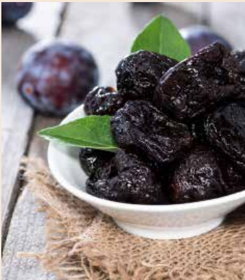
W 100 g suszonych śliwek jest aż 240 kcal

Suszone śliwki, podobnie jak inne suszone owoce (daktyle, figi), zawierają mało wody, przez co są wysokokaloryczne - w 100 g śliwek znajdziemy 240 kcal. Warto