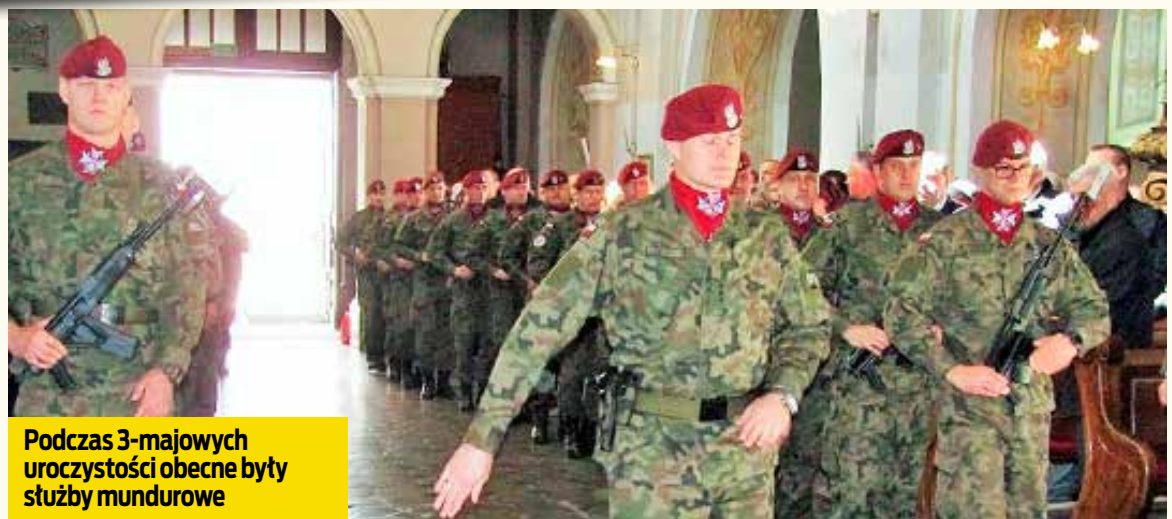
Podczas 3-majowych uroczystości obecne były służby mundurowe