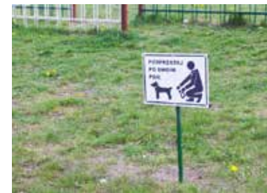
W ostatnim czasie na terenach zielonych ustawiono tabliczki przypominające, że po psach należy sprzątać

Nieposprzątanie nieczystości np. po swoim psie może skutkować pouczeniem, nałożeniem mandatu karnego lub skierowaniem sprawy do sądu na zasadach i w trybie przewidzianym w kodeksie postępowania w sprawach o wykroczenia.