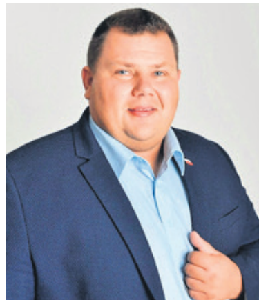
Prezes TBS mówi o zmienionych zasadach przyznawania preferencyjnych kredytów przez BGK