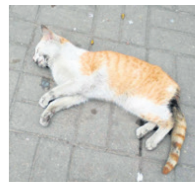
Kot najprawdopodobniej został potrącony przez samochód

specjalną klatką do przewozu zwierząt. Po przyjeździe pracownika z klatką, kot został przewieziony do weterynarza. Okazało się, że zwierzę ma bardzo ciężkie obrażenia wewnętrzne, weterynarz nie był w stanie go uratować i podjął decyzję o uśpieniu. Pracownik, który przyjął zgłoszenie, od razu zareagował na zgłoszoną sytuację i z pewnością nie użył niegrzecznego sformułowania w stosunku do mieszkanki, co potwierdza on sam oraz nacelnik Wydziału PP, który był obecny podczas rozmowy pracownika z mieszkanką. Pracownik ten jest osobą rzetelnie wypełniającą swoje obowiązki, wraz-