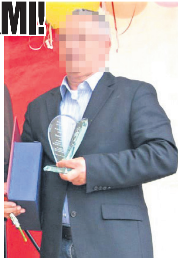
Przedsiębiorca był nagradzany za prowadzone w mieście interesy