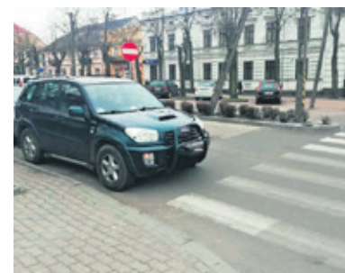
Przy pasach, w dodatku w obrębie skrzyżowania parkować nie można

Przypomnijmy, że za parkowanie w sposób niezgodny z przepisami ruchu drogowego grozi mandat karny w wysokości nawet 500 zł. (zz)