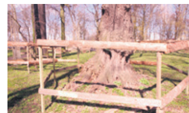
Drzewa w parku zostały ogrodzone

- Myślę, że park ogrodzimy mniej więcej za miesiąc - dodaje M. Kulesza. - Co najmniej do czerwca z parku nie będzie można korzystać, bo teren stanie się dużym placem budowy. (stop)