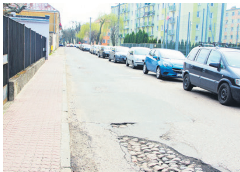
Ulica Dominikańska również ma być remontowana. Miasto ogłosiło przetarg na wykonanie dokumentacji