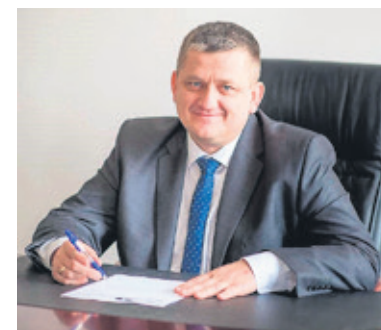
„Gmina rozważa możliwość usytuowania mieszkań w budynku na ul. Północnej” - mówi burmistrz

- Kiedyś było znacznie łatwiej uzyskać taki kredyt na budowę bloku. Problemem jest też to, że nie posiadamy wolnej działki na której taki blok można by wybudować - słyszymy.