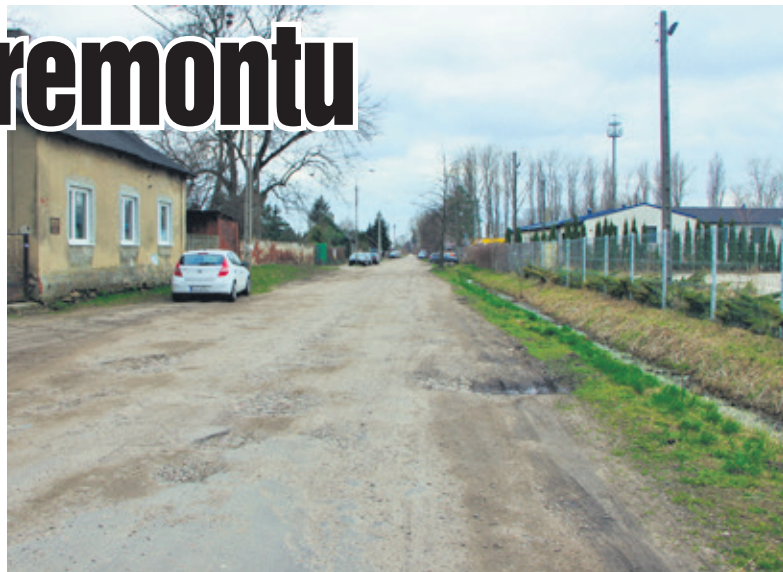
9 kwietnia nastąpi otwarcie ofert złożonych w przetargu na remont ulicy Górnicznej

- Na dzień dzisiejszy, planowane otwarcie ofert nastąpi 9 kwietnia, natomiast daty pozostałych czynności takich jak: podpisanie umowy, przekazanie placu budowy czy początek remontu będą znane po wyłonieniu wykonawcy - informuje Mateusz Kucharski z urzędu miasta.