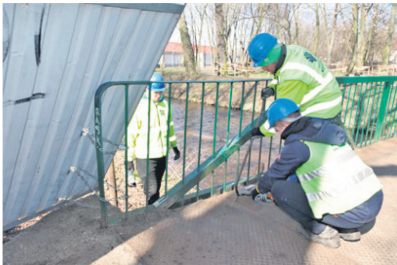
Pod koniec ub. tygodnia robotnicy wzięli się za demontaż mostka

Ozorkowianie patrząc na rozpoczynającą się w parku inwestycję nie podejrzewali, że prace trwać będą minimum do czerwca przyszłego roku. - Naprawdę tak długo? - nie krył