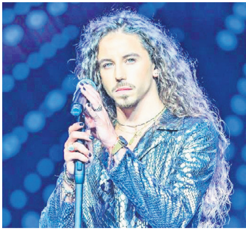
Michał Szpak zaśpiewa podczas Dnia Dziecka