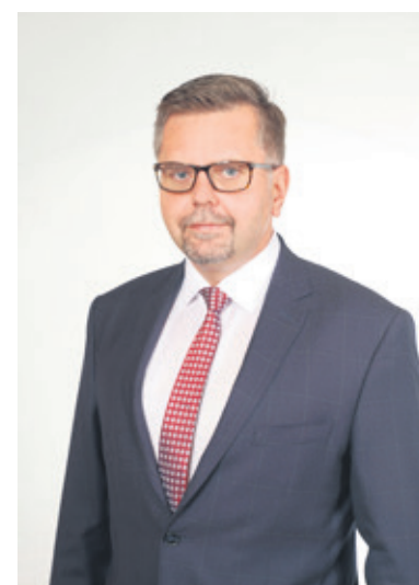
Burmistrz rozmawiał z dyrektorami o planowanym strajku

niem do strajku opowiedziało się 95 procent pracowników w szkole w Parzęczewie, w Chociszewie – 76 procent.