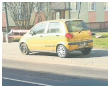
Na Kaliskiej parkowanie na chodniku jest niedozwolone

Kierowcy z braku miejsca do zaparkowania, często pozostawiają samochody tuż przy przejściu