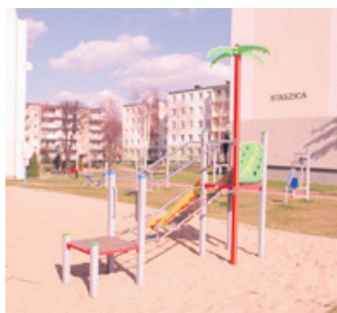
Spółdzielnia planuje modernizację kolejnych placów zabaw

dzzone krzewy i drzewa ozdobne. Spółdzielnia planuje modernizację kolejnych placów zabaw, które będą uzupełniane o nowe huśtawki, karuzele i inne urządzenia z wymaganymi atestami. Powstaną też kolejne siłownie plenerowe. Ich dokładne lokalizacje zostaną określone po majowych zebraniach członkowskich, na których mieszkańcy wskażą konkretne miejsca. W tym roku malowaniem objętych zostanie ok. 50 klatek schodowych, zostanie też wymienionych, podobnie jak w tamtym roku, ok. 200 ławek. Spółdzielnia mieszkaniowa ma też zabezpieczone środki na utworzenie kilkunastu miejsc postojowych przy ul. Sucharskiego 7