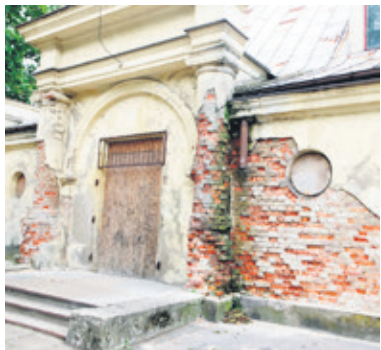
Wcześniej było tak

- Mogli chociaż przyłożyć się do tej roboty. A teraz wygląda to tak,