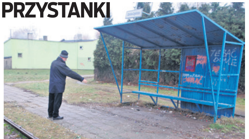
Mieszkańcy narzekają na zaśmiecone przystanki tramwajowe

„Przystanki komunikacji publicznej sprzątane są przez pracowników urzędu miasta. Trzy razy w tygodniu wybierane są śmieci z koszy i przy okazji sprzątane są śmieci wokół. Są miejsca, gdzie śmieci jest sporo, m.in. na przystanku (nieczynnym obecnie)