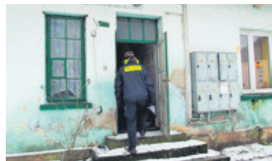
W środę odbyła się kolejna edycja ogólnopolskiej akcji badania liczby bezdomnych