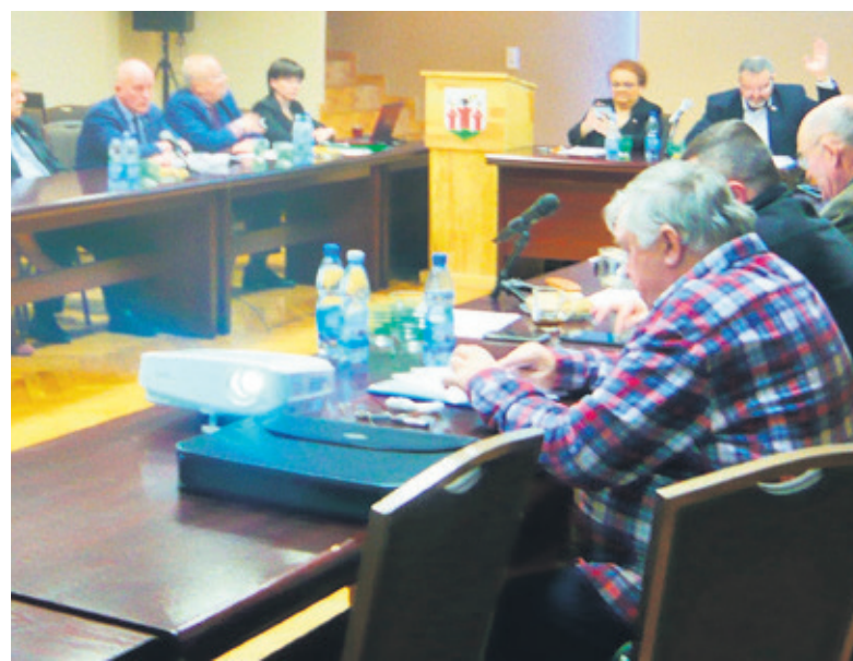
Uchwała ws. podwyżki za śmieci została podjęta większością głosów

segregować nie będziemy. Warto jednak spojrzeć na to bardziej pragmatycznie i dostrzec widoczną różnicę w stawkach między segregowanymi a niesegregowanymi odpadami. Jeśli uwzględnimy do tego fakt, że składowanie na wysypisku niesegregowanych odpadów jest też droższe po stronie wykonawcy, rachunek nam się upraszcza. Musimy jednak pamiętać, żeby składać deklaracje zgodne z prawdą. Jeżeli firmy odbierające odpady posegregowane przyjmą je jako zmieszane to powiadomią o tym fakcie samorząd, który z kolei będzie zmuszony ponownie podnieść stawki. Na nieprawdziwej informacji grupy ludzi stracimy wszyscy. Ustawa przewiduje również kary za podawanie nieprawdziwej informacji w sprawie segregacji odpadów. Ten rok jest więc dla nas trudny i przejściowy. Na składowisku wzrosła cena składowania odpadów zmieszanych ze 130 zł za tonę