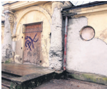
Teraz tak wygląda elewacja zapaćkana tynkiem

jakby ktoś wykonał prace na odczep się – słyszymy. - Na elewacji są same nierówności. Wygląda to źle.