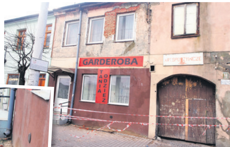
Kamienica, z której oderwały się kawałki tynku, została ogrodzona

W informacji przesłanej przez ozorkowski magistrat możemy się dowiedzieć, że tym roku przeznaczono 600 000 zł na modernizację komunalnego zasobu mieszkaniowego (w 2018 r. była to taka sama kwota). W ramach tych pieniędzy zostaną wykonane roboty dekarские - 270 000 zł, w tym: - kompleksowe naprawy dachów (ul. Kościuszki 24, Wyszyńskiego 36, Maszkowska 21, Maszkowska 43, Listopadowa 1, Nowy Rynek 12, Pl. Jana Pawła II 8, B. Joselewicza 2 (dokończenie), Wyszyńskiego 5 (dokończenie), Pl. Jana Pawła II 14 (dokończenie). Planowana też jest wymiana instalacji elektrycznej w lokalach mieszkalnych i obwodach gospodarczych - 70 000 zł, wymiana stolarki okiennej w lokalach mieszkalnych - 40 000 zł, wymiana stolarki drzwiowej do budynków i