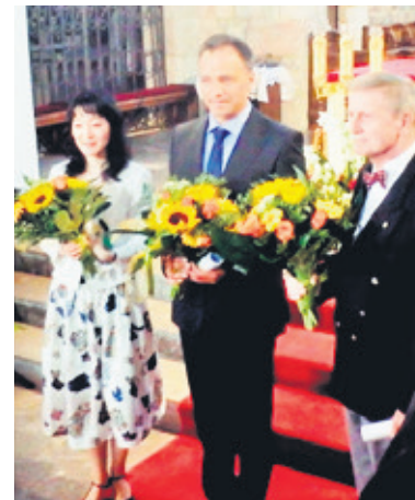
Cztery edycje wręczenia nagród organizowane były na ziemi łęczyckiej

automatycznemu przedłużeniu o kolejne 4 lata, chyba, że któraś ze stron zgłosiłaby na piśmie chęć od jego odstąpienia. Tak się nie stało, więc porozumienie zostało przedłużone i jego treść również. Dzięki podjęciu wspólnych wysiłków, sukcesywnie udało przeprowadzić się cztery edycje ceremonii wręczenia Nagród im. Benedykta Polaka. W tym roku przypada piąta edycja, którą, z zachowaniem odpowiedniego dystansu, można nazwać małym jubileuszem. Daje to oczywiście powody do radości, ponieważ świadczyć to może o tym, że ceremonia stała się bliska sercu członkom Kapituły i nie tylko. Przypomnienie treści porozumienia, a zwłaszcza zapisu o tym, gdzie zlokalizowana będzie ceremonia jest istotne, gdyż, z okazji właśnie zbliżającej się piątej edycji, postanowiono bez konsultacji z władzami miasta Łęczyca i Starostwa Powiatowego, że odbędzie się ona na Zamku Królewskim w Warszawie. Nasze stanowisko w sprawie zawartego porozumienia, jak i przyszłych edycji ceremonii wręczenia Nagród im. Benedykta Polaka jest jasne i niezmiennie. Chcemy kultywować pamięć o wybit-