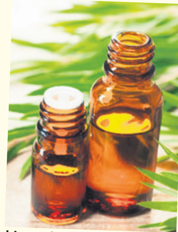
bica całkowicie została wyleczona to płytka paznokcia musi zupełnie odrosnąć.

Olejek z drzewa herbacianego jest stosowany od wieków w leczeniu różnych dolegliwości i posiada on wiele praktycznych zastosowań w codziennym życiu. Ma on działanie przeciwbakteryjne i przeciwwirusowe, zatem jest świetny na bolące gardło, katar, kaszel czy zapalenie zatok. Oprócz infekcji sezonowych za pomocą olejku można wyleczyć wiele problemów skórnych, w tym trądzik, grzybicę czy łupież. W grzybicy paznokci smaruj zainfekowane grzybicą paznokcie 2 razy dziennie przez minimum 2 miesiące. Na efekty trzeba długo czekać, gdyż aby grzy-