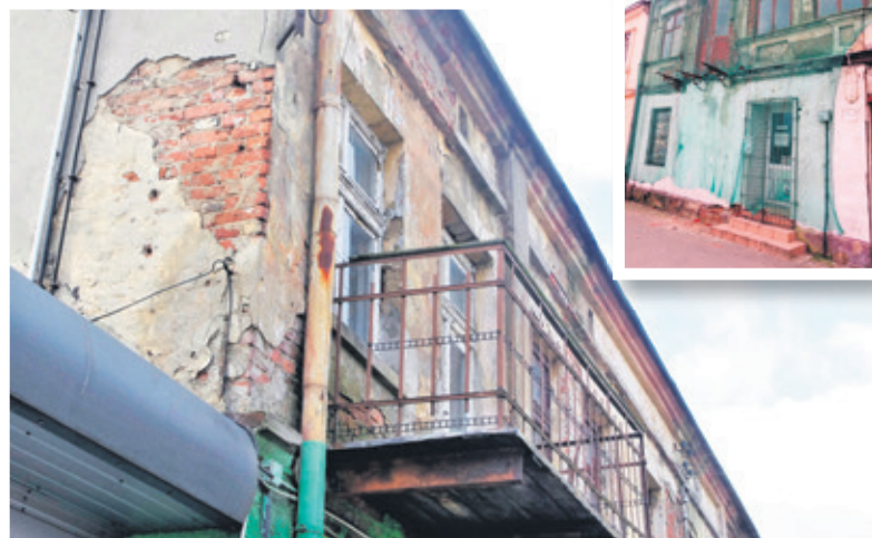
W mieście, niestety, nie brakuje zrujnowanych kamienic

OZORKOWSKA SPÓŁDZIELNIA MIESZKANIOWA INFORMUJE, ŻE POSIADA DO WYNAJĘCIA LOKALE UŻYTKOWE UL. NOWE MIASTO 3 W OZORKOWIE O POWIERZCHNI 72,06 m 2 . UL. PIŁSUDSKIEGO 6 W OZORKOWIE O POWIERZCHNI 33,12 m 2 . ZAINTERESOWANYCH ZAPRASZAMY DO SIEDZIBY SPÓŁDZIELNI, OZORKÓW, UL. STASZICA 1, POK NR 10. TEL.: 42 718 50 87.