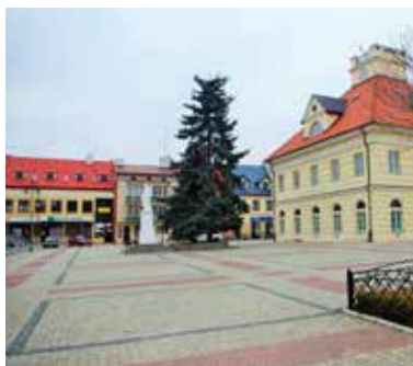
Plac T. Kościuszki nie jest już udekorowany świątecznymi iluminacjami