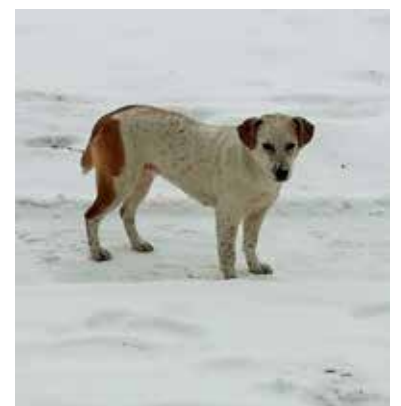
Suka błąka się od ponad tygodnia w centrum miasta. Jest przestraszona i zmarznięta

Szczeniaki z dworca zostały znalezione w środę. Pracownik ochrony powiadomił o psach straży miejską. Szczenięta schowały się pod jednym z zaparkowanych samochodów, pewnie dlatego, żeby ogrzać się od ciepłego jeszcze silnika. Zwierzaki zostały przewiezione do łęczyckiego schroniska i