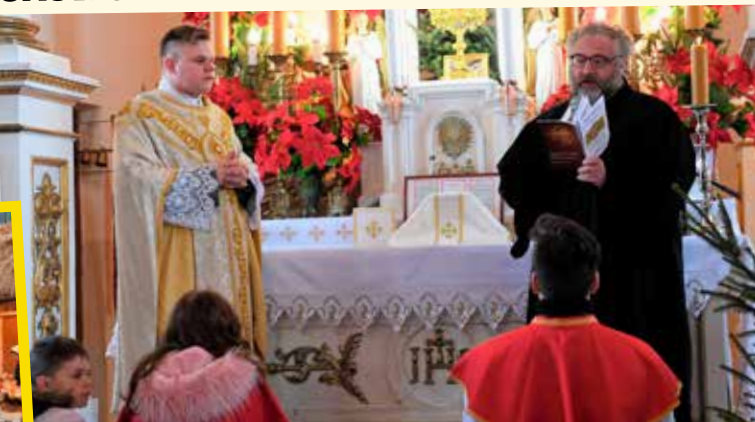
W Nowej Sobótce odprawiono nabożeństwo ekumeniczne

Głównym założeniem podczas wspólnej eucharystii rok w rok jest porozumienie między przedstawicielami różnych nacji i przyna-