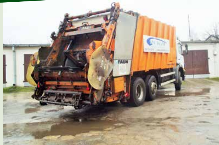
Od kwietnia znacznie wzrosną opłaty za wywóz śmieci

Według nowej taryfy (przez pierwszy rok jej obowiązywania) za wodę mieszkańcy zapłacą o 1,6 zł więcej, czyli 5,12 zł/m 3 a za ścieki 5,24 zł/m 3 . W środę nowe stawki jeszcze nie obowiązywały, wejdą w życie z początkiem lutego.