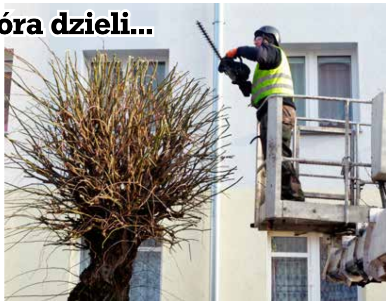
Spółdzielnia mieszkaniowa zleciła przycinkę

Szef firmy wykonującej przycinkę zapewnia, że prace wykonywane są profesjonalnie. Założenie jest takie, aby drzew nie okaleczyć.