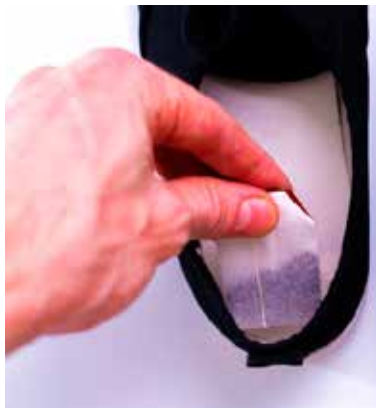
Herbata doskonale pochłania wilgoć i przykre zapachy

W podobny sposób możesz zrobić skuteczny naturalny odświeżacz powietrza. W tym wypadku torebki z herbatą lub herbaciane listki zalej wodą i podgrzewaj na małym ogniu. Gdy płyn zacznie parować, sam poczujesz, jak bardzo jest skuteczny.