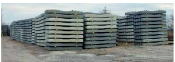
Na łęczyckim dworcu znajdują się już nowe podkłady kolejowe

Niemal 130 mln zł netto będzie kosztować opracowanie dokumentacji i modernizacja