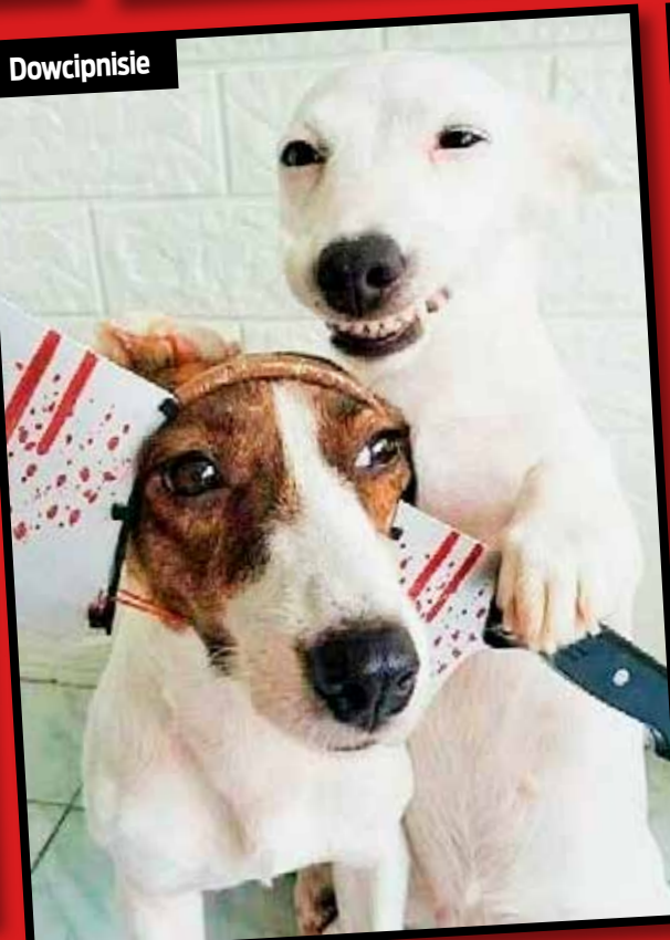
Psi domowy monitoring