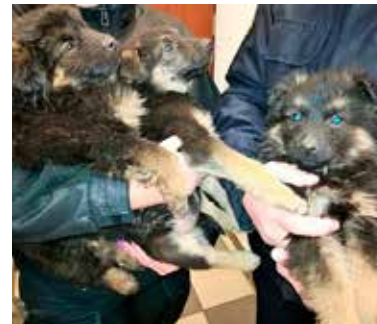
Trzy szczenięta porzucone przy dworcu zostały adoptowane

szczęśliwie, wszystkie znalazły już nowych właścicieli. O ile młode psy szybko są adoptowane, ze starszymi zwierzkami jest większy problem. O kolejnym bezdomnym czworonogu strażnicy miejscy otrzymali zgłoszenie pod koniec tygodnia. Sunia od kilku dni błąka się w rejonie placu T. Kościuszki. Dokarmiają ją okoliczni mieszkańcy, ale jest przemarznięta, nieufna i przestraszona. Pracownicy Zieleni Miejskiej próbowali ją złapać, bezskutecznie.