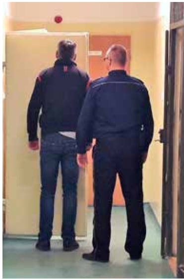
46-letni złodziej trafił do aresztu