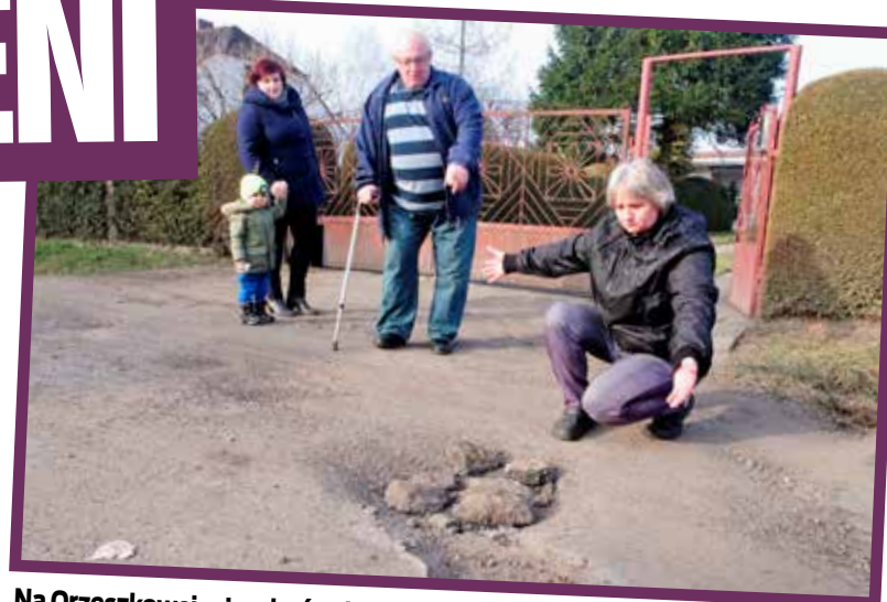
Na Orzeszkowej mieszkańcy tatają dziury w drodze

Jak bardzo ryzykuje się jazdę na rowerze po takiej drodze,