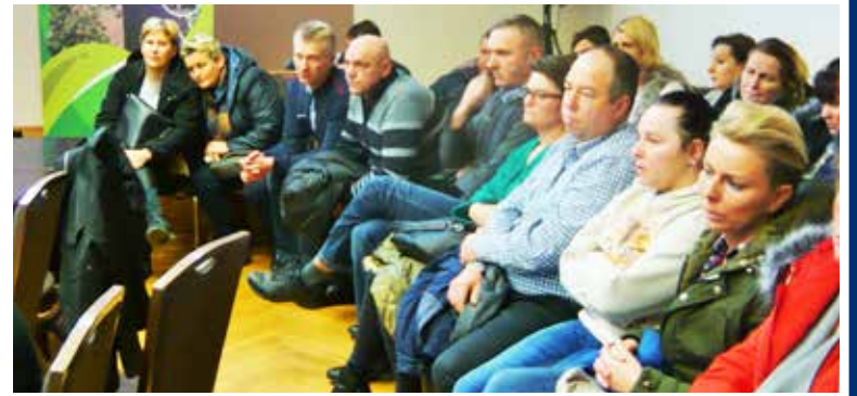
Na czwartkową komisję przyszło wielu rodziców

Czwartkową dyskusję zakończono głosowaniem w przedmiocie wydania opinii o projekcie uchwały o likwidacji Szkoły Podstawowej w Siedlcu. Dwoje radnych było przeciwnych, pięciu za i 1 wstrzymujący, co oznacza, że podobnie jak na poniedziałkowej komisji oświaty większość radnych poparła likwidację placówki.