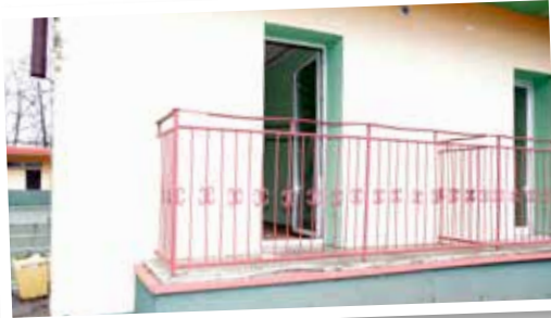
To przez ten balkon na parterze do budynku weszli nieproszeni goście

wyniku tej sytuacji rowerzysta został potrącony przez pojazd. Uczestnicy zdarzenia byli trzeźwi. Nikt nie doznał obrażeń ciała. Na kierującą pojazdem nałożono mandat karny. Z kolei 14 stycznia około godziny 16:00 na ulicy Sienkiewicza w Uniejowie zderzyły się dwa pojazdy. Kierującym siodłowym marki DAF wraz z naczepą ciężarową typu cystema nie dostosował prędkości do warunków panujących na drodze. Pojazd wpadł w poślizg, zjechał na przeciwległy pas ruchu i doprowadził do zderzenia z prawidłowo jadącym samochodem osobowym marki opel. Kierowcy pojazdów byli trzeźwi, nie doznali obrażeń ciała. Na 56-letniego kierowcę pojazdu ciężarowego nałożono mandat karny. Podczas czynności służb ratowniczych na drodze K-72 odbywał się ruch wahadłowy.