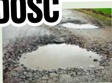
Droga przez wieś jest w dramatycznym stanie

który poinformował mieszkańców, że wniosek o dofinansowanie na remont drogi był złożony w ubiegłym roku, ale nie otrzymał pozytywnej oceny.