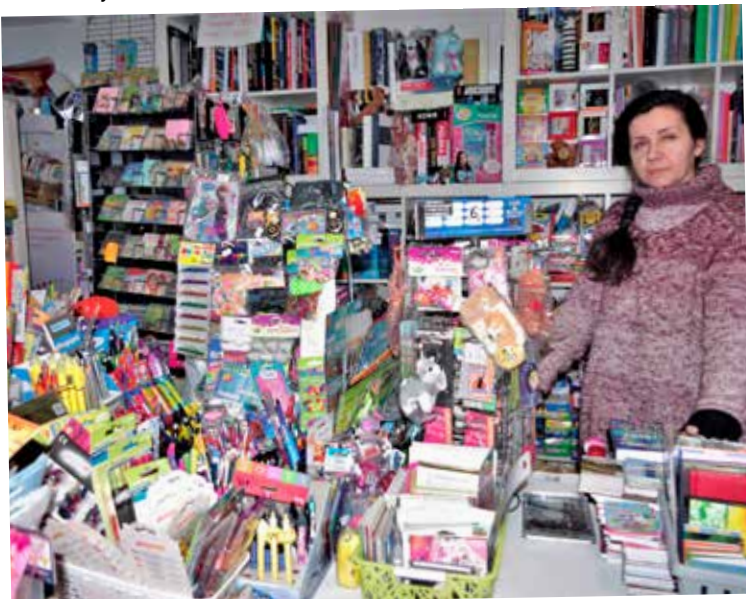
Księgarnia musiała rozszerzyć asortyment