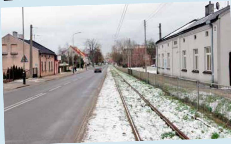
Do tragedii doszło przy ul. Konstytucji 3 Maja

- Widok był okropny - dodaje sąsiadka denata. - Sine zwłoki były na podłodze. Było widać, że były zamrożone. Tadeusz mieszkał przecież na poddaszu. W tym lokalu było chłodno, nawet, gdy napaliło się w małym piecyku. A