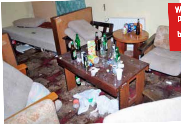
W pokojach pozostało wiele butelek po alkoholu

To prawda. W pokojach walają się na podłogach stopy pustych butelek po alkoholu. Są też opakowania