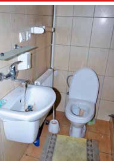
Bezdomni mieli do dyspozycji łazienki wraz z prysznicem

kartonowe po sokach a nawet pizzy. Faktycznie, bezdomni mieli tu niemały komfort.