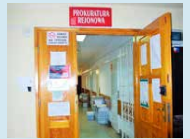
Pracownicy łęczyckiej prokuratury popierają ogólnopolski protest

Potwierdziliśmy w kilku łęczyckich szkołach, że nauczyciele nie chorują częściej niż dotychczas. (mku)