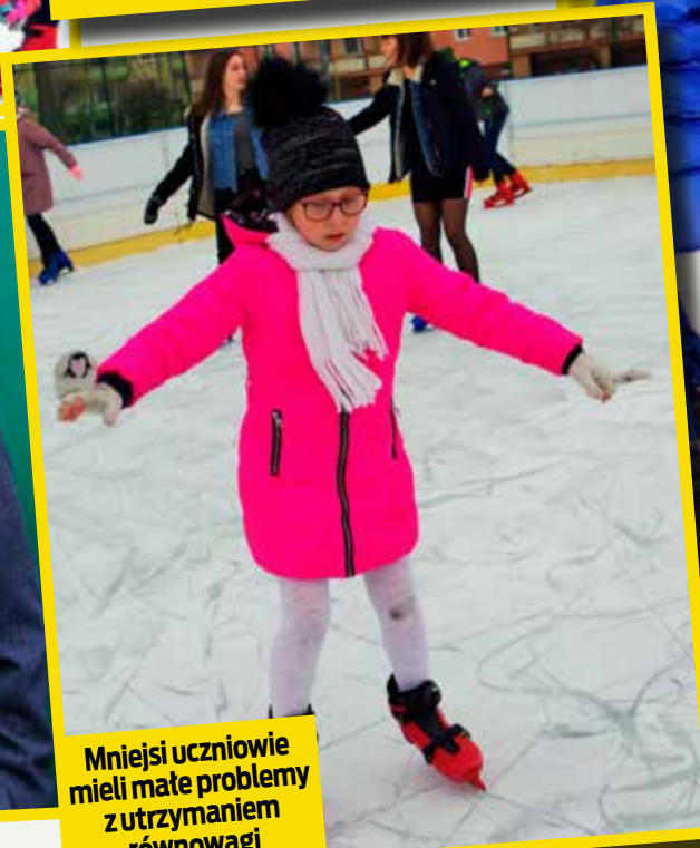
Mniejsi uczniowie mieli małe problemy z utrzymaniem równowagi