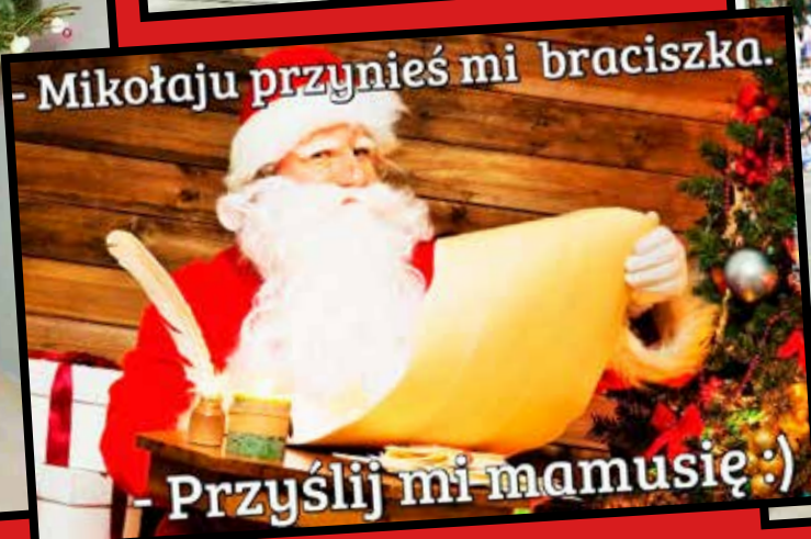
- Przyslij mi mamusię :)