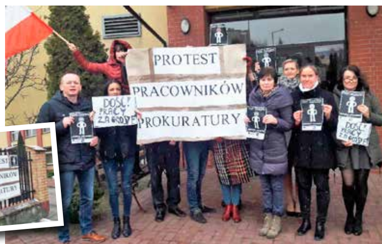
Pracownicy administracyjni walczą o wyższe wynagrodzenia