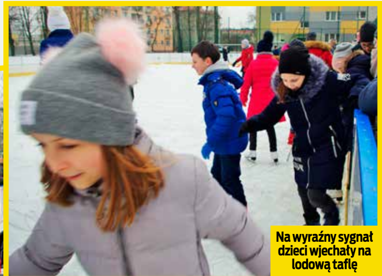
Na wyraźny sygnał dzieci wjechały na lodową tafelę