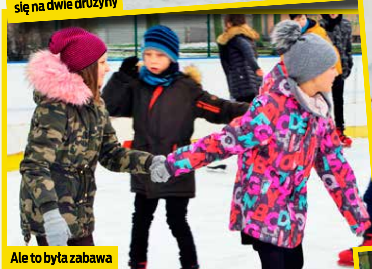
Ale to była zabawa