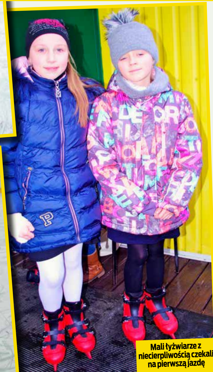
Mali łyżwiarze z niecierpliwością czekali na pierwszą jazdę