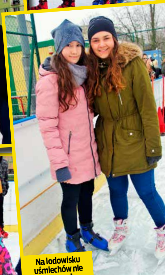
Na lodowisku uśmiechów nie brakowało