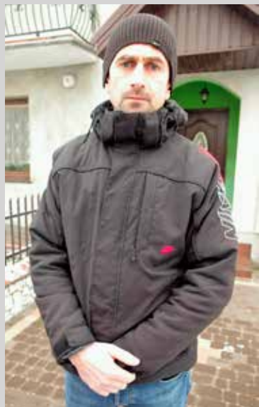
Na zdjęciu ojciec zmarłej dziewczynki