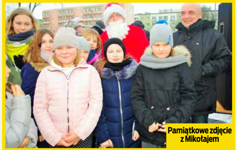
Pamiętkowe zdjęcie z Mikołajem