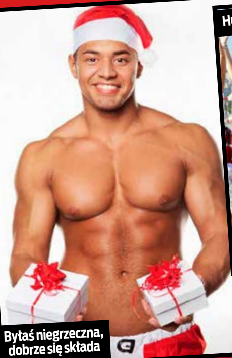
Byłaś niegrzeczna, dobrze się składa