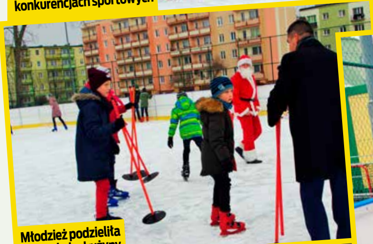
Młodzież podzieliła się na dwie drużyny