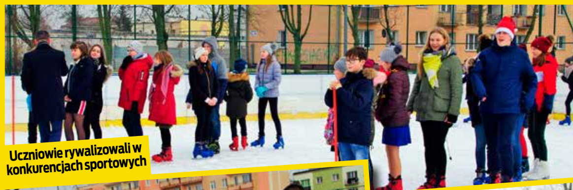
Uczniowie rywalizowali w konkurencjach sportowych

Od piątku można już jeździć na łyżwach po lodowej tafli pod chmurką. Lodowisko zlokalizowane jest przy Szkole Podstawowej nr 3. Przy okazji oficjalnego otwarcia zorganizowano sportową zabawę dla małych i trochę większych łyżwiarzy. Uczniowie placówek oświatowych, dla których organem prowadzącym jest miasto Łęczycza, mogą nieodpłatnie korzystać z lodowiska od poniedziałku do piątku w godz. 10.00 – 16.00 oraz w soboty w godz. 10.00 – 13.00.