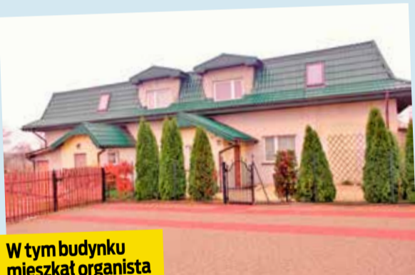
W tym budynku mieszkał organista