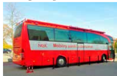
Krwiobus w Łęczycy jest w każdy piątek od godziny 8 rano.

Łęczycza Od piątku mobilny punkt poboru krwi znów parkuje przy urzędzie miejskim w Łęczycy. Krwiobus wrócił do poprzedniej lokalizacji po ponad trzymiesięcznej przerwie. Wówczas łączycy krwiodawcy krew oddawali w ambulansie RCKiK czekającym przed starostwem powiatowym. Zmiana była podyktowana remontem ulicy M. Konopnickiej.