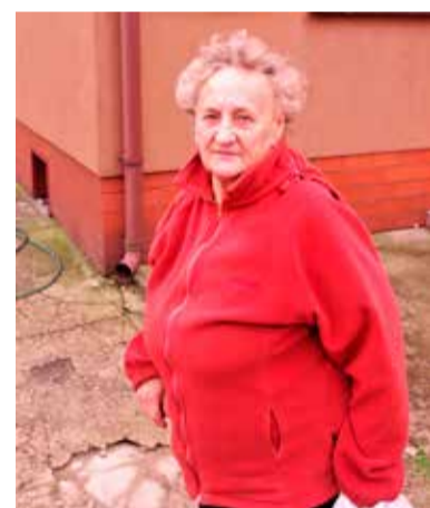
Pani Zofia negatywnie wypowiada się o planowanych inwestycjach

Ochrony Środowiska w Łodzi zgłosili wiele uwag, do których inwestor będzie musiał złożyć wyjaśnienia. Potencjalne inwestycje planowane są do realizacji zgodnie z miejscowym planem zagospodarowania przestrzennego na terenach przemysłowo – usługowych, na których dopuszcza się przedsięwzięcia znacząco oddziałujące na środowisko. Co do sprawy składowania odpadów, to jest to teren prywatny, w przypadku którego starosta zgierski w lipcu 2014 roku wydał zezwolenie na zbieranie odpadów innych niż niebezpieczne, a w maju 2015 zezwolił na zbieranie i tymczasowe składowanie odpadów niebezpiecznych. Przedsiębiorcy, którzy otrzymali powyższe zezwolenia na ww. działce mieli zbierać i tymczasowo magazynować odpady, a następnie przekazywać koncesjonowanemu jednostkom do przetworzenia. Wójt gminy Parzęczew wielokrotnie sygnalizował staroście zgierskiemu, wojewódzkiemu inspektorowi ochrony środowiska i marszałkowi województwa łódzkiego o nieprawidłowościach w magazynowaniu odpadów. W listopadzie 2017 r. starosta zgierski wygasił decyzję zezwalającą na zbieranie i magazynowanie odpadów na tej działce. W marcu 2018 roku wójt zawiadomił przedsiębiorcę o konieczności usunięcia pozostałości odpadów, informując o tym również starostę zgierskiego, WIOŚ i marszałka województwa łódzkiego. Instytucje te przeprowadziły na