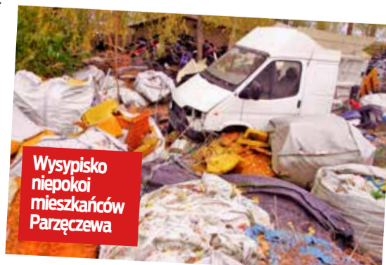
Wysypisko niepokoi mieszkańców Parzęczewa