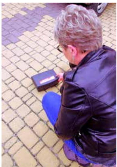
Mieszkańcy otrzymali od gminy pułapki na szczury