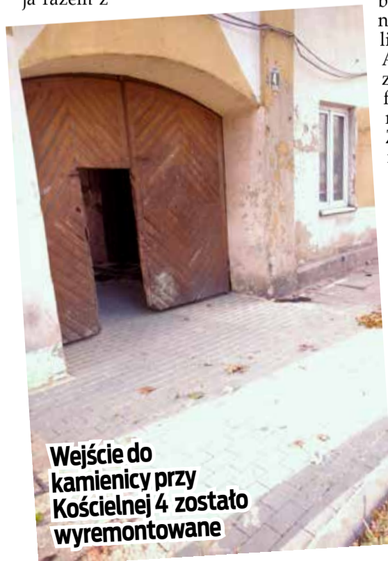
Wejście do kamienicy przy Kościelnej 4 zostało wyremontowane