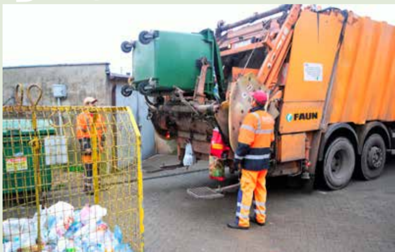
Najprawdopodobniej ceny za odbiór śmieci drastycznie wzrosną w nowym roku

Ozorków Nowelizacja ustawy śmieciowej wzbudza emocje, ponieważ od 1 stycznia 2019 r. przewidziana jest bardzo drastyczna zmiana prowadzenia selektywnej zbiórki odpadów.