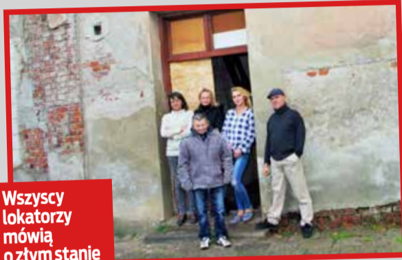
Wszyscy lokatorzy mówią o złym stanie budynku

Lokator zajmujący mieszkanie na parterze też ma wiele niedogodności. - Moje drzwi są bardzo blisko wejścia. Drzwi do kamienicy nie domykają się, nawet nie mają klamki. Toaletę