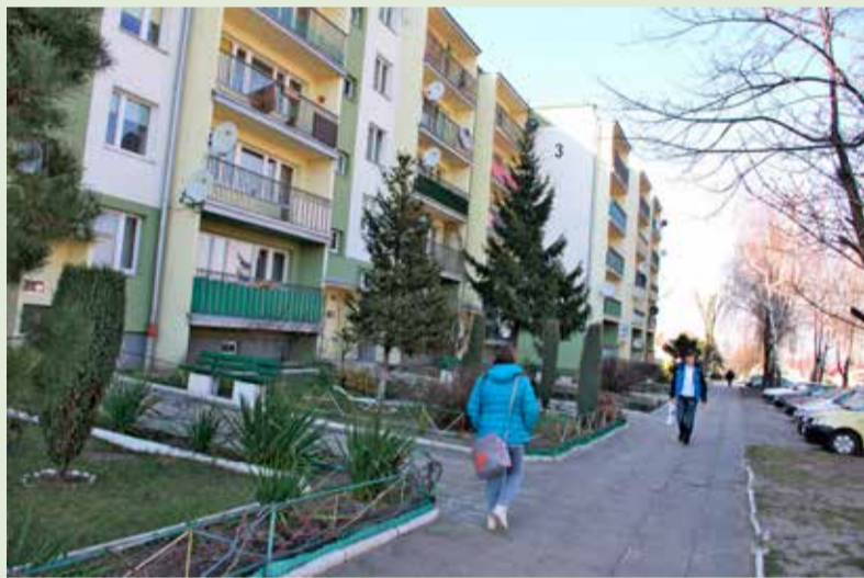
Lokatorzy obawiają się zmian w tzw. ustawie śmieciowej

Władze OPK podkreślają, że są to tzw. czynniki kosztotwórcze niezależne od spółki.