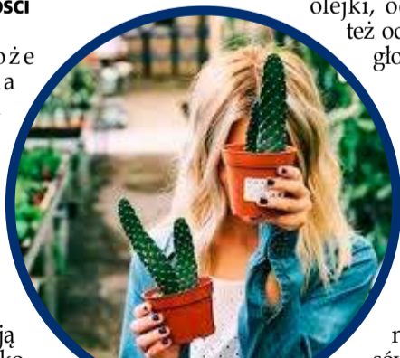
Kaktus bywa składnikiem wielu rodzajów kosmetyków

białka i węglowodanów złożonych. Warto wiedzieć, że kasza jaglana nie zawiera glutenu. Jest optymalnym pożywieniem podczas infekcji - jest lekko strawna, dostarcza wielu składników odżywczych, a do tego usuwa nadmiar śluzu z górnych dróg oddechowych. Jak jeść kaszę jaglaną? Niektórzy narzekają na mdły posmak kaszy, ale brak zdecydowanego smaku może być zaletą. Dzięki temu jest ona uniwersalna - sprawdza się i na słodko, i w daniach wytrawnych. Z jabłkiem, cynamonem i orzechami tworzy pyszne śniadanie, z pesto i warzywami - pożywną sałatkę. Jest dobrą bazą do kotletów warzywnych i zagęszczaczem zup. Zblendowana z owocami, np. bananem, i kakao stanowi pyszny budyń.