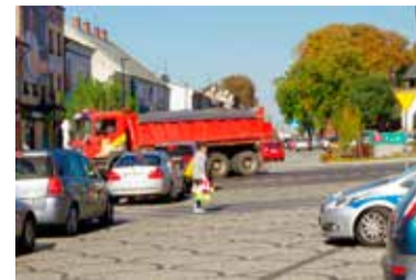
Policjanci w ub. poniedziałek przeprowadzili akcję „Niechronieni”

- Jak widać, pośpiech nie jest najlepszym doradcą. Pamiętajmy, że przestrzeganie przepisów leży w interesie wszystkich uczestników ruchu drogowego. Pieszy, jako niechroniony uczestnik ruchu dro-