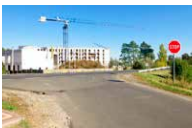
W tym miejscu powstać ma rondo

Dzięki inwestycji Aparthotel "Termy Uniejów" miejscowości przybędzie kolejne rondo. Usytuowane w miejscu obecnego skrzyżowania drogi krajowej 72 z traktem na Spycimierz poprawić ma bezpieczeństwo drogowe.