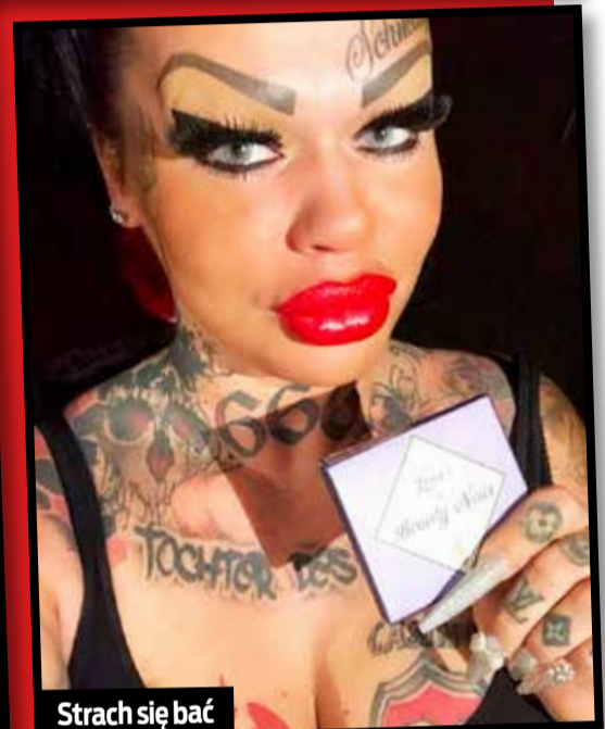
Strach się bać