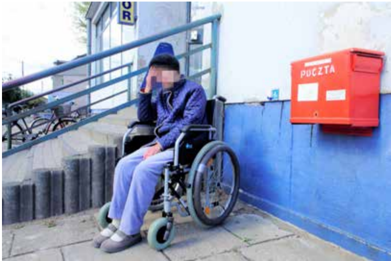
Podjazdu dla niepełnosprawnych bardzo brakuje

Poczta zapowiada, że remont będzie w przyszłym roku