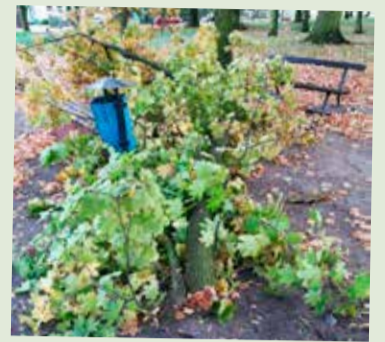
Potężna gałąź spadła tuż przy ławce

„Urząd Miejski w Ozorkowie planuje do końca roku usunąć 9 drzew rosnących na wale Bzury na