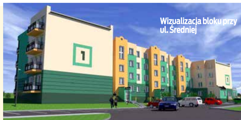
Wizualizacja bloku przy ul. Średniej

znajdzie się prawie 40 mieszkań. Metraż i standard lokali zależec będą od zapotrzebowania, a termin zakończenia prac od sytuacji na rynku materiałów budowlanych, która w tym momencie nie jest najlepsza, ponieważ są braki w zaopatrzeniu.