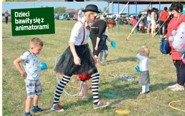
Dzieci bawiły się z animatorami