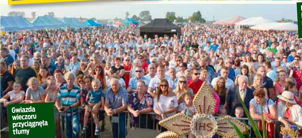
Gwiazda wieczoru przyciągnęła tłumy