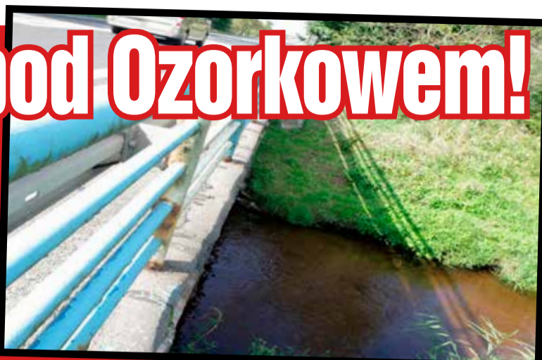
Potrącony przez opla pieszy przeleciał przez barierki. Wpadł prosto do rzeki

- Prowadzone jest śledztwo pod nadzorem prokuratury - mówi mł. asp. Magdalena Nowacka, rzecznik zgierskiej policji. - Do takich wypadków dochodzi niezwykle