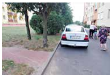
Na osiedlu przy Zielonej wykopano ławkę

- Chodzi o odwieczny dylemat, gdzie ławki mają stać, a gdzie nie - mówi z uśmiechem szef SM. - Niektórzy lokatorzy domagają się, aby spółdzielnia stawiała pod blokami ławki, a inni wręcz przeciwnie. Tak jest na przykład przy ul. Krasickiego 13a, gdzie lokatorzy ławki nie chcą. Z kolei przy ul. Krasickiego