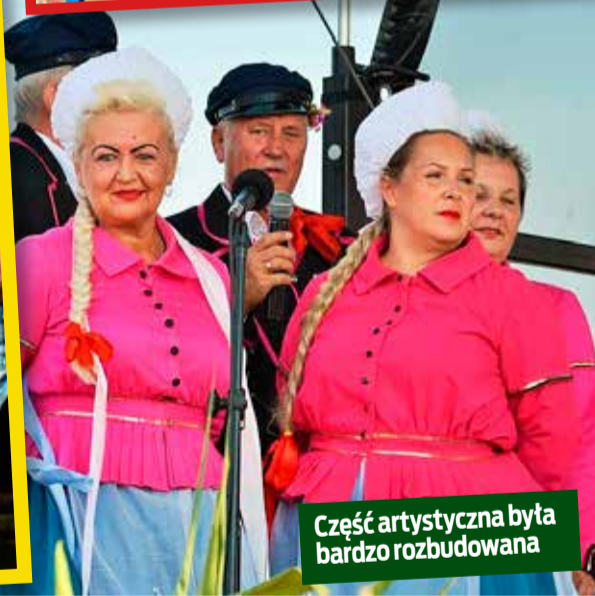
Część artystyczna była bardzo rozbudowana