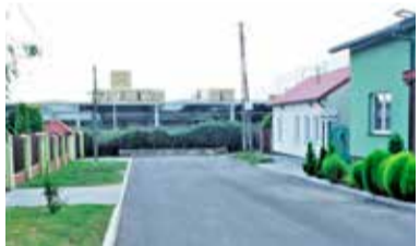
Na końcu Staszica znów nerwowo

Co jakiś czas na Staszica jest głośno z powodu działającej w bliskim