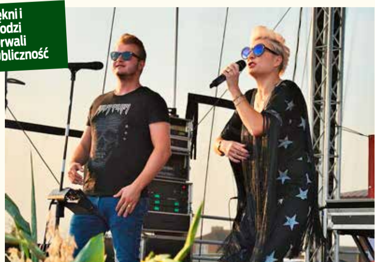
Piękni i Młodzi porwali publiczność