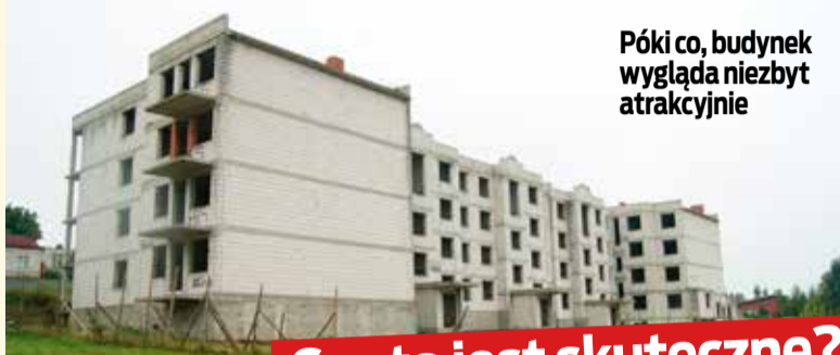
Póki co, budynek wygląda niezbyt atrakcyjnie

- W pierwszej kolejności chcemy doprowadzić teren do porządku i zabezpieczyć budynek przed dalszą dewastacją - mówi Sylwester Pawlak. - Jeśli wyniki ekspertyzy pozwolą na dokończenie istniejącego już obiektu, planuję przeznaczyć go na blok mieszkalny, w którym