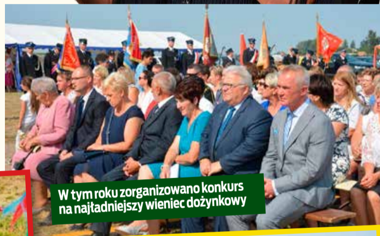
W tym roku zorganizowano konkurs na najładniejszy wieńiec dożynkowy