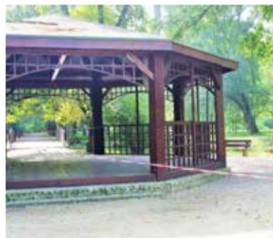
Pod podłogą było gniazdo pszczoł

W parku nie można jednak korzystać ze wszystkich ławek. W jednej brakuje oparcia, w kolejnej siedzi-