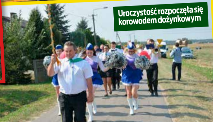
Uroczystość rozpoczęła się korowodem dożynkowym