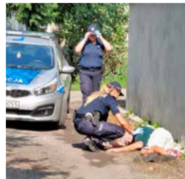
Niestety, to dość częsty widok. Policja interweniuje w sprawie pijanego delikwenta

- Raczej nie - odpowiada sekretarz. - Chcielibyśmy, aby park był miejscem przyjaznym, szczególnie dla rodzin z małymi dziećmi. Widok pijących alkohol nie jest pedagogiczny. Poza tym po nadmiernie wypitym alko-