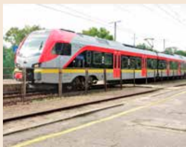
W Ozorkowie zatrzymują się jedynie pociągi aglomeracyjne i regionalne