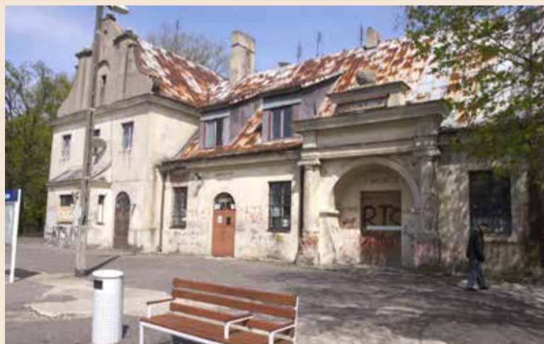
Czy poseł zmieni wizerunek dworcowego budynku?

postojów handlowych na stacji Ozorków, decyzja o jego utrzymaniu w kolejnym rozkładzie jazdy pociągów uzależniona będzie od liczby osób wsiadających i wysiadających na tej stacji.