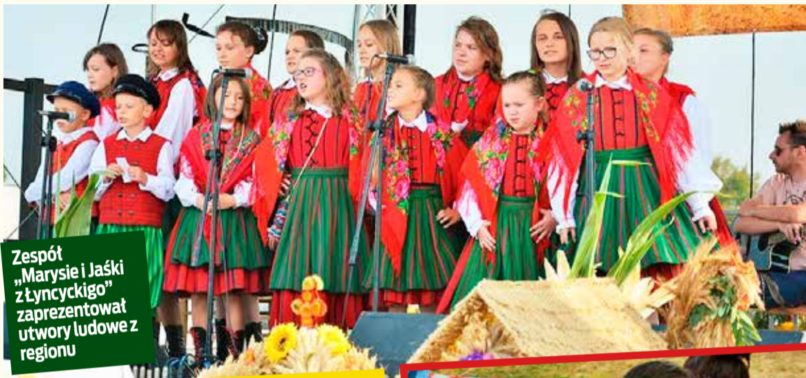
Zespół „Marysie i Jaśki z Łęczyckiego” zaprezentował utwory ludowe z regionu