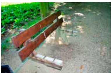
W niektórych ławkach brakuje desek