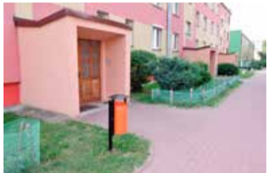
Pod blokiem przy Sobieskiego ławki niema. Czy będzie?

- Nie pamiętam, aby kiedykolwiek doszło do takiej sytuacji. Sprawcy musieli mieć przy sobie dość ciężki sprzęt, bo ławka była zabetonowana. Ciągnęli ją pod osłoną nocy, na chodniku i jezdni