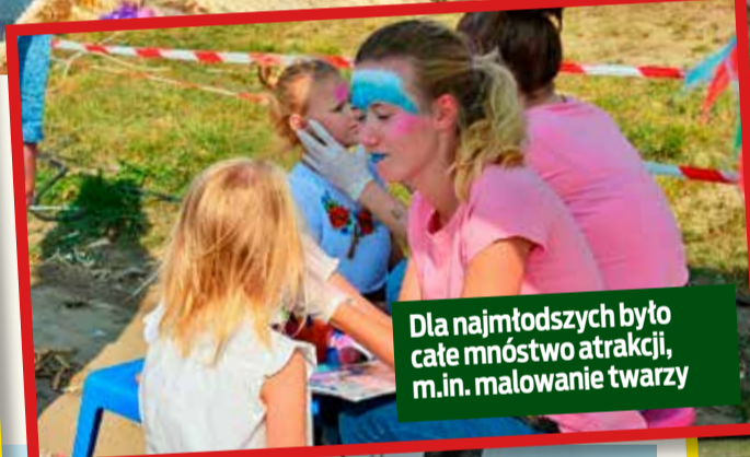
Dla najmłodszych było całe mnóstwo atrakcji, m.in. malowanie twarzy