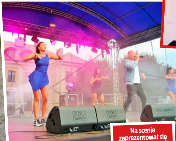
Na scenie zaprezentował się także zespół Focus