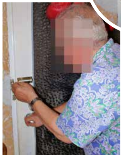
Od emeryta ustyszeliśmy, że boi się o swoje życie. Dlatego na noc zamyka drzwi

- Ten wieczór będę pamiętał do końca swych dni. Włączyłem sobie film. Moja żona wie, że w trakcie oglądania zazwyczaj zasypiam przed telewizorem. I tak też było. Usnąłem, ale jakiś wewnętrzny głos kazał mi się obudzić. Wstałem, poszedłem do kuchni. Od razu wyczułem ostrą woń ulatniającego się gazu. Kurek w kuchence był odkręcony. Wiedziałem, że zrobiła to moja żona. Włączyła gaz i celowo wyszła z mieszkania. Później już nie mogłem spać. Nad ranem żona wróciła do domu. Gdy mnie ujrzała w drzwiach, to tak jakby zobaczyła ducha. Jej reakcja była niesamowita. Zapytała zdziwiona... „to ty żyjesz?” - wspomina starszy pan.