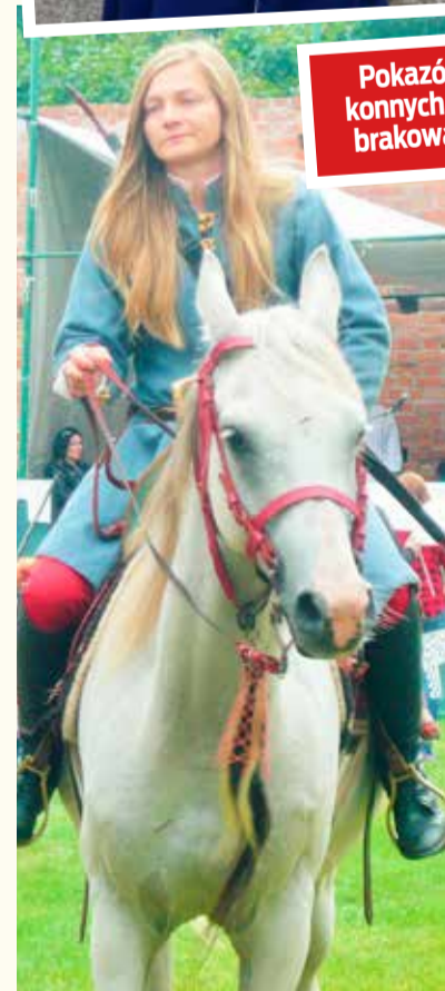
Pokazów konnych nie brakowało