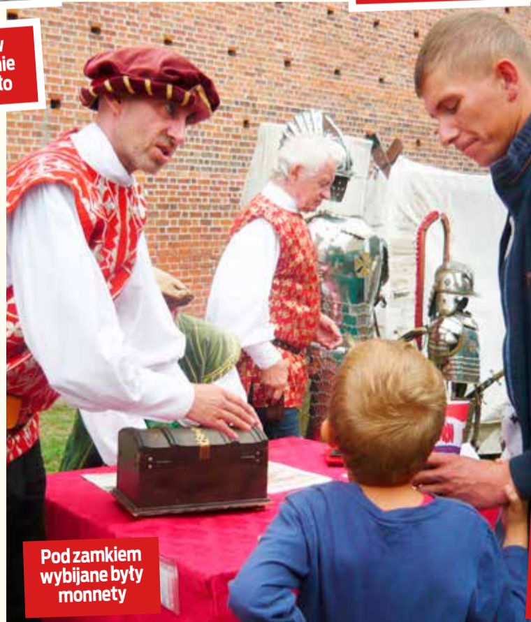
Pod zamkiem wybijane były monety