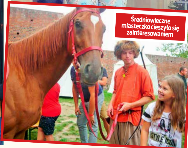
Średniowieczne miasteczko cieszyło się zainteresowaniem