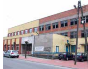
Czy pustostan zostanie wyremontowany pod potrzeby lokali socjalnych?