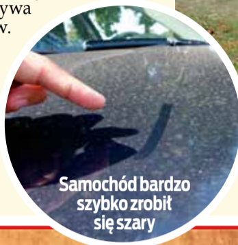
Samochód bardzo szybko zrobił się szary

Trzeba przyznać, że redakcja nie po raz pierwszy jest informowana o pracach porządkowych w których używa się dmuchaw. Na osiedlach - przede wszystkim w porach porannych - tego typu głośne roboty spotykają się na ogół z