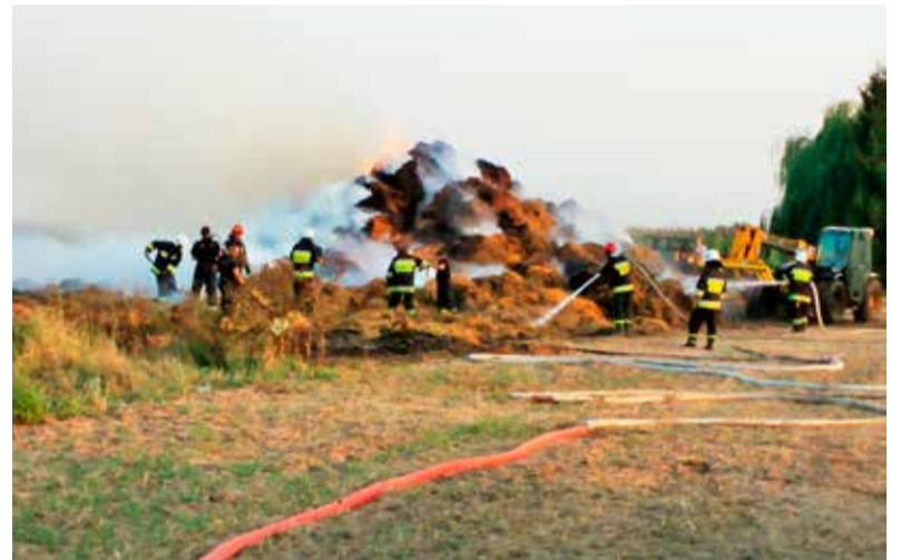
Na zdjęciu pożar sterty słomy w Goszczędzce