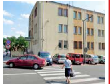
Budynek po starej komendzie policji, póki co, stoi pusty

Plany zmieniały się jak w kalejdoskopie. Z początku były policyjne pomieszczenia miały zostać przekształcone w lokale socjalne. Później władze miasta zaproponowały przeprowadzkę