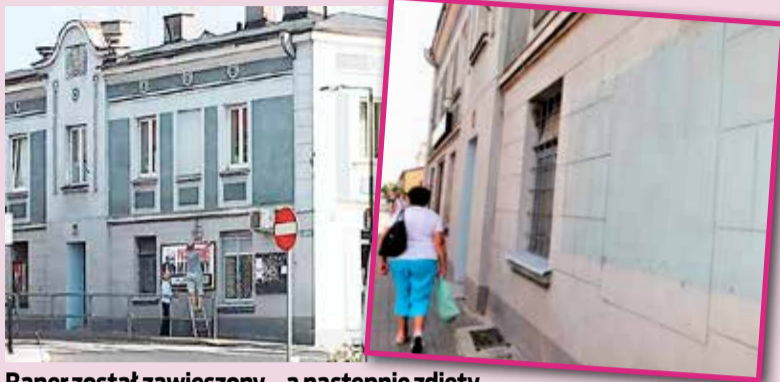
Baner został zawieszony... a następnie zdjęty

Nieoficjalnie dowiedzieliśmy się, że miejsce reklamowe na elewacji kamienicy przy ul. Łódzkiej zostało już dużo wcześniej wykupione przez jedną z warszawskich firm. Najpraw-