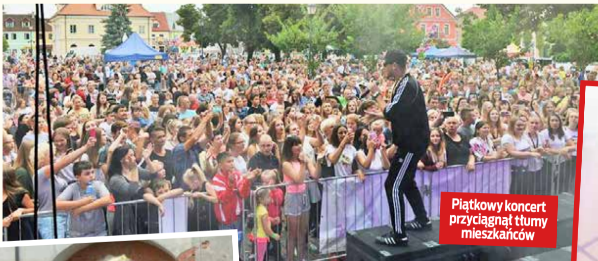
Piątkowy koncert przyciągnął tłumy mieszkańców