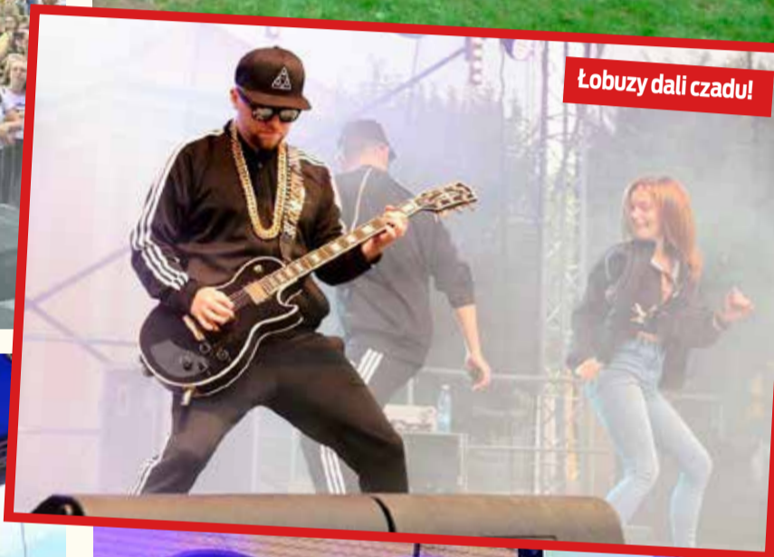
Łobuzy dali czadu!