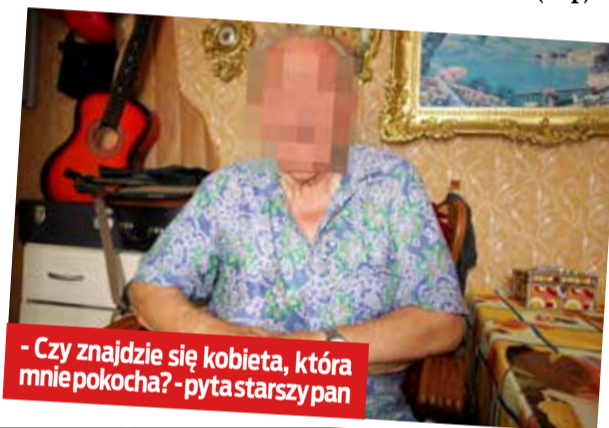
- Czy znajdzie się kobieta, która mnie pokocha? - pyta starszy pan