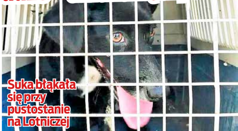
Suka błąkała się przy pustostanie na Lotniczej

Mieszkaniec ma sporo racji. Wielu mieszkańców sprząta po swoich psach a czworonogi rzeczywiście latem często są wypuszczane na całe dni. W Łęczycy opłata za psa była pobierana. Zniesiono ją na początku obecnej kadencji samorządu. Problemem było egzekwowanie uiszczania