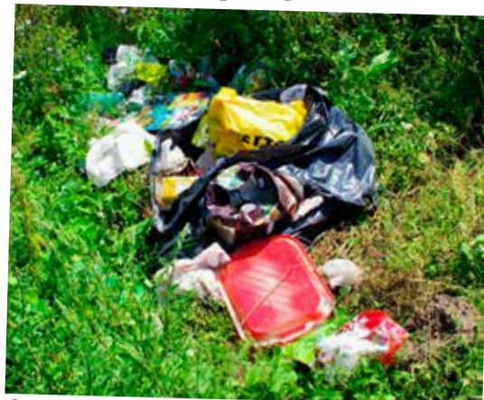
Śmieci zostały wyrzucone w krzaki tuż za ogrodzeniem ostatniej z działek

Sprawdziliśmy. Za ostatnią z działek, w krzakach rzeczywiście leży sporo śmieci i czarny duży worek. Powiadomiliśmy o sprawie szefową Zieleni