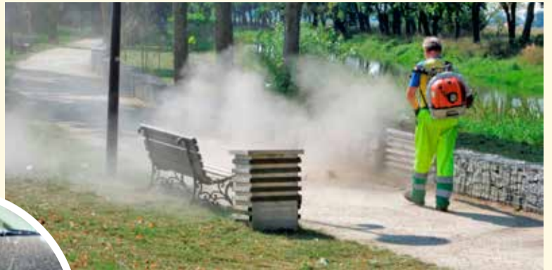
Pracownik sprzątał bulwar. W powietrze wzbijają się tumany kurzu

krytyką. Mieszkańcy z sentymentem wspominają czasy, gdy pracownicy mieli na wyposaże-