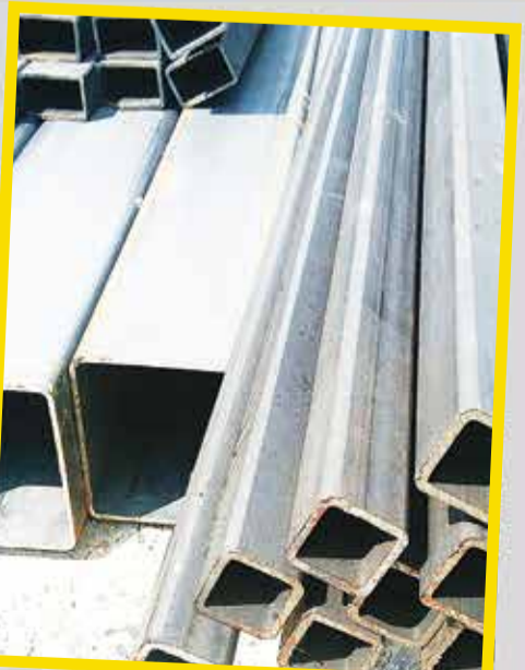
Stal zbrojeniowa i konstrukcyjna

Zapraszamy do skorzystania z naszej oferty. Zapewniamy uczciwość, lojalność i sprawdzony towar