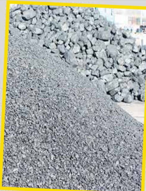
Węgiel, miat, ekogroszek