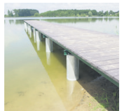
(stop) Nowe pomosty to najważniejsza w tym roku inwestycja nad zalewem

Ozorków Na ten moment czekali amatorzy spędzania wolnego czasu nad wodą. Kąpielisko miejskie rozpoczyna letni sezon 23 czerwca. Ceny za wypożyczenie kajaków i rowerów wodnych nie uległy zmianie. Nad bezpieczeństwem kąpiących się będą czuwać zawodowi ratownicy. Przy zalewie postawiono nowe kosze na śmieci a także ławki. Plaża została wzbogacona o czysty piasek. Wyremontowane zostały pomosty.