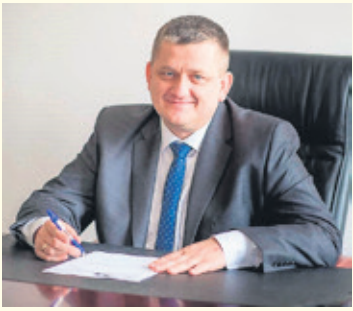
Burmistrz Piotr Sęczkowski zarobił prawie 159 tys. zł