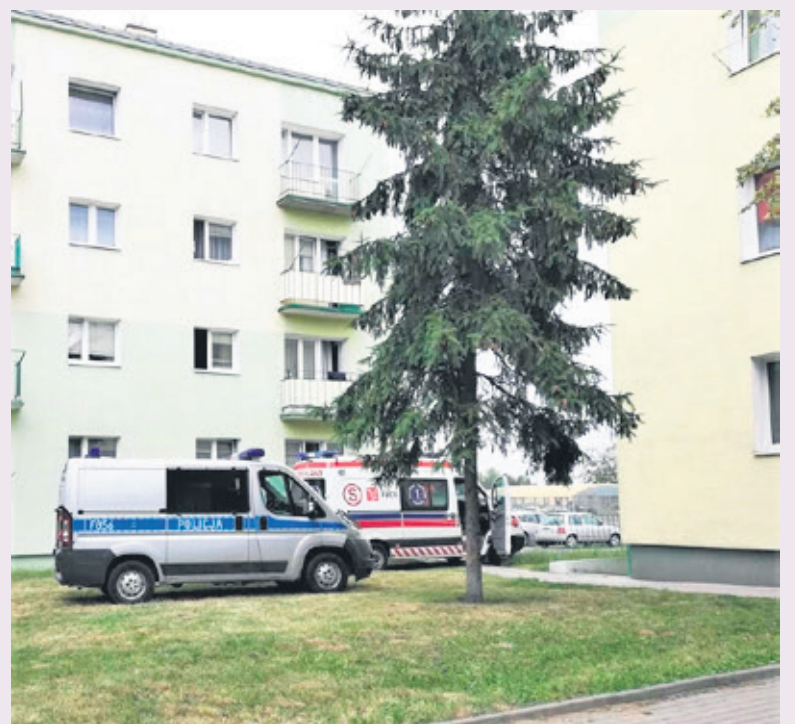
86-latka w piątek wypadła z balkonu na drugim piętrze

Kilka dni później, w piątek przed godziną 13, służby ratunkowe zostały powiadomione o kolejnym nieszczęściu. Z balkonu na drugim piętrze wypadła starsza kobieta. 86-latkę leżącą na trawniku zauważył przypadkowy przechodzień, który zawiadomił pogotowie. Policja bada okoliczności zdarzenia. 86-letnia kobieta została zabrana karetką na teren łęczyckiego szpitala, skąd śmigłowcem Lotniczego Pogotowia Ratunkowego przetransportowano