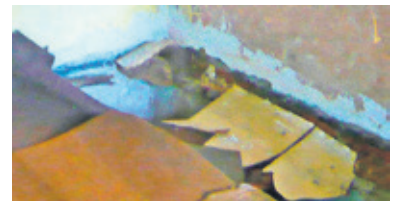
Podłoga pod segmentem zarwała się

PGKiM i Zieleni Miejskiej ocenili stan lokalu.