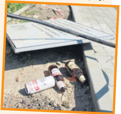
Puszki i butelki po piwie leżą przy znakach i tablicach drogowych