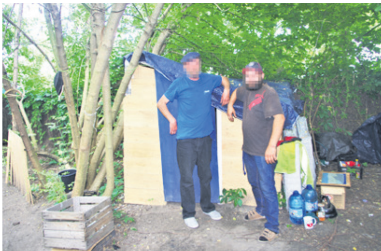
Mężczyźni mają osobne pomieszczenie do spania

starych mebli, które ludzie wyrzucają zbudowali sobie ściany, jeszcze zbieramy materiał na dach. Na ścianach mamy tapetę ze starego kalendarza. Jest naprawdę ładnie. Mamy nawet osobną sypialnię. PKP ostatnio robiło porządki na podwórku, przy budynku, ale nam odpuścili, nie kazali się wynosić. Wciąż jednak boimy się, że tak tu się fajnie robi, a ktoś nas usunie. Tego byśmy nie chcieli. Jesteśmy spokojni, całe dnie nas praktycznie nie ma. Lokatorzy z pobliskiego budynku się na nas nie skarżą, dają nam wodę, pozwalają ładować telefon - mówią mężczyźni. - Niczego nam nie brakuje.