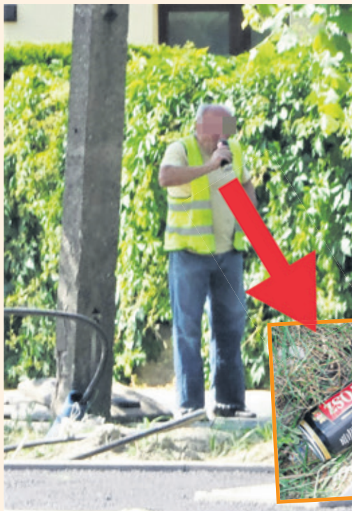
Robotnik co jakiś czas przerywał pracę na picie piwa. Puskę wyrzucił niedaleko miejsca, gdzie niezbyt sumiennie wykonywał swoje obowiązki