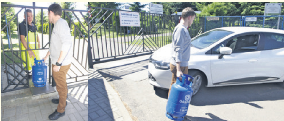
Kupując butlę w OPK masz pewność najwyższej jakości produktu

Ozorkowskie Przedsiębiorstwo Komunalne prowadzi sprzedaż butli z gazem propan-butan firmy Gaspol.