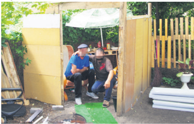
-Niczego nam nie brakuje - usłyszeliśmy