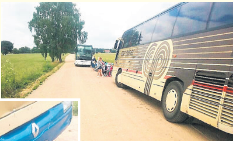
Autobus zjechał w głęboki rów. Na szczęście dzieciom nic się nie stało

Na odcinku drogi pomiędzy Mariampolem a Florentynowem autobus przewożący dzieci do