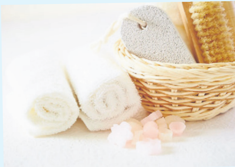
Jednym z najpopularniejszych akcesoriów do stóp jest pumeks, jednak może on przenosić drobnoustroje

Jeżeli jesteśmy przyzwyczajeni do usuwania martwego naskórka pumeksem, dbajmy o jego czystość i dezynfekujmy go regularnie. Podstawową zasadą używania pumeksu jest stosowanie go nie częściej niż raz w tygodniu. Inaczej usuwany naskórek będzie narastał i rogowaciał intensywniej, co zwiększy, a nie usunie problem.