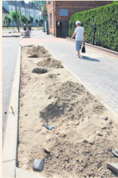
4 dołki pod drzewa kopane były ponad godzinę

Amator chmielowego, złocistego trunku po opróżnieniu puszkę wyrzucił ją niedaleko swojego miejsca pracy. Puszka wylądowała na trawniku, tuż przy chodniku.