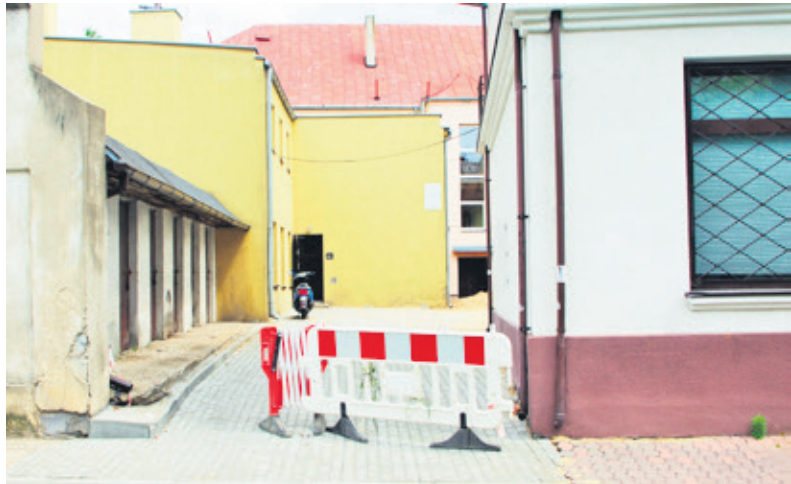
Pracownik źle się poczuł podczas prac przy ul. Kaliskiej 10, gdzie podwórko utwardzane jest kostką brukową