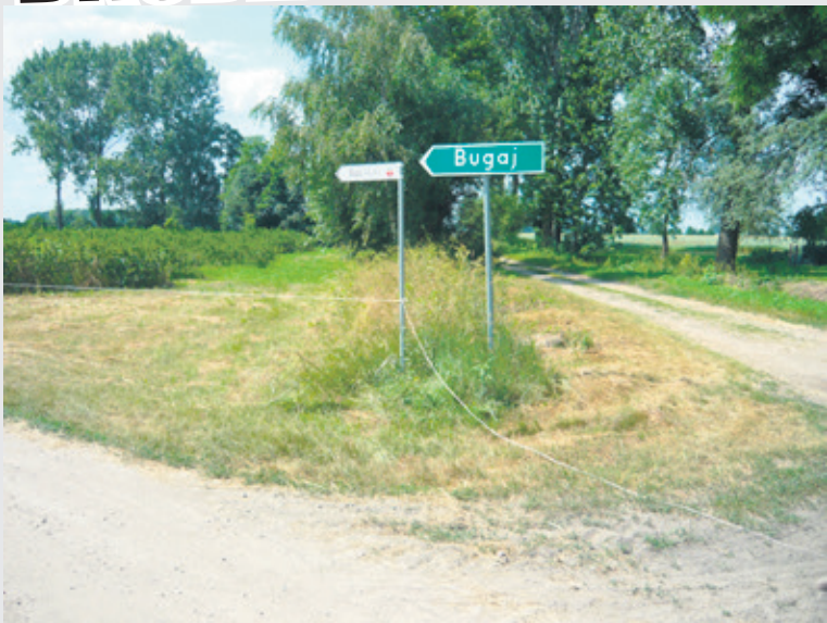
W Bugaju doszło do dramatu. W przydrożnym rowie znaleziono ciało mężczyzny

- Sąsiad miał około 60 lat i był pełen życia. Zналиśmy się. Z