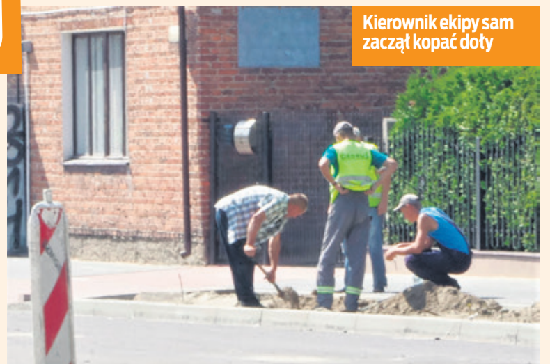
Kierownik ekipy sam zaczął kopać doły

bowiem cztery niezbyt głębokie doły kopane były przez ponad godzinę.