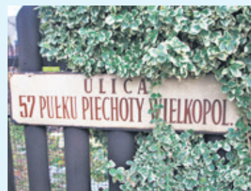
W ramach zadania zostanie wyremontowana m.in. ulica 57 Pułku Piechoty Wielkopolskiej. Mieszkańcy od lat czekali na tę inwestycję