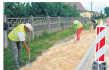
Pracownicy na ulicy Krośniewickiej

Mieszkańcy są zadowoleni z remontu, bez względu na to, czy czas