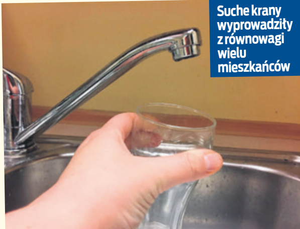
Suche kranie wyprowadziły z równowagi wielu mieszkańców

- To prawda, że nie było takiej informacji, ale to dlatego, że nie było planowane odcięcie wody. Przelączenie zasilania do nowej sieci miało odbywać się przy zasilaniu awaryjnym, które daje niższe ciśnienie wody, ale jej nie wyląca. Innymi słowy, podczas prac woda cały czas miała płynąć w kranach. Około 3 w nocy doszło do awarii starego rurociągu, na którym działało zasilanie awaryjne. Uszkodzeniu uległy dwie zasuwki. Nie było wyjścia i podjęliśmy decyzję o zamknięciu wody dla całego miasta. Naprawa miała potrwać do godziny 6