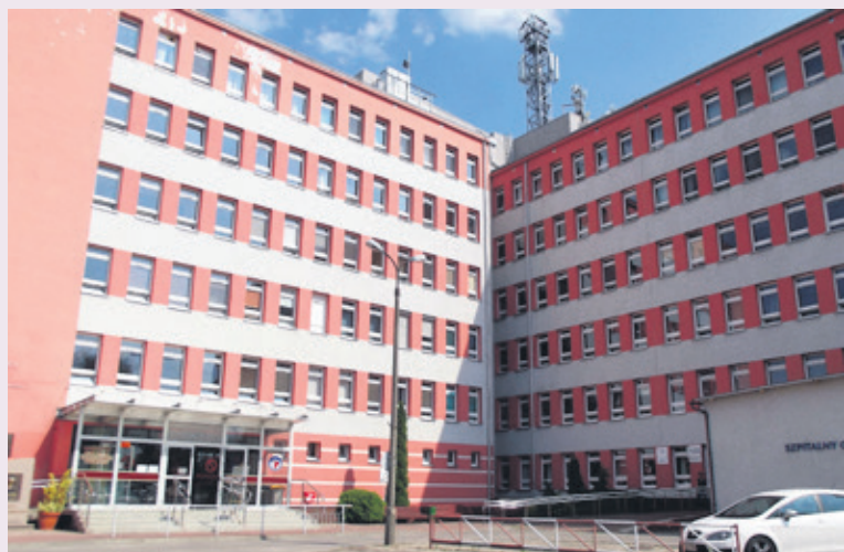
W sobotę 41-latka wyskoczyła ze szpitalnego okna

ją do łódzkiej placówki. Okoliczni mieszkańcy nie mogą uwierzyć, jak staruszka mogła wypaść z balkonu.