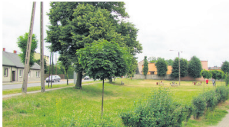
Strefa do aktywnego spędzania czasu powstanie na tym skwerze

Ozorków otrzymał dofinansowanie z Ministerstwa Sportu i Turystyki na budowę Otwartej Strefy Aktywności na skwerze u zbiegu ulic Sienkiewicza/Zgierska.