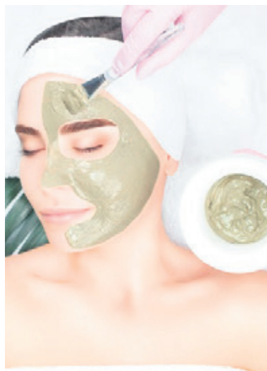
Maseczkę z zieloną gliną zostawiamy na ok. 10-15 minut pilnując w międzyczasie, aby nie wyschła na twarzy

Jeśli masz cerę wrażliwą, zamiast stosować czystą glinę zieloną, wymieszaj ją pół na pół z gliną białą i z takiej mieszanki zrób maseczkę. Zielona glina ma najsilniejsze