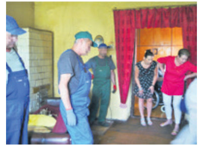
Pracownicy MOPS-u oraz fachowcy z PGKiM-u i ZM sprawdzili stan mieszkania