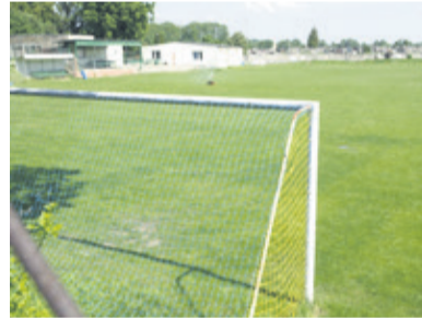
Na zdjęciu stare boisko piłkarskie w centrum Parzęczewa

Gmina stawia na aktywny wypoczynek. Przy ul. Parkowej powstanie nowoczesny kompleks boisk. Czy prawie dwóch milionów złotych nie można było przeznaczyć na inny cel? Władze podkreślają, że inwestycja jest w większości sfinansowana ze środków Unii.