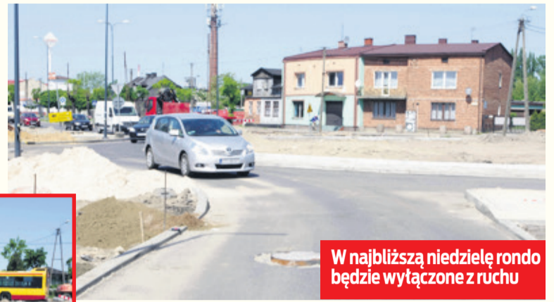
W najbliższą niedzielę rondo będzie wyłączone z ruchu

na ul. Zgierskiej, a następnie, po wykonanym postoju, zawróci i pojedzie w kierunku Łodzi.