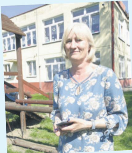
Dyrektor „piątki” chwali sobie nowy system