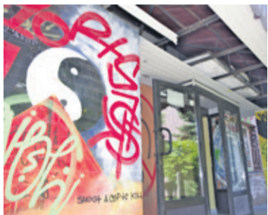
Bohomazów przybywa. Niedawno zniszczony został daszek

- Nikogo nie złapałem za rękę, ale musiałem przeprowadzić rozmowę z dyrektorką pobliskiej szkoły. Urząd pracy jest w budynku administrowanym przez ZSP. Coś trzeba z tym zrobić, aby w przyszłości nie dochodziło do takich sytuacji. Ta pomazana elewacja wygląda fatalnie, a to tego jeszcze doszło zniszczone zadaszanie - mówi szef PUP w Poddębicach. Problem bohomazów na ścianie