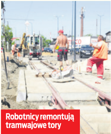
Robotnicy remontują tramwajowe tory

Ozorków Na 20 maja (niedziela) planowane jest wykonanie ostatniej, ścieralnej warstwy asfaltu na nowym rondzie