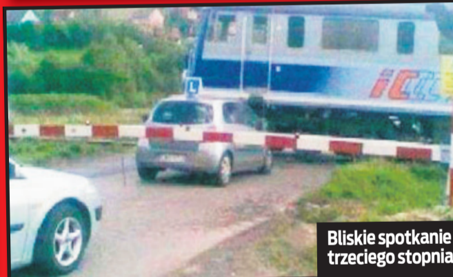
Bliskie spotkanie trzeciego stopnia

Tato, czy to prawda, że w niektórych krajach Afryki facet nie zna swojej żony do momentu, aż się z nią ożeni?