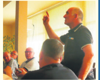
Podczas komisji dyskutowano o zaprezentowanej koncepcji

zbulwersowani zaproponowanym rozwiązaniem.