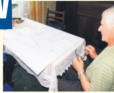
Projekt budowy drogi wywołał kontrowersje