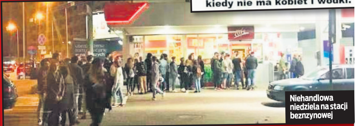
Niehandlowa niedziela na stacji bezczynowej