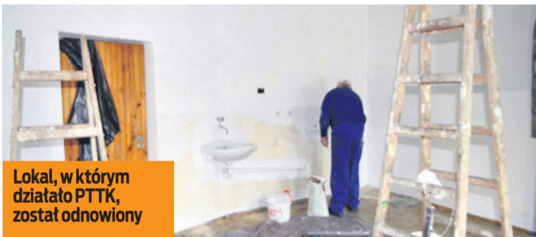
Lokal, w którym działało PTTK, został odnowiony

w związku z wynajmem lokalu dla posła, nie było żadnych preferencyjnych warunków.