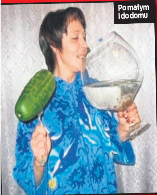
Po małym i do domu