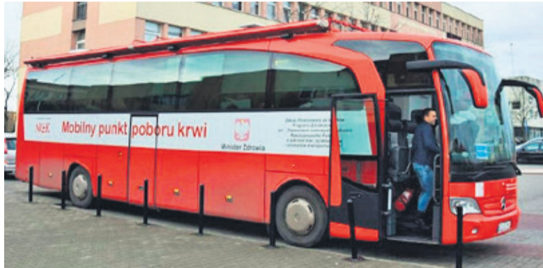
Krwiobus stanie przed KPP w Łęczycy 23 kwietnia

Pierwsza zbiórka będzie miała miejsce 23 kwietnia od