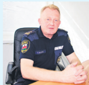
- Przyjęliśmy zgłoszenia od lokatorów - mówi szef straży miejskiej