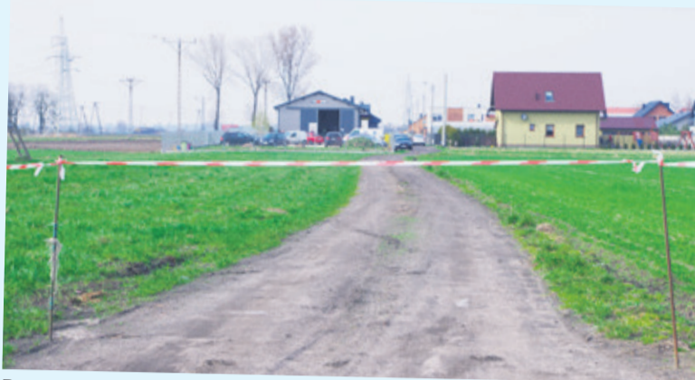
Droga gruntowa jest prywatną własnością radnej gminy Łęczycza. Bez jej zgody, przejazd nie jest możliwy

- Co z tego, że jestem radną i sołtyską, przecież jutro mogę nie być, zawsze można zrezygnować i co wtedy? Czy to, że pełnię takie funkcje oznacza, że mam