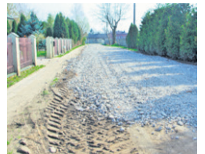
Na ulicy Jagiełty wysypywany jest betonowy gruz