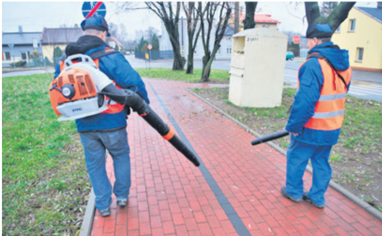
Wielu lokatorów narzeka na głośną pracę dmuchaw

rzy pracownicy rozpoczynają pracę z dmuchawami bardzo wcześnie rano.