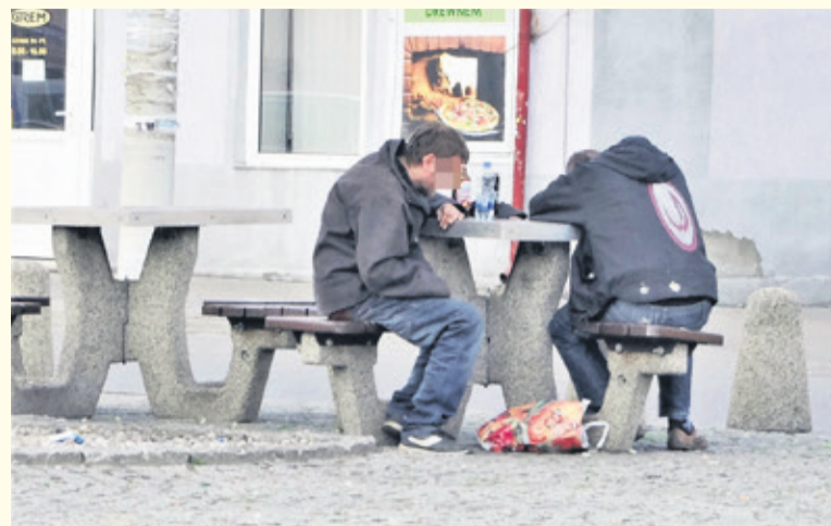
W samym centrum miasta, na placu Jana Pawła II, odbyła się libacja pod chmurką. Uczestnicy zamoczeni alkoholem tracili przytomność

- Mogę zapewnić, że w ramach naszych możliwości podejmujemy interwencje, tam gdzie są potrzeb-