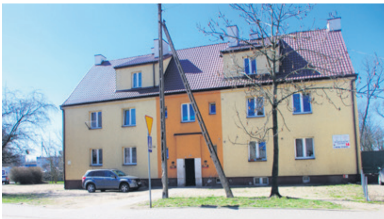
W tym roku utwardzony zostanie m.in. teren przy ul. Wojska Polskiego 16

(strona zachodnia), - Utwardzenie terenu przy ul. Wojska Polskiego 16, - Utwardzenie terenu na ul. M. Konopnickiej między blokami 8a, 8b, 8c, - Utwardzenie terenu na ul. Belwederskiej 9 i 11 oraz wykonanie chodnika do śmietnika, - Utwardzenie ul. Osiedlowej (odcinek wschodni), - Remont ul. Krótkiej, - Chodnik przy ulicy Wrzosowej. Warto zaznaczyć, że przesunięte przez radnych miejskich środki, czyli dodatkowe 135 tys. zł na remonty ulic i chodników,