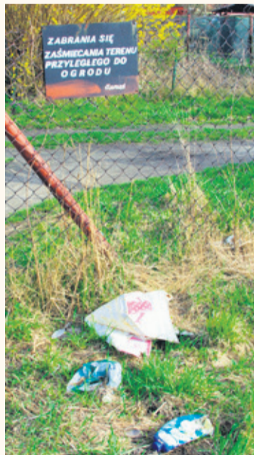
Przy wejściu do ogrodu jest informacja, że zabrania się zaśmiecania terenu przyległego do ogrodu. Zakaz nie jest przestrzegany