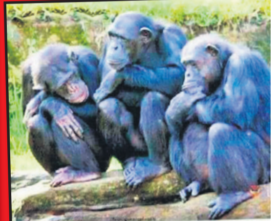
Tak wygląda spotkanie facetów kiedy nie ma kobiet i wódki.

A z tego co ja widzę, nie jesteś też ostatnim