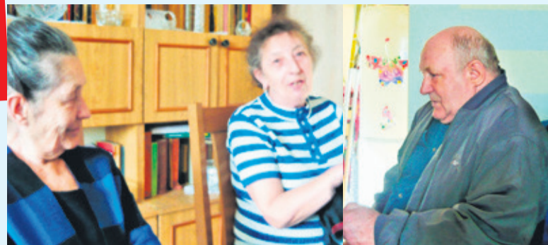
Mieszkańcy kamienicy często rozmawiają o 58-latku

- Po zgłoszeniu od lokatorów, że jeden z mieszkańców zakłóca im spokój, udaliśmy się na miejsce. Rozmawiałem z mężczyzną, próbując go przekonać, że jego zachowanie jest co najmniej nieodpowiednie. 58-latek został pouczony, a z pozostałymi lokatorami rozmawialiśmy, jak mają się zachować w sytuacji zagrożenia. Niestety, perswazja słowna na niewiele się zdała, bo już na drugi dzień lokator o mało nie podpałił kamienicy - usłyszeliśmy od Tomasza Olczyka , komendanta straży miejskiej. - Tego samego dnia, kiedy doszło do incydentu z ogniskiem w mieszkaniu, 58-latek został zabrany