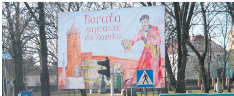
Baner z Borutą został zdjęty, niedługo zawiśnie nowy