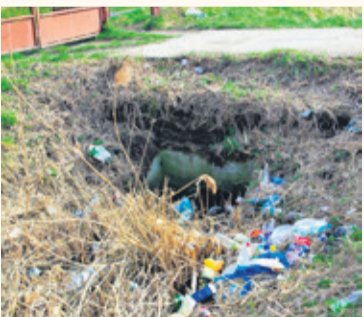
Rów z obu stron pełen jest śmieci, głównie butelek

- Problem ze śmieciami w naszym ogrodzie jest dość duży.