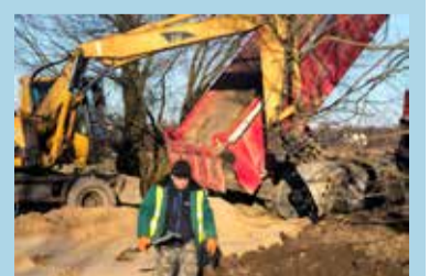
po wyroku, może decydować o części działki przez którą puszczony został trakt. Właściciele pobliskiego domu musieli się ogrodzić.

Warto wspomnieć, że inwestycja ruszyła z kopyta po tym, jak gmina wygrała sprawę z przedsiębiorcami do których należy stary młyn. Batalia dotyczyła terenów wokół młyna. Gmina,