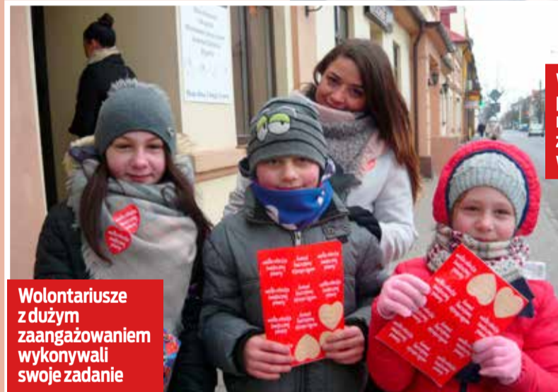
Wolontariusze z dużym zaangażowaniem wykonywali swoje zadanie