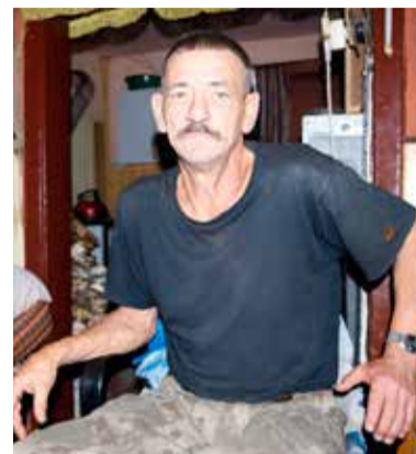
G. Brudziński krytykuje ośrodek pomocy społecznej

„Miejski Ośrodek Pomocy Społecznej w Ozorkowie informuje, że każda osoba znajdującą się w trudnej