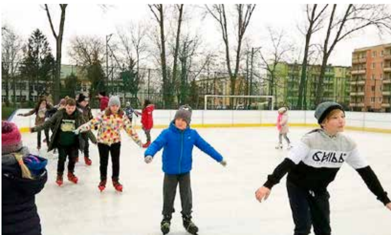
Amatorów ślizgawki nie brakowało