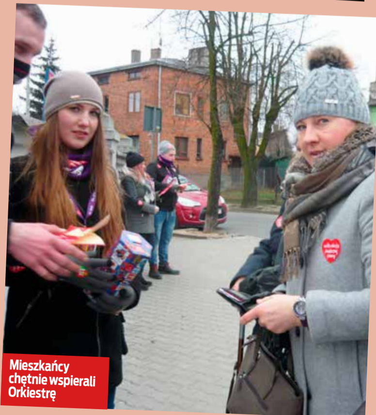
Mieszkańcy chętnie wspierali Orkiestrę