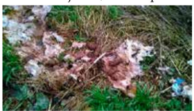
Fekalia wylane były tuż przy drodze

Zieleń miejska miała sporo pracy, żeby posprzątać po mieszkańcach, którzy za nic sobie mają kulturę. Wyrzucanie śmieci gdzie popadnie to okropny i trudny do zrozumienia nawyk, tym bardziej, że kontener przy ul. Kopalnianej wcale mały nie jest. Jeszcze trudniej zrozumieć, dlaczego na trawę wylane były fekalia w dość dużej ilości, skoro w pobliżu