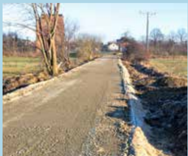
Droga zostanie wyłożona tłuczniem

na budowie i modernizacji sieci wodno-kanalizacyjnej w gminie, wartej 11 mln zł i mającej się zakończyć do końca września br., poddębicki samorząd odtwarza nawierzchnie drogowe.