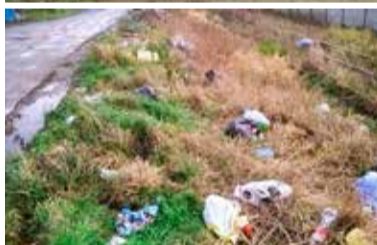
Sterty śmieci zalegały przy kontenerze na śmieci i przy torach wąskotorówki

większych opadach deszczu zbiera się tam woda, utrzymująca się nawet do kilku dni. (zz)