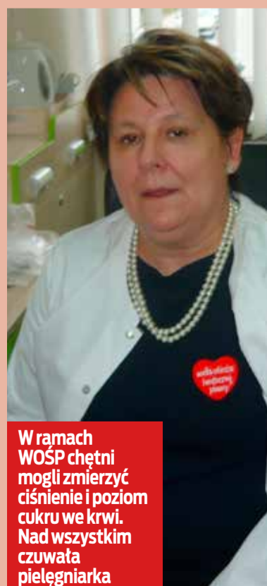
W ramach WOŚP chętni mogli zmierzyć ciśnienie i poziom cukru we krwi. Nad wszystkim czuwała pielęgniarka