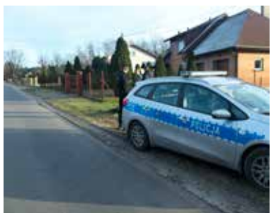
Policjanci otrzymali telefoniczne zgłoszenie o maltretowanym psie

6. Szczegółowych informacji o sprzedawanych nieruchomościach i warunkach przetargu można uzyskać w Referacie Ochrony Środowiska, Rolnictwa i Gospodarki Gruntami pok. 7, tel. 42 277 14 46 wew. 115, w kwestii zagospodarowania przestrzennego pok.3 wew. 113.