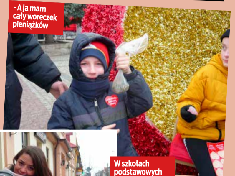
- A ja mam cały woreczek pieniążków