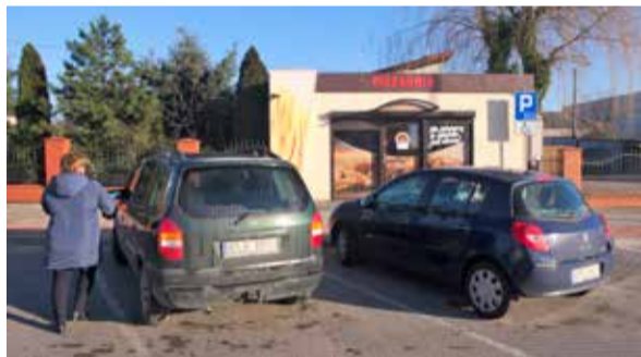
Klienci piekarni skarżą się na to, że jadąc po pieczywo muszą łamać przepisy