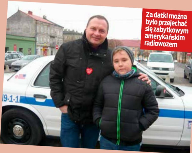
Za datki można było przejechać się zabytkowym amerykańskim radiowozem