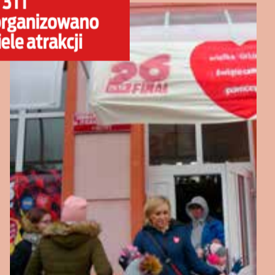
W szkołach podstawowych nr 3 i 1 zorganizowano wiele atrakcji