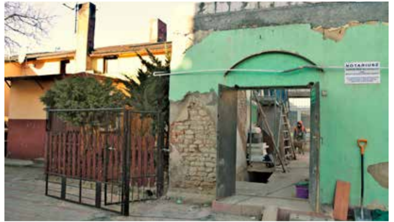
Remontowany bank i budynek mieszkalny mają wspólną ścianę

Poddębice - Siedzimy tu jak na szpilkach – usłyszał nasz reporter od starszej lokatorki budynku bezpośrednio przylegającego do remontowanego właśnie banku spółdzielczego. Piętro banku zostało już wyburzone a jedna ze ścian jest wspólna dla obydwu nieruchomości.