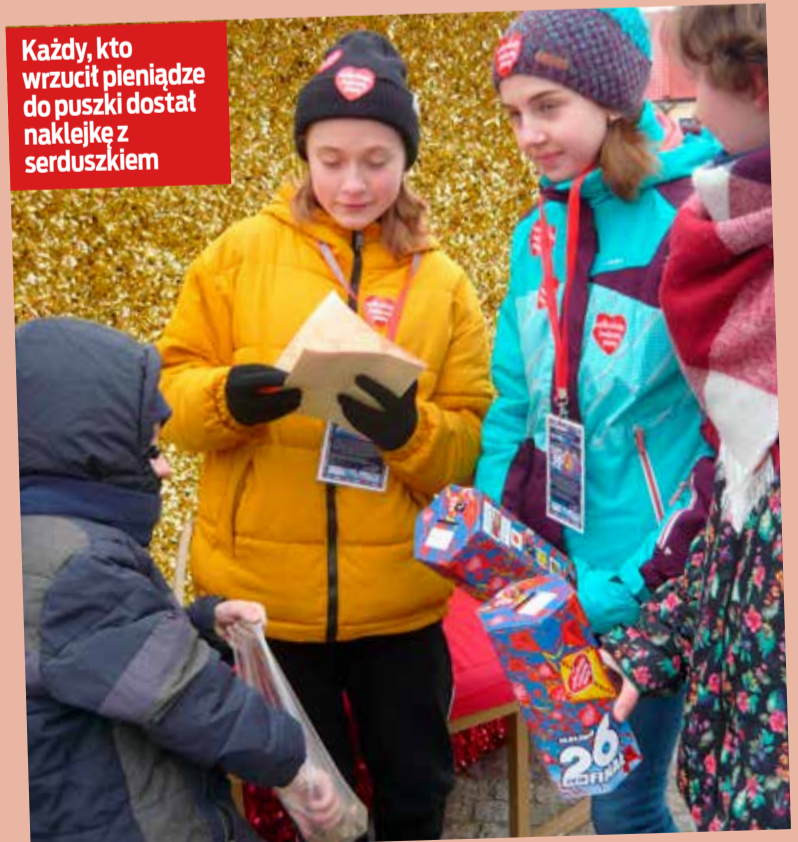
Każdy, kto wrzucił pieniądze do puszek dostał naklejkę z serduszkami