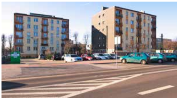
Zmotoryzowani lokatorzy bloków również narzekają na poziome oznakowanie drogi