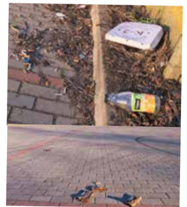
Na placu jest pełno śmieci, wciąż leżą nawet pozostałości po petardach. Miasto twierdzi jednak, że rynek jest wysprzątnięty