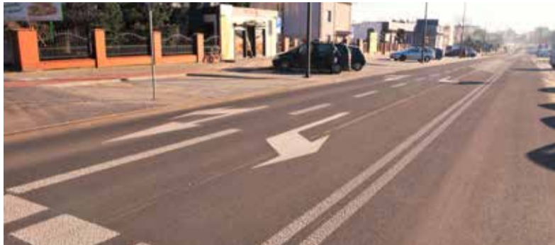
Wymalowana podwójna linia ciągła zdaniem kierowców powinna zostać usunięta

- Jadąc do pracy w Łodzi wykręcam od razu w lewo w stronę ronda i przejeżdżam przez wymalowane na jezdni linie. Przecież nie będę nadrabiał drogi i jechał Zieloną w stronę Targowej, aby później zawrócić. To bez sensu. Powinni szybko zlikwidować podwójną ciągłą – uważa jeden z lokatorów.