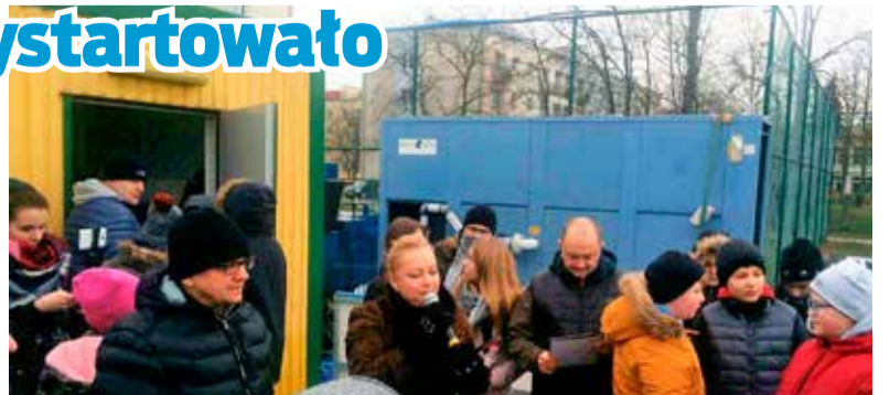
W sobotę oficjalnie wystartowało lodowisko na orliku przy SP3

wyższe o złotówkę. Obok lodowiska działa wypożyczalnia łyżew. Koszt wypożyczenia wynosi