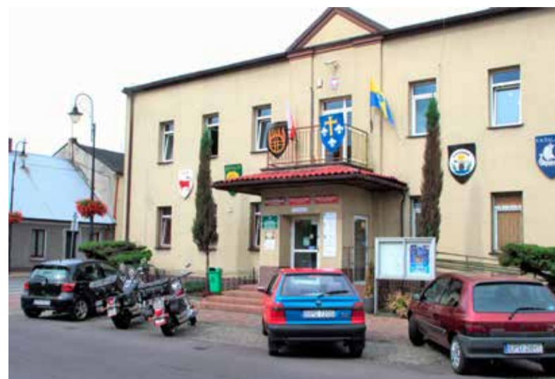
W magistracie z satysfakcją przyjęto decyzję powiatu