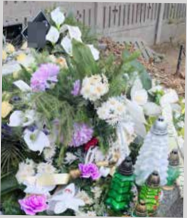
Na grobie jest dużo kwiatów

- To był dobry chłopak – słyszymy od jednego z przyjaciół denata. - Trzymał się jakoś do śmierci swo-