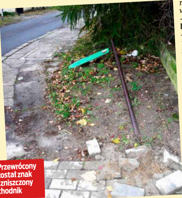
Przewrócony został znak i zniszczony chodnik

gmachem sądu i prokuratury. Mieszkańcy są zaskoczeni takim widokiem i dziwią się, że odpowiednie służby nie robią nic, aby ukrócić pijaństwo i dewastację.