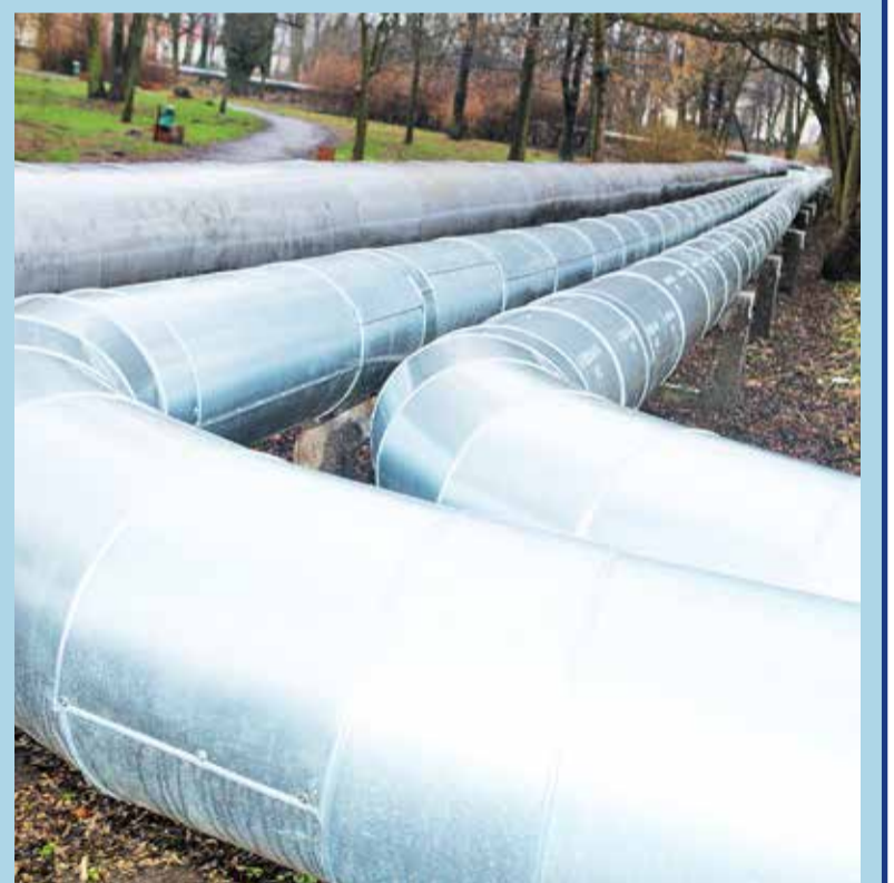
Wymieniona została izolacja napowietrznej magistrali ciepłowniczej

Oprócz działań związanych z modernizacją sieci i przyłączy OPK zainwestuje w roku 2018 w modernizację dziewięciu węzłów ciepłych w tym sześciu w zakresie c.w.u. (likwidacja węzłów grupowych: Mielczarskiego 8, 12; Staszica 3/5; Tkacka 6; Rataja 1; Piłsudskiego 8, dwóch w zakresie c.o. i c.w.u. (węzły kompaktowe: Małachowskiego 2, Piłsudskiego 2), oraz węzeł w zakresie c.o. (likwidacja węzła grupowego: Sucharskiego 12).