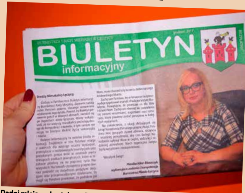
Radni miejscy skrytykowali biuletyn

Biuletyn tylko w nazwie jest wydawnictwem rady miejskiej. W jego zawartości nie ma słowa o tym organie. Jest za to dużo fotografii