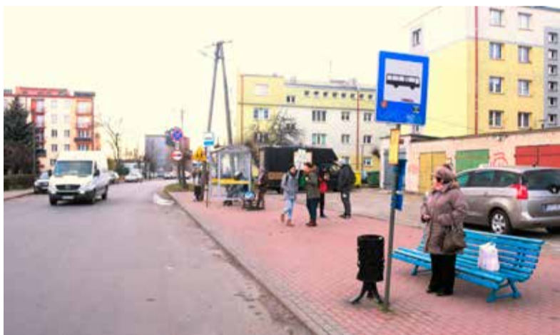
Przystanki przy ul. Przejazd będą niedługo zlikwidowane

Poddębice Ta sprawa budzi duże emocje wśród pasażerów. Jeszcze tylko do końca tego miesiąca działać będą przystanki autobusowe przy ul. Przejazd. Później przeniesione zostaną na ul. Zieloną, przy ul. Targowej. O problemie pisaliśmy niedawno w Reporterze.