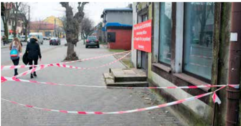
Nieruchomość została ogrodzona taśmą