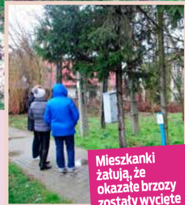
Mieszkanek żałują, że okazałe brzozy zostały wycięte

„Na podstawie oględzin oszacowano, iż przedmiotowe drzewa górują koronami nad otoczeniem