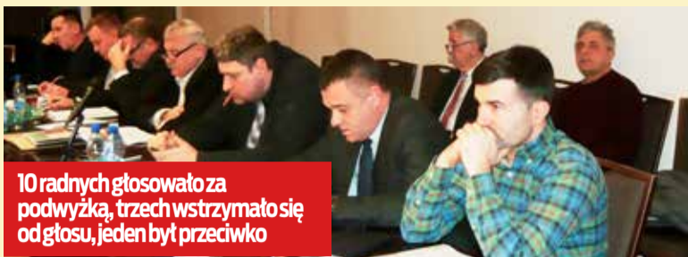
10 radnych głosowało za podwyżką, trzech wstrzymało się od głosu, jeden był przeciwko

- Dzień wcześniej było posiedzenie komisji wspólnych rady miasta i też dyskutowaliśmy na ten temat. Podczas głosowania nikt z radnych nie był „za”, po prostu wstrzymali się od głosu. Tym bardziej szokujący był dla mnie wynik głosowania na sesji. W mojej ocenie ta podwyżka, to niemoralna propozycja i radni nie powinni jej poprzeć. Dla przykładu,