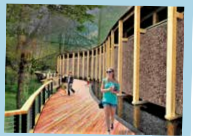
Wizualizacja tężni z pasażem spacerowym

Wśród projektów, które otrzymały dofinansowanie w ramach konkursu "Rozwój gospodarki turystycznej" są inwestycje związane z rozbudową basenów termalnych, budową parku tematycznego Farma Alka oraz tężni solankowej.