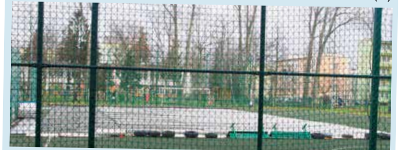
Lodowisko miało powstać 20 grudnia na orliku przy SP3