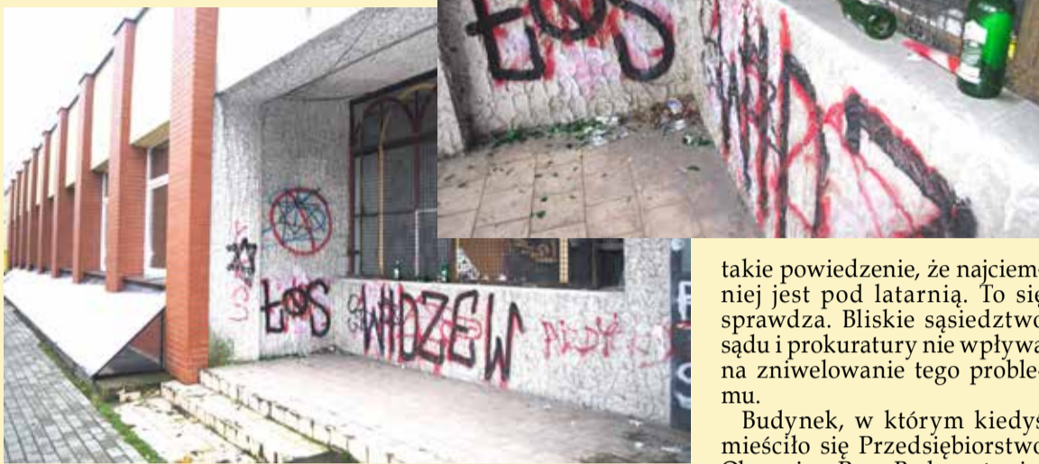
Blisko sądu i prokuratury urządzone są pijackie libacje

Poddębice Butelki po alkoholu, potłuczone szkło, niedopałki papierosów i śmieci walają się przy wejściu do nieczynnego już zakładu obuwniczego bezpośrednio sąsiadującego z