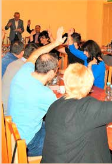
Część radnych chce, aby obrady były transmitowane

na promocję, miasto nie będzie mogło zapewnić godnej oprawy tych obchodów. Będziemy także musieli ograniczyć wsparcie finansowe imprez i wydarzeń, organizowanych przez działające w Ozorkowie stowarzyszenia, kluby, placówki i instytucje, jak np. Księżycowy cross, organizowany przez Monar, Piknik Integracyjny i Konkurs Szopek Bożonarodzeniowych, organizowane przez PSLCnP, Supermaraton, organizowany przez MDK, Festiwal Dialogi i Ozodance organizowane przez MOK, by wymienić tylko kilka. Środki z promocji były przeznaczane też np. na zakup nagród, medali, pucharów itp. dla dzieci i młodzieży uczestniczących w różnego rodzaju konkursach, turniejach itp. organizowanych przez placówki oświatowe i organizacje pozarządowe. W związku ze zmniejszeniem kwoty na działania promocyjne, będziemy musieli