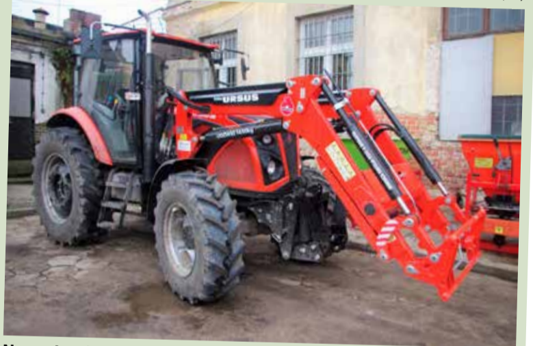
Nowy ciągnik trafił do „Zieleni” tuż przed świętami