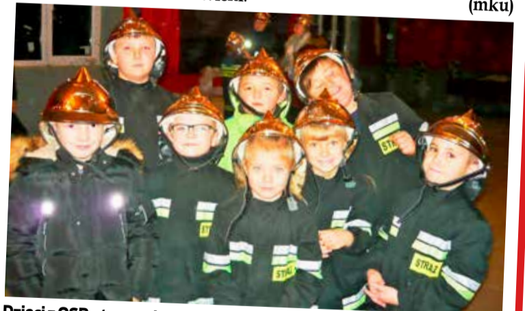
Dzieci z OSP otrzymały nowe hełmy strażackie