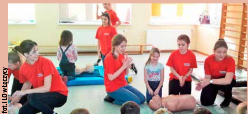
fol. ILO w Łęczycy

wzwać pomoc, pod jaki numer telefonu należy zadzwonić w sytuacji zagrożenia i jakie informacje są najważniejsze podczas zgłoszenia. Pokazywaliśmy również na czym polega resuscytacja krążeniowo-oddechowa. Dzieci starsze poznały dodatkowo