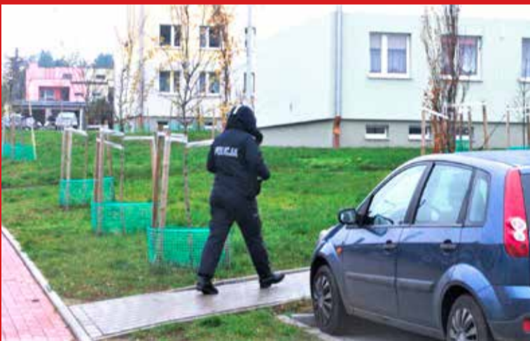
Policjantka podejmuje interwencję ws. donosu na panią Kazimierę. Sprawa może zakończyć się umorzeniem. Możliwe jest również nałożenie grzywny