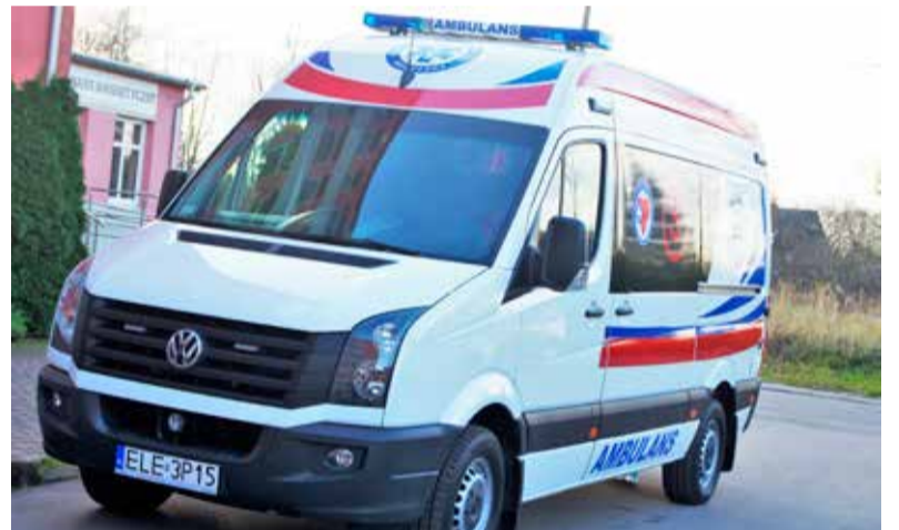
W piątek karetka wróciła na teren ZOZ w Łęczycy