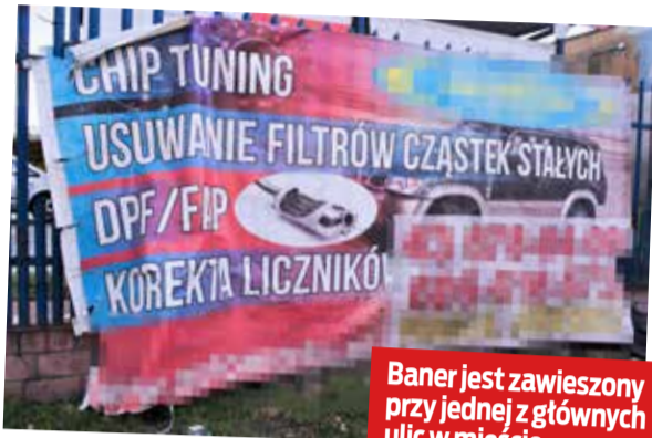
Baner jest zawieszony przy jednej z głównych ulic w mieście

Ministerstwo Sprawiedliwości przygotowało projekt ustawy, który pozwoli karać za cofanie liczników w