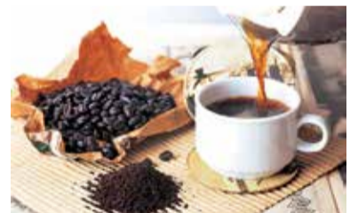
Kofeina stosowana na skórę głowy stymuluje porost włosów i zapobiega ich wypadaniu

Aby sprawdzić działanie kofeiny na skórę głowy i włosy przygotuj kawową płukanekę. Jedną łyżkę kawy zalej szklanką wrzątku. Po 10 minutach odcedź fusi, a następnie do powstałego płynu dodaj pół litra wody. Dobrze wystudzonym płynem wypłucz powoli głowę po umyciu i odżywcze, dokładnie wcierając go we włosy oraz skórę.