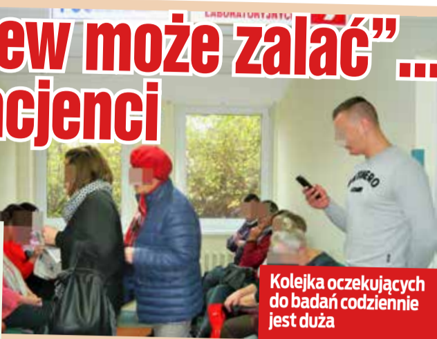
Kolejka oczekujących do badań codziennie jest duża