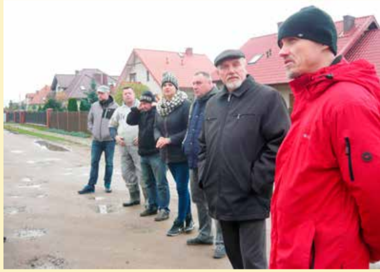
Mieszkańcy spotkali się z przedstawicielem PKP

- Miasto jak do tej pory nie zrobiło praktycznie nic, ciągle słyszymy obietniczki, szczególnie przed