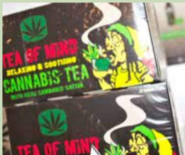
Oryginalna herbata z konopii z rastafarianinem