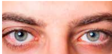
Masz zmęczone oczy? Nie lekceważ powtarzających się objawów

Pracując w biurze, trzeba zwracać uwagę na jakość monitorów, stosowanie filtrów polaryzacyjnych oraz ustawienie komputerów tak, aby zredukować odbicia od źródeł światła. Dobrze, gdy okno nie jest ani przed, ani za ekranem monitora. W pomieszczeniach okna powinny być zaopatrzone w zasłony lub pionowe żaluzje. Trzeba także często wietrzyć pomieszczenia, otaczać się roślinami, robić przerwy w pracy wzrokowej. Zaleca się przerwy