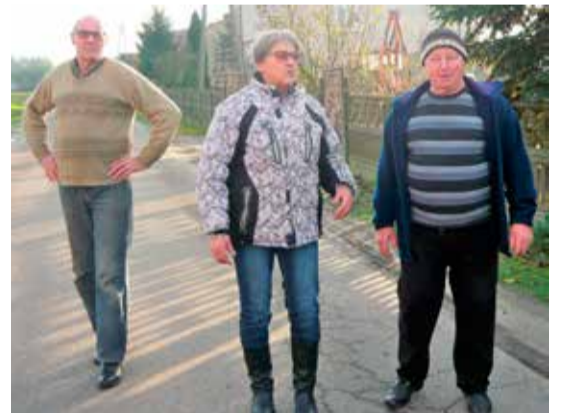
Mieszkańcy skarżą się na brak remontu drogi

kacyjnego korzystają mieszkańcy naszej gminy, więc chcemy w połowie brać udział w kosztach budowy. Trzeba było wyjaśnić sprawę administracyjnie, bo ten odcinek drogi był w krajowym zarządzie dróg. Na dziś wójt gminy Ozorków już wyjaśnił problem i po uzgodnieniach postanowiliśmy, że w budżecie na przyszły rok obie gminy wiejskie: Łęczycza i