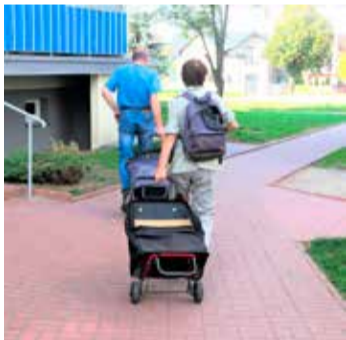
Niektórzy lokatorzy wyczekują roznosicieli ulotek

- Zazwyczaj mają w ręku reklamową gazetkę - mówi jeden ze sprzedawców. - Kierują się od razu po dany produkt w promocji. Nie są zainteresowani