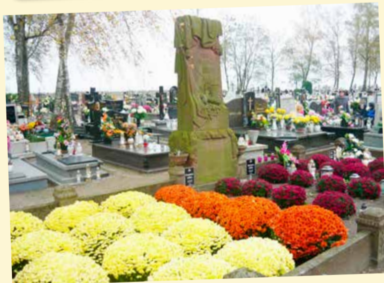
Pamiętamy o zmarłych bliskich