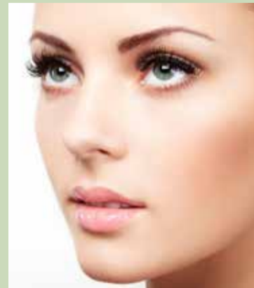
Trwała na rzęsy najlepszy efekt daje na długich i prostych rzęsach

Trwała na rzęsy to zabieg kosmetyczny, który powoli wyrasta na dużą konkurencję dla zalotki, również służącej podkreśleniu rzęs. Na czym konkretnie polega trwała na rzęsy?