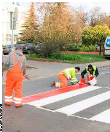
fol. UM Ozorków

Ozorków Przebudowano przejście dla pieszych na ul. Lotniczej, na wysokości wejścia do pływalni "Wodnik". Na jezdni pomalowano biało-czerwone pasy, natomiast na chodniku przy pasach, z jednej i z drugiej strony ulicy, ustawiono podświetlane znaki drogowe. Poza pomalowaniem pasów i ustawieniem znaków, zamontowano system czujników ruchu pieszych, znajdujących się w obrębie przejścia. Koszt przebudowy przejścia to 30 tys. zł, z czego 25 tys. miasto pozyskało jako dofinansowanie z Ministerstwa Spraw Wewnętrznych w ramach Programu Ograniczania Przystępności i Aspołecznych Zachowań "Razem Bezpieczniej".