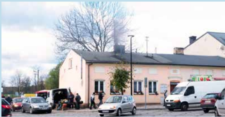
Należy pamiętać o przeglądach przewodów kominowych i wentylacyjnych

Jest gazem - nie posiada smaku, zapachu, barwy, nie szczybie w oczy i nie "dusi w gardle", wiąże się z hemoglobina tworząc tzw. karboksyhemoglobinę i uniemożliwia przenoszenie tlenu przez co powoduje niedotlenienie organizmu. Ma też charakter wybuchowy, w powietrzu pali się niebieskawym płomieniem. Jest nieco cięższy od powietrza (gęstość 0,967),