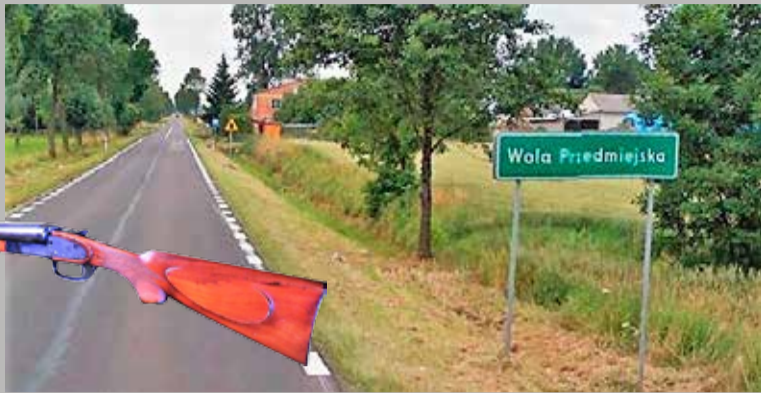
Samochód, w którym było ciało martwego 14-latka, zaparkowany był przy tej drodze

- Śledztwo prowadzone jest wielotorowo. Musi odnosić się zarówno do wersji samobójczego pozbawienia życia, jak również do narażenia na bezpośrednie niebezpieczeństwo utraty życia i nieumyślnego spowodowania śmierci - mówi prok. Jolanta Szkilnik , rzecznik prokuratury okręgowej w Sieradzu.