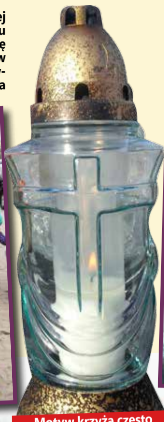
Motyw krzyża często pojawia się na zniczach