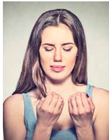
Paznokcie mogą się stać łamliwe m. in. wtedy, gdy przeżywasz duży stres

Jak w przypadku każdego zabiegu kosmetycznego, jego cena zależy od miejsca wykonania (miasta, renomę salonu, w którym ma być wykonywany), jednak zazwyczaj mieści się ona w przedziale od 50 do 80 zł. Często wykonywana jest razem z henną i wtedy jej koszt wzrasta nawet do 100 zł.