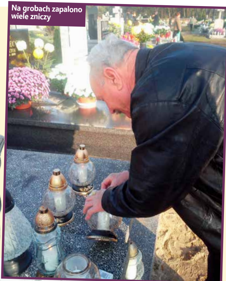
Na grobach zapalono wiele zniczy