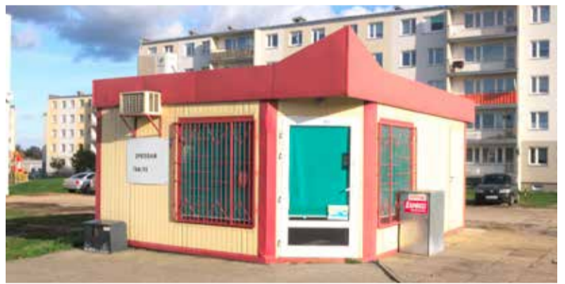
Sklep ogólnospożywczy działał przez wiele lat

- Nasz sklepik ogólnospożywczy prowadziliśmy z mężem od prawie