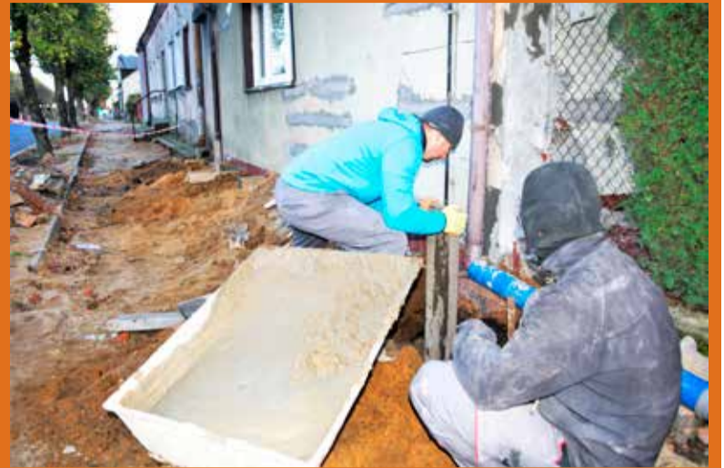
Pracownicy ze Zgierza remontują uszkodzony dom

Lokalna władza uspokaja. „Powiatowy Inspektor Nadzoru Budowlanego w obecności