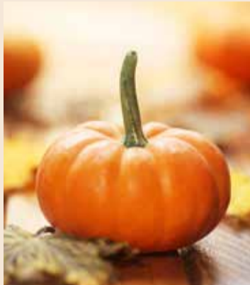
Maseczka z dyni poprawia odcień cery i wyrównuje jej koloryt. Maseczka dyniowa jest szczególnie polecana dla osób z bladą, zszarzałą cerą

Garść łuskanych (niesolonych) pestek dyni dokładnie rozgnieć w moździerzu lub zblenduj malakserem. Do pestek dodaj jogurt naturalny gęsty - najlepiej jedną małą łyżeczkę. Maseczka musi być gęsta, więc na początku dodaj niewielką ilość jogurtu i dołóż w razie potrzeby. Tak przygotowaną mieszankę nałóż na całą twarz lub jedynie w rejonach, które dotknięte są zmianami trądzikowymi. Maseczkę trzymaj przez 15-20 minut i zmyj letnią wodą.