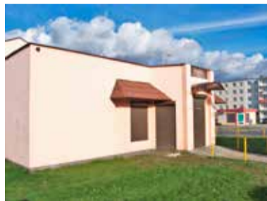
Przy Mielczarskiego został też zlikwidowany monopolowy