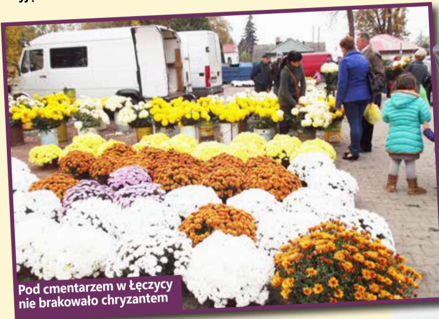
Pod cmentarzem w Łęczycy nie brakowało chryzantem

„Żyjemy po to, aby umrzeć, umieramy po to, aby żyć”, powiedział w swojej homilii proboszcz parafii Siedlec podczas mszy odprawionej na cmentarzu 1 listopada. Zaduma, wspomnienia o bliskich zmarłych oraz zastanawianie się nad istotą życia i przemijania towarzyszyły mieszkańcom całego regionu w dzień Wszystkich Świętych. Pomniki na cmentarzach pełne były różnobarwnych kwiatów i zapalonych lampek. Tego dnia na nekropoliach panowała wyjątkowa atmosfera.