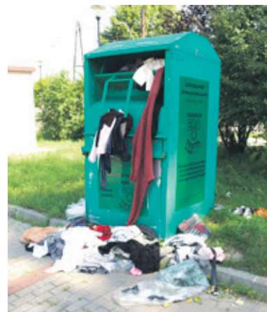
Tak wyglądał w ub. tygodniu pojemnik ustawiony w pobliżu ośrodka kultury