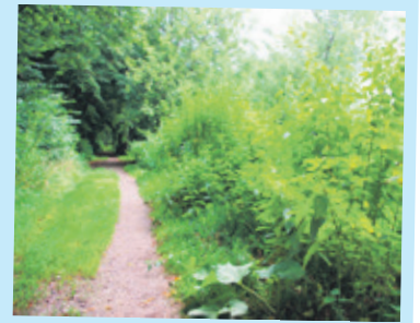
Pokrzywy sięgają ponad dwóch metrów wysokości