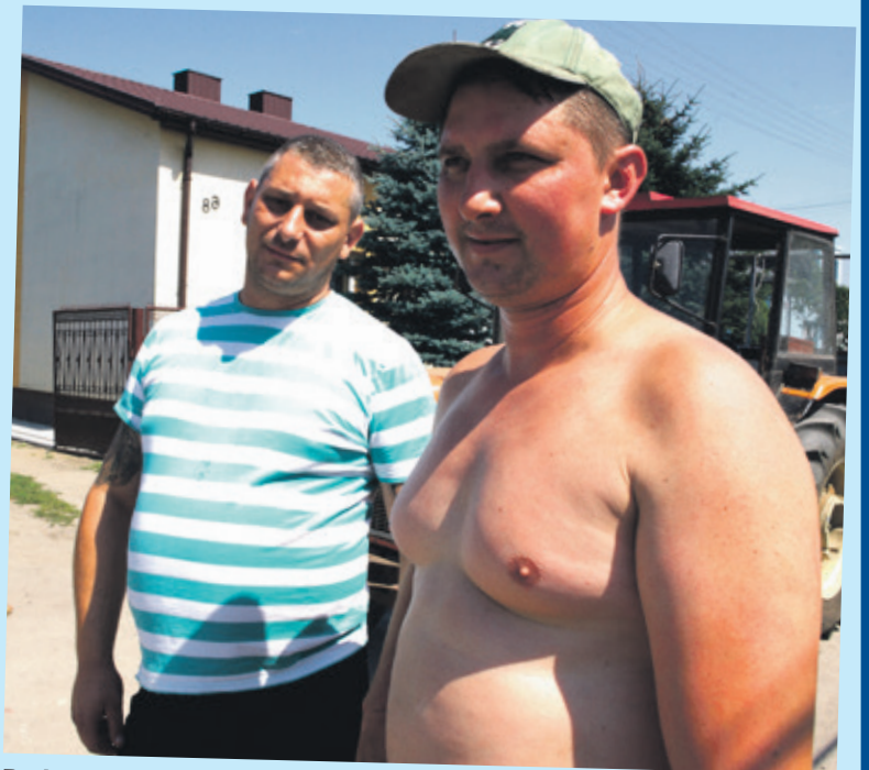
Podczas upałów mieszkańcy narzekają na wszechobecny piasek