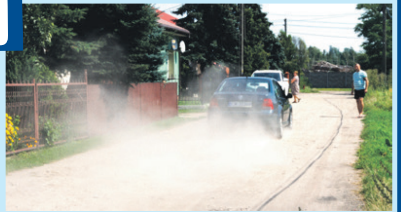
Przejeżdżające auta pozostawiają tumany kurzu

Podobnych krytycznych uwag jest na Krzeszewskiej więcej. Wizyta naszego reportera spowodowała, że ludzie emocjonalnie wypowiadali się o braku