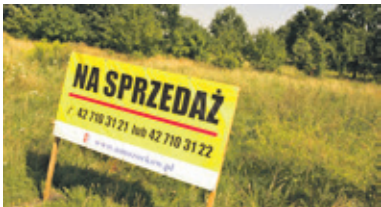
Miasto sprzedaje działki pomiędzy Piłsudskiego a Unii

O działkach wystawionych przez miasto na sprzedaż informuje duża tablica. Bliżej ul. Unii Europejskiej pracują koparki. Robotnicy dokonują