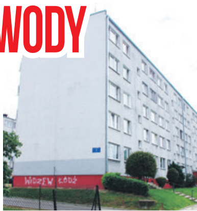
Lokatorzy kilku bloków będą musieli radzić sobie bez ciepłej wody

- To nie jest normalne, żeby w środku lata, przy takich upałach nie było ciepłej wody. Przynic