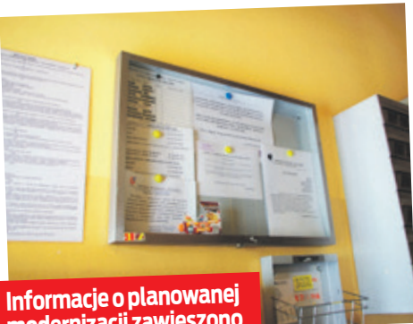
Informacje o planowanej modernizacji zawieszono w gablotach

„Od 9.08 do 31.08 PEC Łęczycza wykonał będzie poprzez firmę Elektrotermex modernizację węzłów ciepłych w pomieszczeniach piwnicy budynku. O okresowych przerwach w dostawie wody ciepłej i zimnej poinformujemy szczegółowo po ogłoszeniu przez wykonawcę. Za utrudnienia związane z pracami modernizacyjnymi przepraszamy, jednakże stan urządzeń wymaga ich przebudowy i unowocześnienia” - to informacja, która zawisła w gablotach bloku przy ul. ZWM 1a.