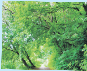
Nad ścieżką „wiszą” suche konary

Za bramą oddzielającą nową część parku od zabytkowej można odnieść wrażenie, że pracowników porządkowych od dawna tam nie było. Pokrzywy i chwasty w niektórych miejscach są wyższe od spacerujących mieszkańców, nad ścieżką pochylają się złamane drzewa, które przy silniejszym wietrze mogą runąć. W głębi parku jest ich zdecydowanie więcej. Do tego dodać można duże ilości gnijącej trawy zwożonej po skoszeniu z terenu miasta, która wygląda fatalnie. Czy to się zmieni? Urząd miasta przyznaje, że niezbędne jest podjęcie kosztownej inwestycji.