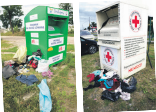
Zaśmiecone pojemniki, które stoją przy parkingu w pobliżu cmentarza na Zgierskiej

Ozorków Pojemniki z używaną odzieżą teoretycznie powinny być opróżniane dwa razy w miesiącu. W praktyce jednak często jest inaczej, dlatego wokół nich tworzą się małe wysypiska śmieci. Problemem są też akty wandalizmu - nie brakuje osób, które kradną z pojemników ubrania lub po prostu blaszane pudła niszczą. Pojemniki są też „dekorowane” przez graffitiarzy, oklejone ulotkami.