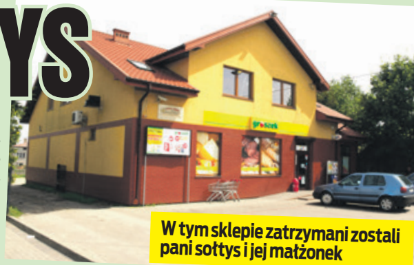
W tym sklepie zatrzymani zostali pani sołtys i jej mąż

- To jest wstyd na całą wieś. Ale przecież nie zrobiliśmy tego specjalnie. Teraz nie mogę spać. Wciąż o tym myślę. To nie jest prawda, że kiedykolwiek dochodziło do