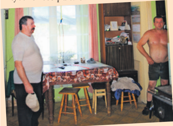
Bracia mają nadzieję, że dom się nie zawali