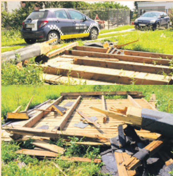
Trąba powietrzna z łatwością zerwała drewniany dach