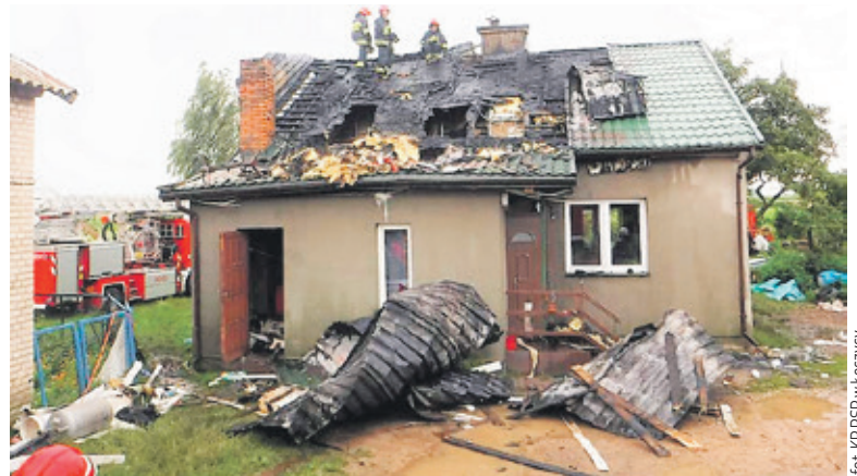
fol: KP PSP w Łęczycy

Wnętrze mieszkania również jest w fatalnym stanie. Rodzina państwa