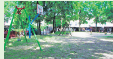
Plac zabaw przy ul. J. Grodzkiej 3/5 od dawna wymaga całkowitej wymiany sprzętów

Jednym z wytypowanych miejsc, jest plac zabaw przy ul. Jadwigi Grodzkiej 3/5. Mieszkańcy od dawna prosili urzędników chociażby o ustawienie urządzeń zdemontowanych z innych placów. W tej sprawie nawet dzieci wybrały się do urzędu dwa lata temu chcąc rozmawiać z burmi-