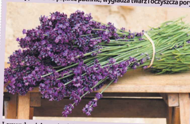
Lawenda pielęgnuje skórę

Do miksera wrzuc szklankę płatków owsianych, łyżkę stołową cukru, łyżkę stołową suszonej lawendy i łyżkę stołową suszonej mięty. Zmiksuj składniki na gruboziarnisty proszek i przesyj do słoika. Scrub przechowuj w ciemnym, chłodnym miejscu przez miesiąc i stosuj raz w tygodniu. Wymieszaj małą łyżeczkę proszku z odrobiną ciepłej wody, a następnie wmasuj w skórę i zmyj ciepłą wodą. Powtórz i na oczyszczonej skórze nałóż krem. Olejki eteryczne zawarte w lawendzie delikatnie pielęgnują skórę, a mięta działa odświeżająco. Scrub pięknie pachnie, wygładza twarz i oczyszcza pory.