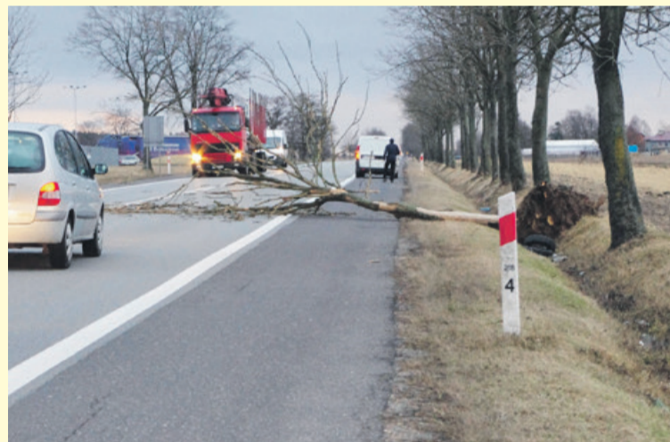
Na początku marca uschnięte drzewo spadło na samochód