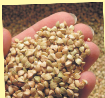
Łuski gryki mają właściwości antybakteryjne

Wśród Japończyków panuje przekonanie, że sypianie na materacu z gryki jest zdrowe i pozwala dobrze wypocząć. W łuskach gryki zawarta jest tanina, która hamuje rozwój bakterii i roztoczy. Między innymi dlatego specjaliści medycyny naturalnej gorąco polecają materace z łuską gryczaną. Materace i poduszki produkują się z coraz to nowszych materiałów, aby zadowolić wszystkie gusta i ulżyć osobom cierpiącym na różne dolegliwości. Ostatnio specjaliści medycyny naturalnej zalecają spać na materacu wypełnionym łuską gryczaną, czyli twardą i suchą okrywą ziarna gryki.