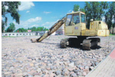
Na działce należącej do MMKT teren został już utwardzony

- Byłaby to wielofunkcyjna hala sportowa. Od ubiegłego roku prowadzę rozmowy z urzędem miasta i ze starostwem powiatowym w Łęczycy, żeby wspólnie zrealizować inwestycję. Chodzi o to, żeby starosta przekazał fragment działki przy Zespole Szkół Ponadgimnazjalnych. Połączylibyśmy ją z terenem przy kortach, wówczas można wybudować halę o powierzchni 2,5 tys. mkw. Według mnie, korzyści są obustronne. Uczniowie mogliby w ramach lekcji korzystać z sali, w której byłyby także siatki, bramki, kosze. Na takiej powierzchni zmieścilibyśmy cztery korty tenisowe. Cena wcale nie byłaby duża, jak na takie przedsięwzięcie. Zamknęlibyśmy ją maksymalnie w 2 mln zł, które z powodzeniem można pozyskać w ramach środków