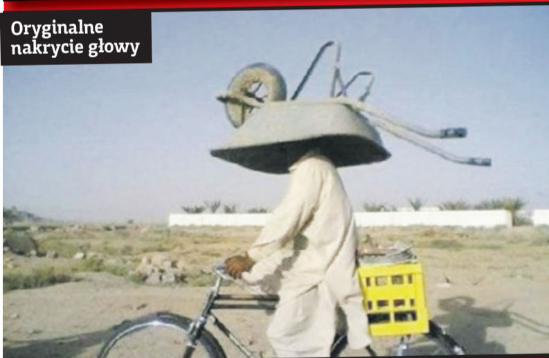
Oryginalne nakrycie głowy