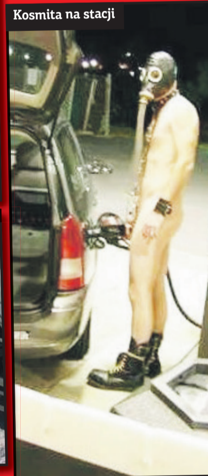
Kosmita na stacji