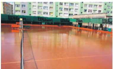
Woda z kortów tenisowych dość szybko spłynęła nie powodując żadnych strat

Najgorzej było na terenie strefy. Zalany był teren jednego z zakładów oraz droga dojazdowa. Doszło też do małych podtopień przy ul. Ozorkowskiej. Do dziś mamy wysoki poziom wody na miejskim zalewie, która płynie do starego koryta rzeki Bzury. Osobiście odwiedziliśmy wszystkie placówki oświatowe, do SP nr 4 pro-