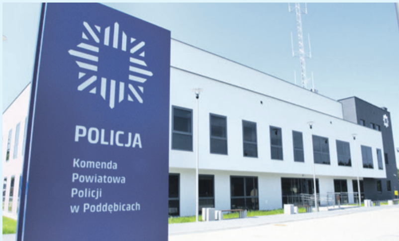
Nowa komenda poddębickiej policji mieści się przy Targowej

Poddębice Wiadomo już, że 13 czerwca policjanci przeprowadzą się do swojej nowej siedziby przy ul. Targowej 22. Wysłaliśmy maila z pytaniem do urzędu miasta o konkretne plany związane z planowanym już od dawna zagospodarowaniem starej komendy pod potrzeby lokali socjalnych. Konkretniej odpowiedzi nie uzyskaliśmy.