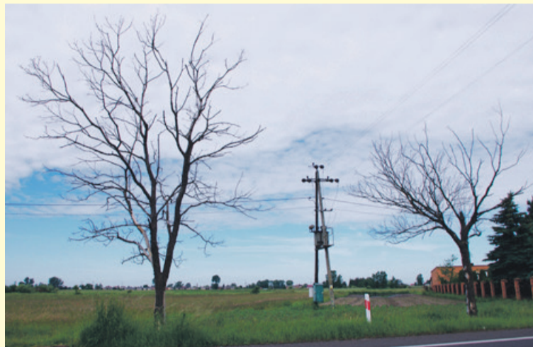
Wzdłuż drogi krajowej nr 91 pod Łęczycą suchych drzew nie brakuje