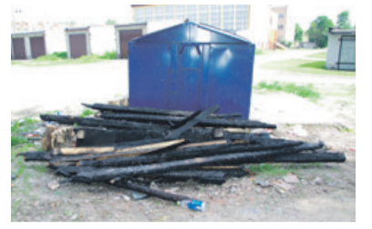
Deski to odpady wielkogabarytowe, nie powinny być podrzucone pod śmietnik

- Znam sprawę. Takich rzeczy nie możemy zabrać śmieciarką podczas opróżniania kontenera, bo później w sortowni byłby problem z tak dużymi odpadami. Ich właściciel w żadnym razie nie powinien podrzucać ich pod śmietnik. Nie wiem, jak można tak postępować. Przecież na terenie PGKiM-u jest możliwość oddania wszelkich odpadów wielkogabarytowych i nie ponosi się przy tym