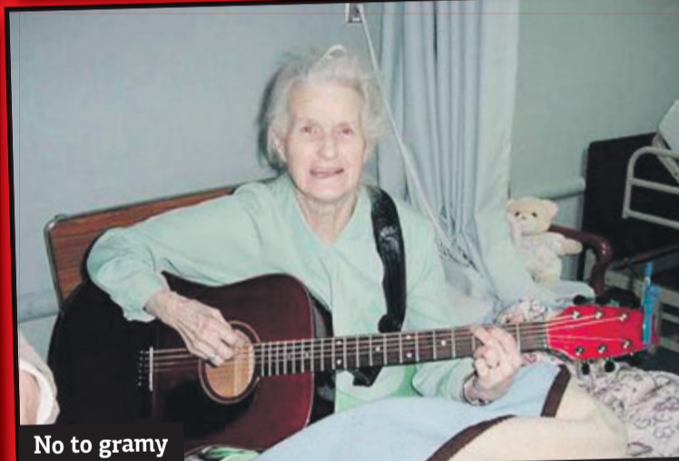
No to gramy