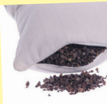
Dzięki poduszce z gryką lepiej śpiemy

Pokrowce pierzemy. Łuski należy wysypać do miski i wietrzyć przez kilka godzin. Ponownie wysypać do pokrowca. Jeżeli poduszka czy materac zamoczą się, trzeba