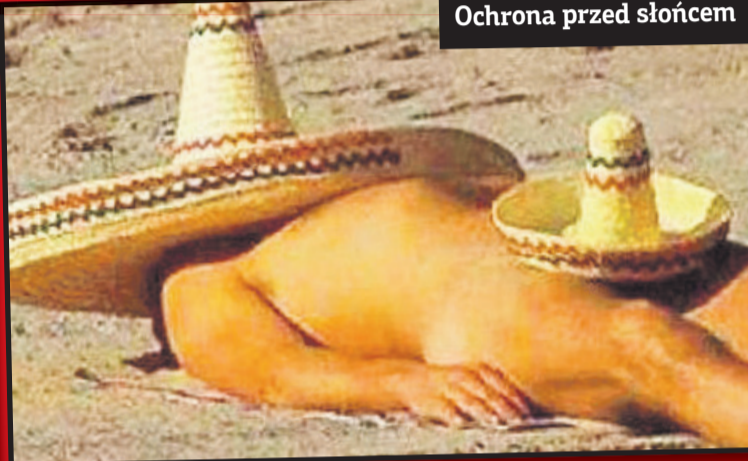
Ochrona przed słońcem