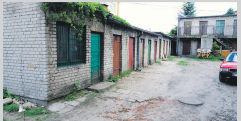
Do tragedii doszło na tym podwórku

- Po tej tragedii ojciec Marcina wrócił ze szpitala. Potrzebował pomocy. Pracownica socjalna z