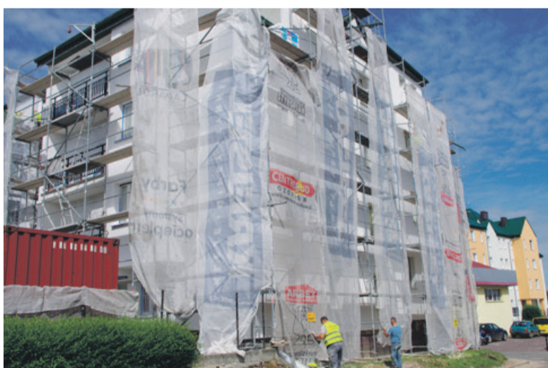
Trwa termomodernizacja „Gargamela”

- Ostatecznie większość lokatorów opowiedziała się za termomodernizacją budynków i prace remontowe ruszyły pełną parą. Rozterki mieszkańców związane z podjęciem decyzji o dociepleniu były w pełni zrozumiałe. Koszt inwestycji jest wysoki i wiąże się z dodatkowymi opłatami. Remont jednego bloku mieszkalnego (docieplenie elewacji, remont dachu i modernizacja poziomów cwu i co) kształtuje się na poziomie ponad 600 tys. zł. Środki z funduszu remontowe-