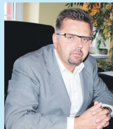
Burmistrz zarobił w ub. roku 158 806,31 zł

60-metrowe mieszkanie wycenione na 130 tys. zł. Uzyskała dochód w kwocie 73 637 zł. Wykazała auta: skodę roomster z 2009 r. i yeti z 2013 r.