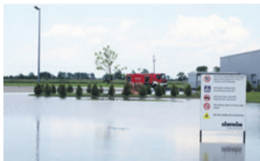
Teren jednego z zakładów na strefie był całkowicie podtopiony

w Witonii i gminie Witonia, gminie Łęczycza i częściowo w gminie Daszyna i gminie Grabów. Największe zagrożenie było w Witonii, gdzie 5 posesji zostało całkowicie zalanych