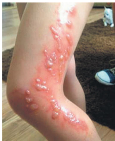
Oparzenie barszczem Sosnowskiego może być bardzo groźne

Zagrożenie dla zdrowia ludzi stanowią furanokumaryny zawarte w soku oraz w wydzielinie włosków gruczołowych barszczu Sosnowskiego. Związki te w obecności światła słonecznego, w szczególności promieni UVA i UVB,