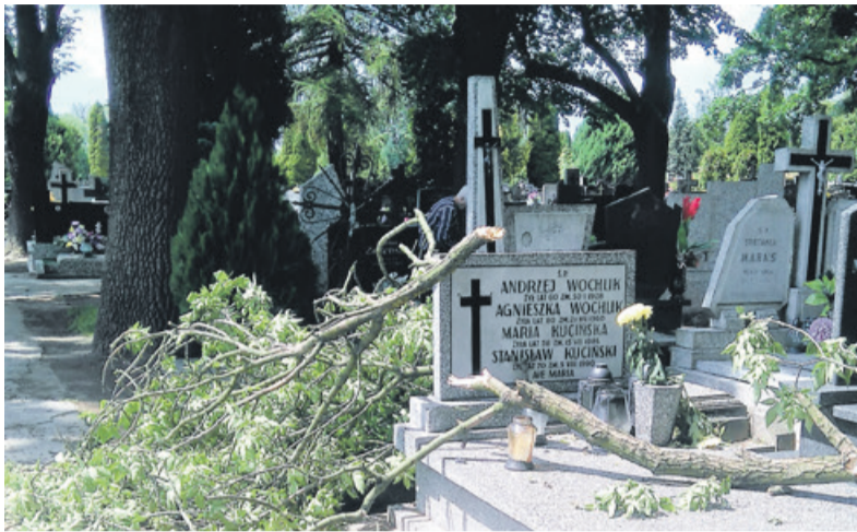
Przez silny wiatr, suche konary spadły na pomniki na łęczyckim cmentarzu