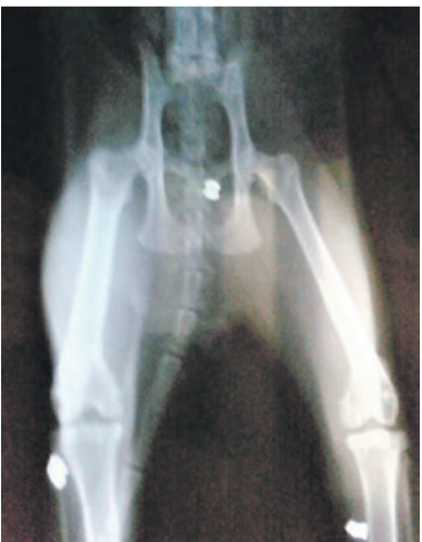
Jedno ze zdjęć rentgenowskich postrzelonego kota

Do miejscowych lecznic weterynaryjnych zgłasza się coraz więcej właścicieli psów i kotów, które zostały postrzelone z wiatrówki. Na portalach społecznościowych mieszkańcy przekazują sobie informacje o snajperze, który upodobał sobie bezbronne zwierzęta. Strzały padają głównie na ul. Średniej (pisaliśmy już o tym zdarzeniu), ale także na ul. Wodnej, Lipowej, Kochanowskiego i Reja.