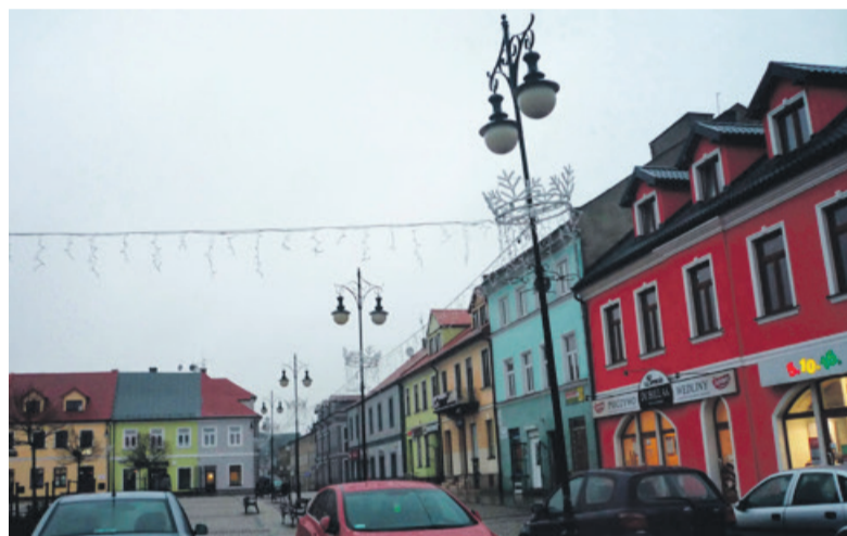
Na placu Kościuszki, tak jak w roku ubiegłym ozdobiono latarnie, między nimi zawisły świetlne girlandy

Miasto dokupiło 16 dekoracji latarniowych, lampki do oświetlenia 9 drzew, dekoracje 3D w formie dużej fontanny i minifontann do zamontowania w miejscu wyłączonego na zimę miejskiego wodotrysku na placu Kościuszki.