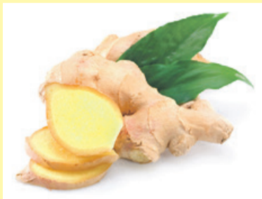
Imbir pomaga na zgagę

kminku lub kminu rzymskiego na szklankę wrzątku. Zaparzać 10 minut. Przed wypiciem przecedzić.