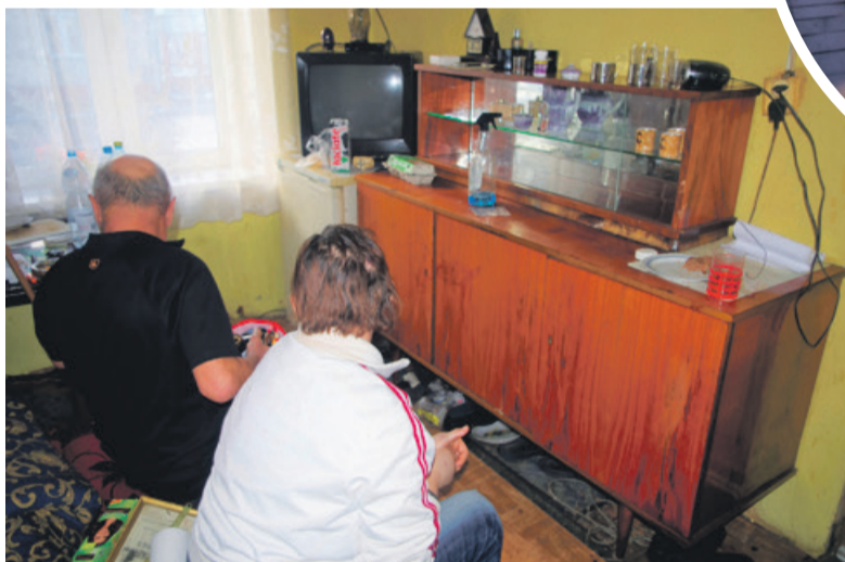
Aż trudno uwierzyć, że lokatorzy zostali pobici we własnym mieszkaniu

- Trwają czynności w postępowaniu. Decyzja o dalszym toku postępowania zostanie podjęta po ustaleniu stopnia obrażeń pokrzywdzonych - informuje mł. asp. Magdalena Czarnacka, rzecznik KPP w Zgierzu.