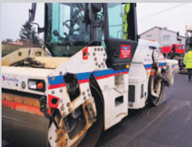
Kładzenie asfaltu na ul. Wiśniowej rozpoczęło się dopiero we wtorek

Jak się dowiedzieliśmy magistrat jest w trakcie przygotowywania dokumentacji niezbędnej do rozliczenia 9 grudnia dotacji z budżetu państwa na przebudowę remontowanych właśnie ulic. W tym terminie drogi powinny być już gotowe.