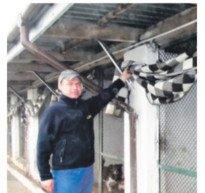
Pracownik schroniska pokazuje zawieszony na kojcu koc. Po opuszczeniu będzie chronił przed zimnym powietrzem

Obecnie w łęczyckim schronisku znajdują się 78 psów. Warto podkreślić, iż liczba adopcji w stosunku do ubiegłego roku wyraźnie się zwiększyła. Dobrze, gdyby ta tendencja się utrzymała.