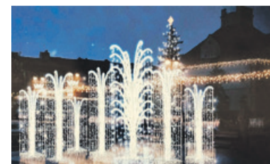
Na zdjęciu wizualizacja zimowych ozdób na miejskiej fontannie