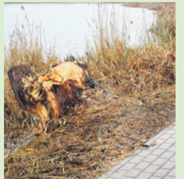
Obgryziona przez bobry wierzba została wycięta

O problemie z bobrami nad zalewem pisaliśmy niedawno w Reporterze. Mieszkańcy zwracali uwagę na szkody, jakie wyrządziły gryzonie. Urząd miejski złożył stosowne dokumenty o pozwolenie na wycięcie najbardziej zniszczonego drzewa, po którym został już tylko pień. On także ma zostać usunięty, najprawdopodobniej w tym tygodniu. Pracownicy zieleni miejskiej pod koniec ubiegłego tygodnia uprzątnęli również gałęzie i pnie pozostawione po wcześniejszej wycince, które zalegały nad brzegiem zalewu.