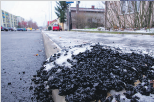
Na chodniku zalega masa bitumiczna

osiedlu” - asfalt wylewano dopiero we wtorek. Mieszkańcy tracą cierpliwość.