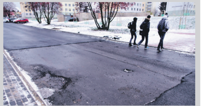
Na ul. Staszica w wielu miejscach brakuje łączników nowego asfaltu

został potrącony przez samochód, którego kierujący zdecydował się zabrać zwierzę do weterynarza. Lekarz weterynarz nie stwierdził u kota żadnych poważnych obrażeń związanych z potrąceniem, stwierdził natomiast, że zwierzę ma śrut w jamie brzusznej. Obecnie policjanci ustalają czy był to jednostkowy przypadek czy zranionych zwierząt mogło być więcej. Śledczy ustalają również kto mógł być sprawcą.