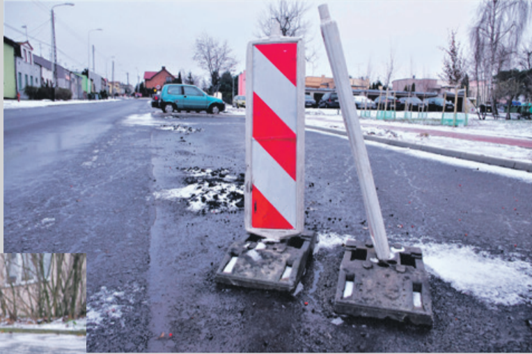
Na parkingach stoją pozostawione przez drogowców pachołki

Ozorków Na ulicy Staszica drogowcy kończą kładzenie asfaltu. Jednak w wielu miejscach jest totalny bałagan. Naprzeciwko ul. Kupieckiej w remontowanej drodze pozostawiono kilkumetrowy pas starej i dziurawej nawierzchni. Poza tym na parkingach wciąż stoją pachołki a na chodnikach zalega masa bitumiczna. Z kolei na ul. Wiśniowej – na „Owocowym