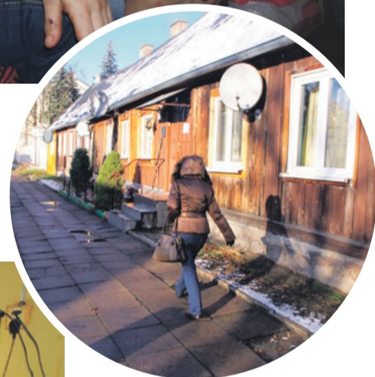
Dramat wydarzył się w drewniaku, w centrum Ozorkowa

- Trwają czynności w postępowaniu. Decyzja o dalszym toku postępowania zostanie podjęta po ustaleniu stopnia obrażeń pokrzywdzonych - informuje mł. asp. Magdalena Czarnacka, rzecznik KPP w Zgierzu.