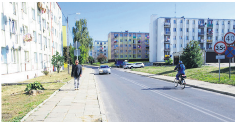
Eksmisji z zasobów spółdzielni mieszkaniowej jest coraz mniej

Ozorków To w tym roku pierwsza i najprawdopodobniej ostatnia eksmisja z zasobów spółdzielczych. Zadłużona rodzina podjęła decyzję, że dobrowolnie opuści lokal.