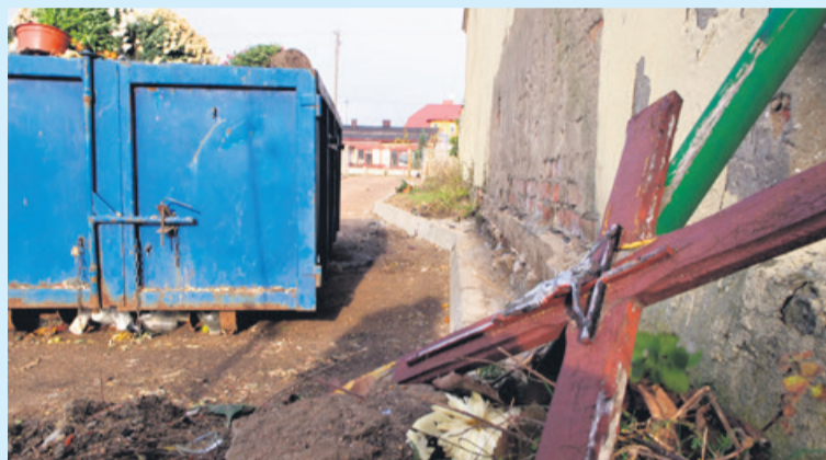
Warto również posprzątać krzyże rzucone w pobliżu kontenerów