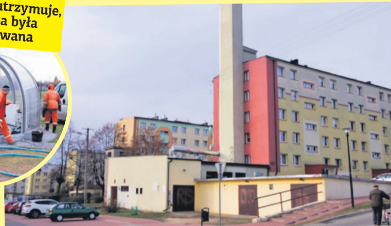
Pompa nie działała, dlatego trzeba było uruchomić kotłownię

- Tu jest pełna automatyka. Brykiety są automatycznie podawane do kotła. Utrzymywana jest stała temperatura - tłumaczy