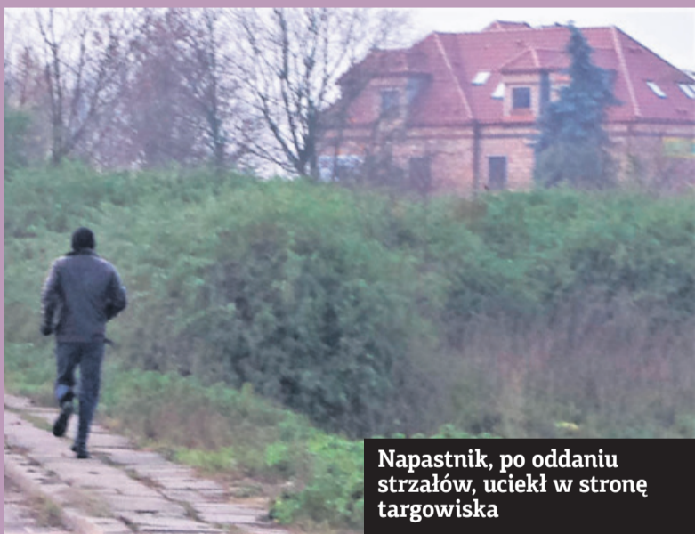
Napastnik, po oddaniu strzałów, uciekł w stronę targowiska

i karetka pogotowia. Dwóch funkcjonariuszy wypytywało o przebieg zdarzenia. Dziennikarz nie widział jednak, aby policja podjęła szybkie czynności w celu schwytania mężczyzny, który wciąż chodził z pistoletem po mieście. Być może wystarczyło wezwać dwa - trzy radiowozy.