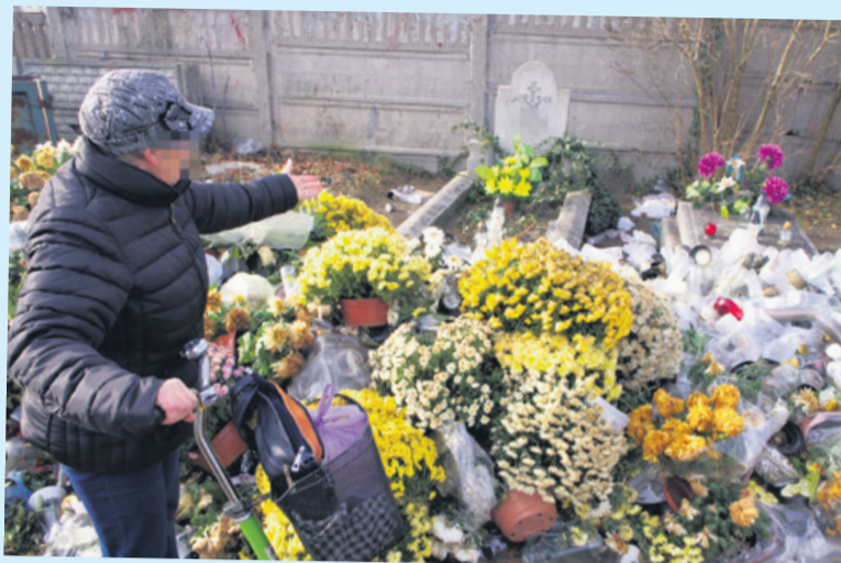
Jedna z odwiedzających cmentarz pokazuje zaśmiecone groby

Pomimo różnic w ocenie wszyscy mają nadzieję, że nieporządek zostanie wkrótce uprzątnięty. Widok zaśmieconego cmentarza naprawdę razi. Pracownicy odpowiedzialni za porządek powinni zwrócić również uwagę na stare krzyże, które też zostały pozostawione tuż przy kontenerach.