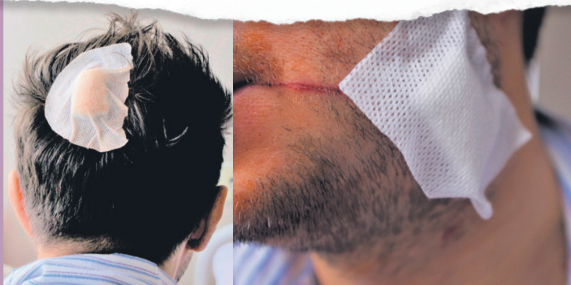
Stalowe kule utknęły w żuchwie i potylicy

Łęczyca Niestychane! Chory psychicznie mężczyzna strzelał w biały dzień do przechodnia a policjanci, którzy przyjechali na miejsce, zlekceważyli zdarzenie. Funkcjonariusze poinformowali komendę, że napastnik strzelał najprawdopodobniej z... zabawki, z plastikowych kulek. Okazało się, że poszkodowany, który trafił do szpitala, miał w głowie dwa metalowe pociski i cudem uniknął trwałego okaleczenia a nawet śmierci.