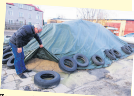
Zapasy piasku i soli zostały jeszcze z ub. roku

Czy w tym roku zima sprawi, że pracownicy Przedsiębiorstwa Usług Komunalnych, będą musieli ostro zakasać rękawy przy odśnieżaniu dróg i chodników? Wkrótce zobaczymy.