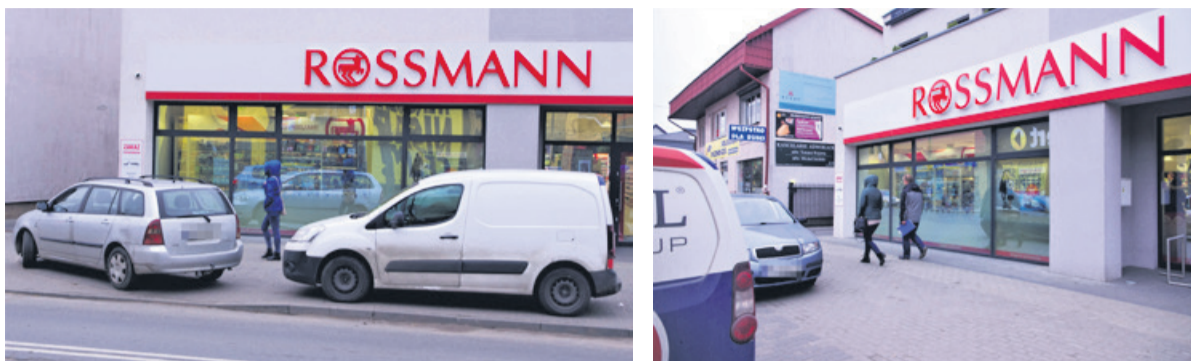
Zmotoryzowani klienci muszą parkować na chodniku przed drogerią

Ozorków Jeden z klientów drogerii przy ul. Starzyńskiego próbował wjechać na parking położony za budynkiem sklepu. Nie mógł, bo brama była zamknięta i nikt nie chciał jej otworzyć. Zdenewrowany klient pyta o powody zakazu wjazdu.