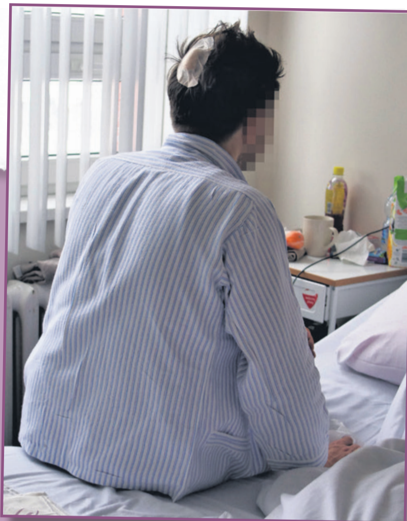
W szpitalu dziennikarz przeszedł dwie operacje

Bez zezwolenia i rejestracji w Polsce kupić można wiatrówki strzelające z siłą do 17 dżuli. To wystarczy, by zabić. Tę tezę udowodnili na wiele sposobów toruńscy naukowcy z Katedry Kryminalistyki Wydziału Prawa i Administracji UMK. Przeprowadzili szereg eksperymentów z użyciem ludzkiej czaszki i mózgu zwierzęcego. Metalowy śrut przebija czaszkę bez problemu. Wiatrówki przeważnie kupuje się w Internecie i nie trzeba ich rejestrować.