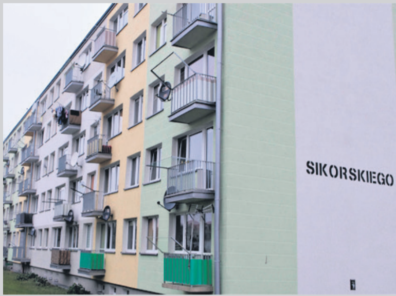
Z okna na II piętrze wypadł 18-latek. Na szczęście nie doznał poważnych urazów