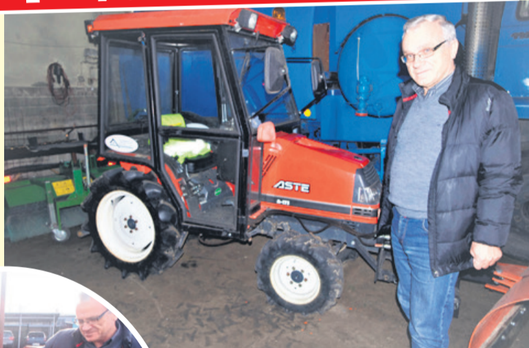
Prezes zapewnia, że sprzęt jest dobrze przygotowany nawet na ostrą zimę

- Do tego zadania liczba sprzętu jest wystarczająca. Mamy jedną dużą i uniwersalną pługopiaskarkę, jeden lekki pług, małe pługopiaskarki do chodników, lekki pług i dwa ciężkie pługi, które montowa-