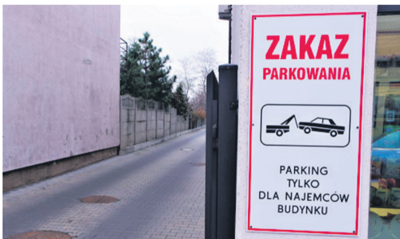
Na elewacji odpowiednia tablica informuje o zakazie

Jeszcze do niedawna parking był dostępny dla klientów sklepu. Nieoficjalnie dowiedzieliśmy się, że właściciele posesji zamknęli parking, bo klienci rzekomo go niszczyli - zostawiali śmieci, a nawet wymieniali olej w autach. Aby potwierdzić te informacje o komentarz poprosiliśmy w firmie do której należy nieruchomość wraz z parkingiem. Czekamy na odpowiedź.