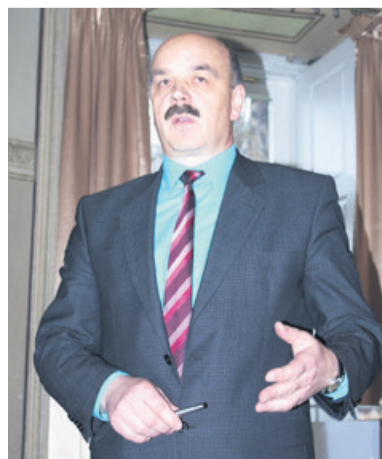
Wójt liczy na porozumienie ws. drogi

Zadzwoń lub wyślij smsa o treści "Doradca" 600-400-390