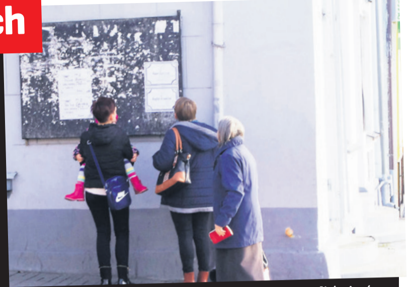
Przy tablicy z nekrologami mieszkańcy komentowali śmierć rolnika

- Do dramatu doszło po południu. Z tego co udało się do tej pory ustalić 50-latek naprawiał pracujący ciągnik. W pewnym momencie traktor ruszył i jedno z kół przejechało przez leżącego rolnika. W tym czasie nie było nikogo na podwórku - informuje st. asp. Elżbieta Tomczak, rzecznik