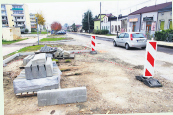
Na parkingach przy ul. Staszica składowane są materiały budowlane