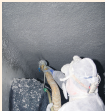
Nową metodą docieplone zostaną piwnice w trzech blokach