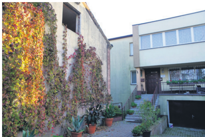
Zabytkowa ruina, która grozi zawaleniem, znajduje się blisko plebanii