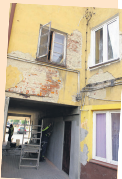
Od strony podwórka ściana wygląda fatalnie

- Właśnie remontowany jest prześwit bramowy między kamienicami nr 9 i 10 – informuje Izabela Dobrynin, rzecznik prasowy. - Wkrótce wyremontowane też zostaną trzy klatki schodowe. Niestety, w tym roku nie uda się już odnowić elewacji