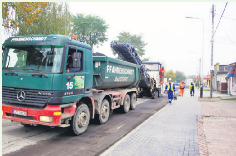
Drogowcy dopiero pod koniec ub. tygodnia rozpoczęli frezowanie nawierzchni ul. Staszica

- Brakuje mi słów, aby powiedzieć jak bardzo jestem zdenerwowany. Obserwuję z balkonu te prace. Jak była ładna pogoda i było ciepło, to pracujących drogowców nie widziałem. Teraz z kolei, jak pada deszcz i jest chłodno, to pracują w pocie czoła. Czy nie mogli zacząć tych prac z miesiąc wcześniej? - pyta jeden z mieszkańców osiedla. - Można się tylko domyślać, co teraz będzie się działo na osiedlu 1 listopada. Gdzie