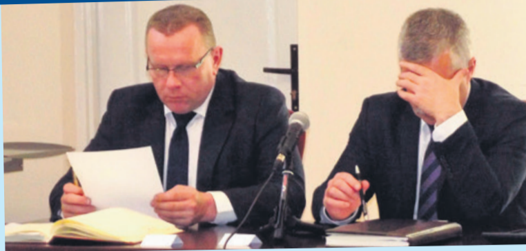
Niektóre sesje przygotowują burmistrza o ból głowy

swój dwudniowy pobyt w łęczycyjskim szpitalu dobrze. Twierdzi, że miał fachową opiekę.