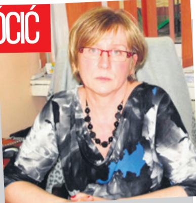
Była dyrektor postanowiła wrócić do szkoły podstawowej

- Zastanawiam się nad tym, czy dojdzie do zmiany nauczyciela matematyki. Nie da się ukryć, że wszelkie takie rozszady negatywnie wpływają na naukę dzieci. Zoba-