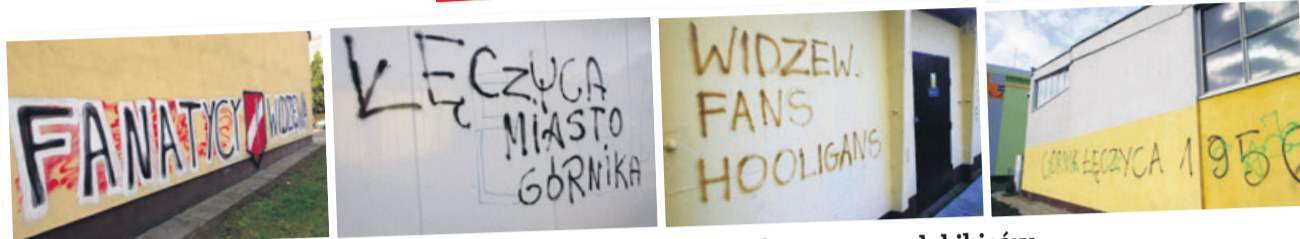
Wiele ścian jest w Łęczycy zabazgranych przez pseudokibiców

Funkcjonariusze, którzy przyjechali na miejsce, mieli powiedzieć, że pomazana ściana jest... umieszczeniem reklamy bez zgody właściciela budynku.