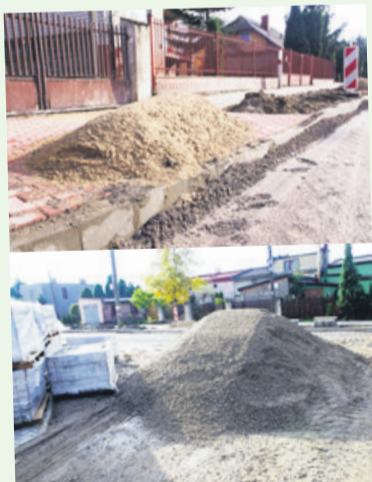
Góry piachu leżą na ulicach i przed posesjami