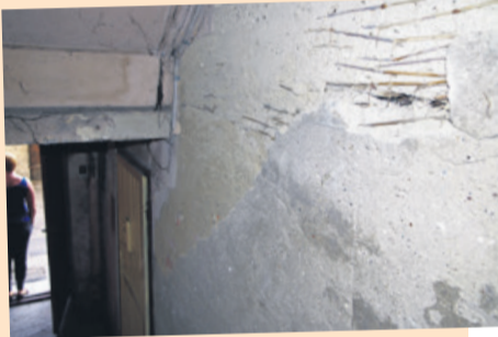
W tym roku remont objąć ma również klatki schodowe