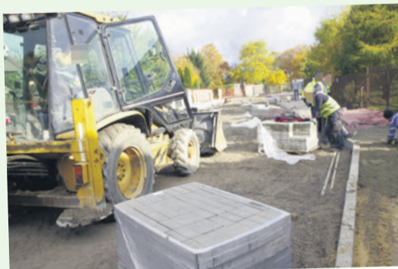
Na ul. Wiśniowej jest jeszcze gorzej niż na Staszica