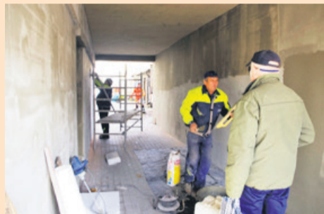
Remontowane jest wejście. Lokatorzy czekają na odnowienie elewacji domu

- Brama także wyglądała fatalnie, ale dla nas priorytetem jest odnowienie ścian domu. Tynk