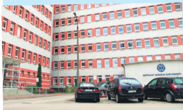
Krzysztof Lipiński w szpitalu spędził dwa dni