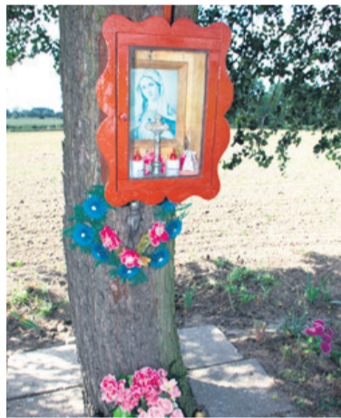
Kapliczka została naprawiona