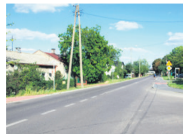
Czy przy ul. Konstytucji 3 Maja oszukiwani są najemcy?

- W zapisie jest informacja o ewentualnych zniszczeniach w mieszkaniu. Jeśli do takich dojdzie, to z najemcami rozwiązywana jest umowa a kaucja zostaje w kieszeni wynajmującego. Moi bliscy musieli wynieść się z domku przy Konstytucji,