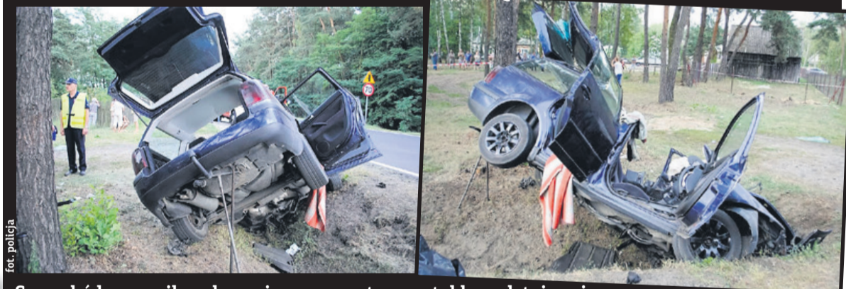
Samochód w wyniku zderzenia z przepustem został kompletnie zniszczony

Gm. Uniejów W miejscowości Człopy kierujący vw passatem z niewyjaśnionych dotąd przyczyn zjechał na przeciwległy pas ruchu i uderzył w betonowy przepust na drodze. Śmierć na miejscu poniósł 19-letni pasażer a kierujący w stanie ciężkim został przetransportowany śmigłowcem ratowniczym do szpitala w Łodzi.