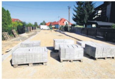
Ulica Broniewskiego nie została jeszcze do końca wyremontowana

- Brukarze, jeśli zdecydujemy się na zatrudnianie fachowców z zewnątrz, będą po prostu kierowani do innych prac na terenie miasta.