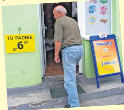
„Tu padnie szóstka”... i padła