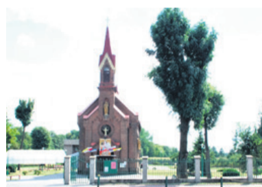
Proboszczowi tego kościoła otruto psa