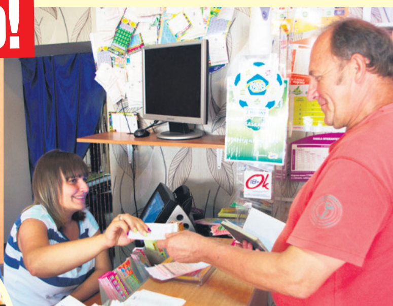
Gracze przybywa odkąd w punkcie padła „szóstka”