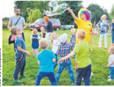
fol. UG Parzęczew