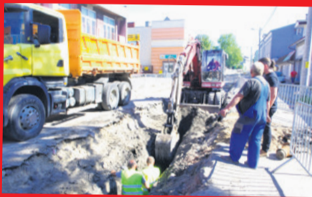
W czwartek ruszyły prace na ul. Poznańskiej

Łęczyca Po długiej przerwie na ul. Poznańskiej ponownie pojawili się robotnicy. Nie wiadomo jednak, jak długo potrwać roboty. W każdej chwili mogą zostać wstrzymane, bo remont przebiega pod archeologicznym nadzorem.