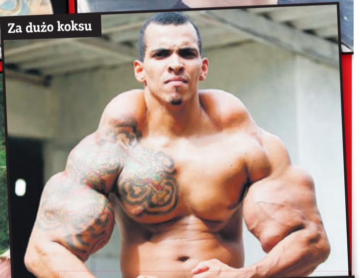
Za dużo koksu