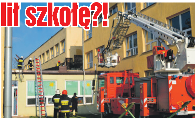
Strażacy gasili palącą się szkołę. Najprawdopodobniej było to celowe podpalenie.

Strażacy, z którymi rozmawialiśmy, są zdania, że na dachu nie doszło do samozapalenia. Była to celowa robota. Płomienie błyskawicznie rozprzestrzeniły się na znacznej powierzchni