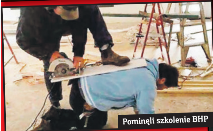
Pominęli szkolenie BHP