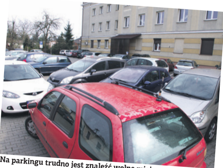
Na parkingu trudno jest znaleźć wolne miejsce

Kłopot jednak w tym, że miejsce jest zarezerwowane dla komunal-