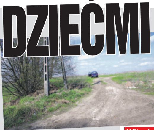
Najczęściej do erotycznych schadzek dochodzi na terenie byłego wysypiska śmieci, przy ul. Ogrodowej

Co powoduje demoralizację tak młodych osób? Psycholodzy mówią o zbyt powszechnie dostępnych treściach o zabarwieniu seksualnym. Będzie erotyczne docierają do dzieci z telewizji, ulicznych plakatów i przede wszystkim z internetu. Rodzice rzad-