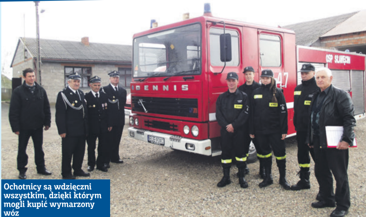
Ochotnicy są wdzięczni wszystkim, dzięki którym mogli kupić wymarzony wóz

Udało się. Druhowie również teraz prowadzą zbiórkę pieniędzy. Tym razem zamierzają kupić węże