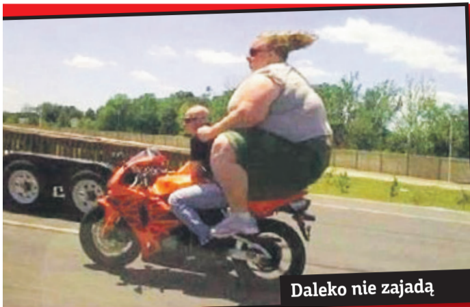
Daleko nie zajadą