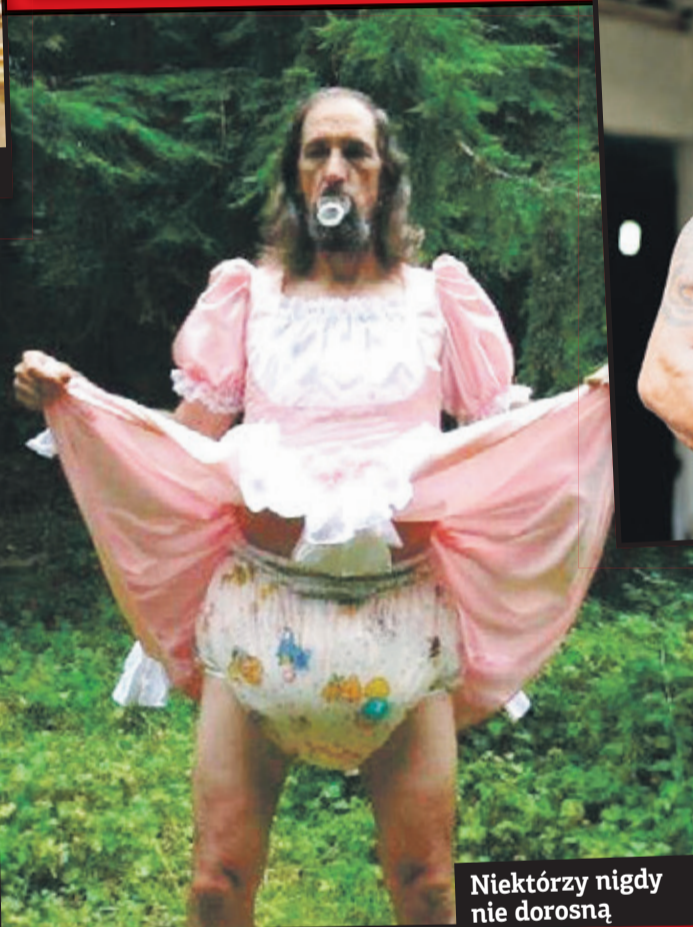
Niektórzy nigdy nie dorosną