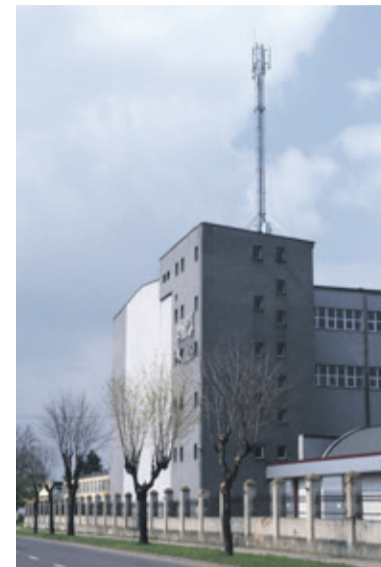
Czy mieszkańcom przeszkadza maszt, przy ul. Łęczyckiej?

- Zawsze działam dla dobra mieszkańców i nie kieruję się w swoich decyzjach żadnymi politycznymi przesłankami. Prze-