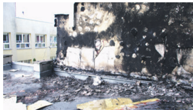
Ogień pojawił się na dachu łącznika