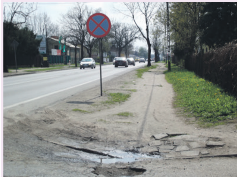
Wyjazd na krajówkę z ul. Kopalnianej pozostawia wiele do życzenia. Od tego miejsca brakuje też chodnika