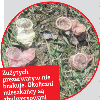
Zużytych prezerwatyw nie brakuje. Okoliczni mieszkańcy są zbulwersowani