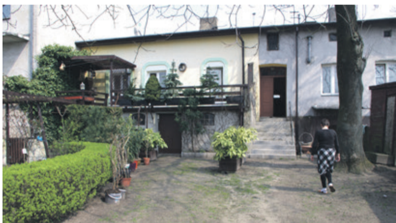
Lokatorzy skarżą się, że każdy może teraz wejść na podwórko