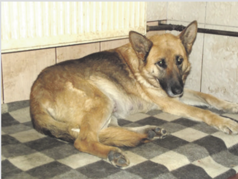
Nuka oszczeniła się we wtorek, pracownicy schroniska uratowali przed śmiercią jednego szczeniaka