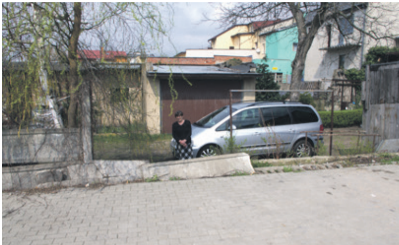
Zniszczony płot od strony placu targowego

- Przez dziurę w płocie każdy teraz może wejść na nasze podwórko. Obawiamy się chuliganów. Już długo prosimy o naprawę, ale jak do tej pory nic w tej sprawie się nie