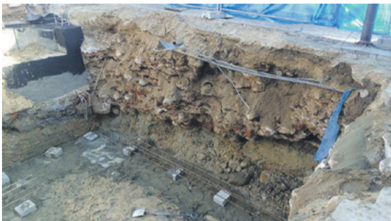
Po sporządzeniu dokumentacji archeologicznej, fragmenty murów obronnych ponownie zakopano