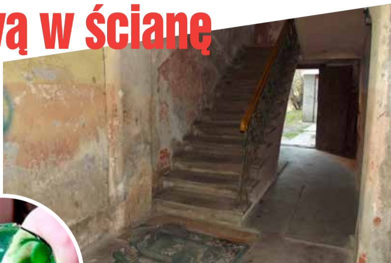
Mężczyzna kaleczył się potłuczoną butelką na klatce schodowej

i życia mężczyzny zastosowali dopuszczane prawem techniki obojętniające. Po wykonaniu wszelkich niezbędnych czynności dla zapewnienia jego bezpieczeństwa 36 - latek został przekazany pod opiekę medyczną.