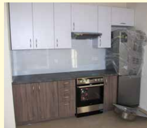
W lokalach socjalnych standard jest wysoki