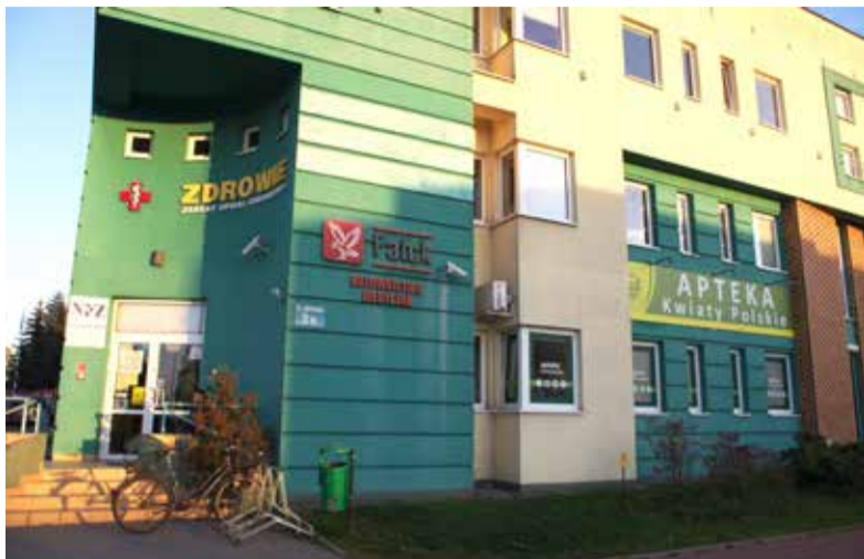
W prywatnym budynku, przy ul. Zielonej, mieści się przychodnia zdrowia i apteka

- Nie wiem, czy jest to niezgodne z prawem, ale na pewno mało etyczne - mówi jedna z pacjentek. - Wygląda to tak, jakby przychodnia zdrowia reklamowała tylko jedną aptekę w mieście. Tak nie powinno być.