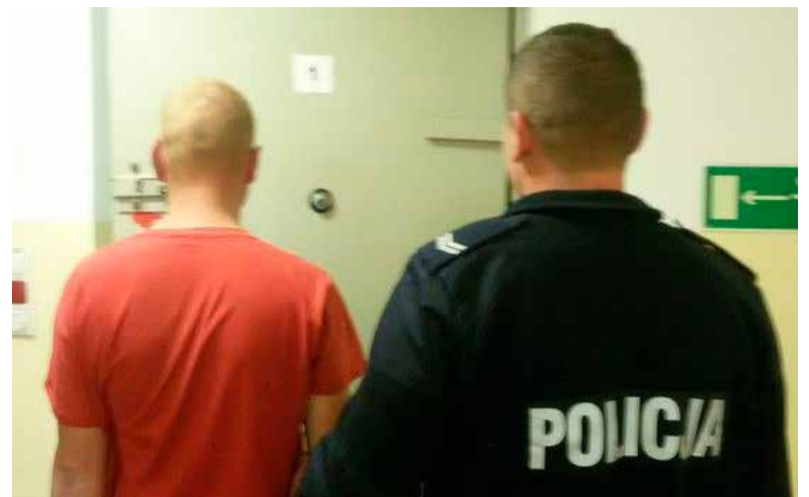
Policjanci, dzięki pomocy handlarzki, szybko zatrzymali sprawców napadu