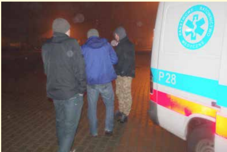
Po pierwszych badaniach desperat zapalił papierosa z negocjatorami