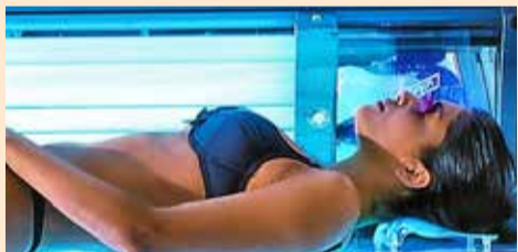
Od sztucznego słońca można się uzależnić