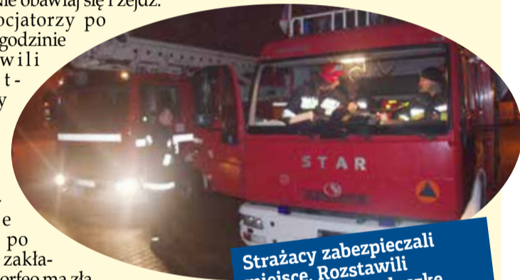
Strażacy zabezpieczali miejsce. Rozstawili przy kominie poduszkę powietrzną.