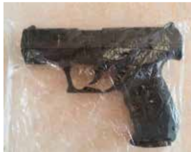
Broń została zabezpieczona i oddana do badań balistycznych

Sprawcami rozboju byli 27 i 34-letni mężczyźni. Obydwaj są z powiatu