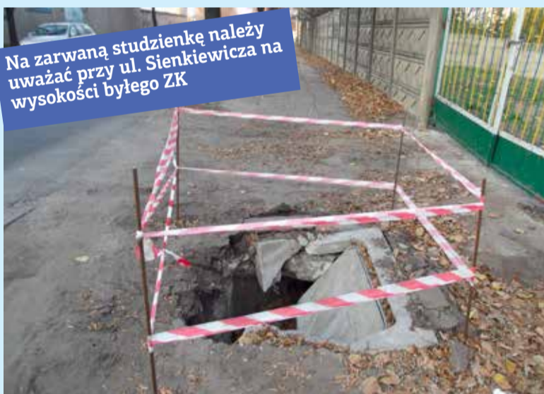
Na zarwaną studzienkę należy uważać przy ul. Sienkiewicza na wysokości byłego ZK