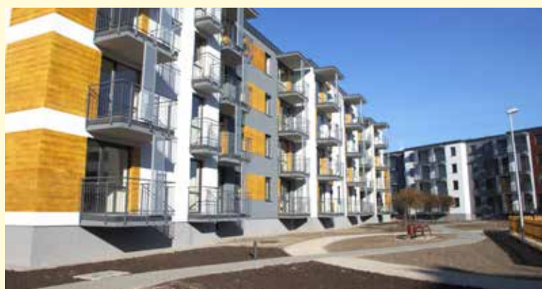
Mieszkania w nowych blokach zostały szybko sprzedane