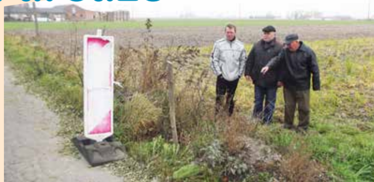
Zarwany rok temu przepust został zabezpieczony znakiem i taśmą

- To się w głowie nie mieści, że rok upływa a właściciel drogi, czyli