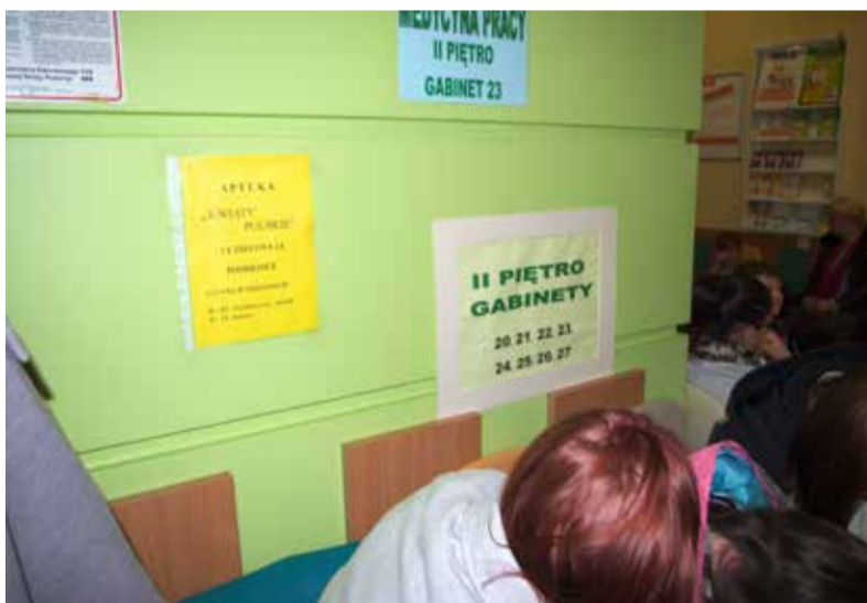
Żółte ulotki apteki znajdują się na korytarzach przychodni zdrowia