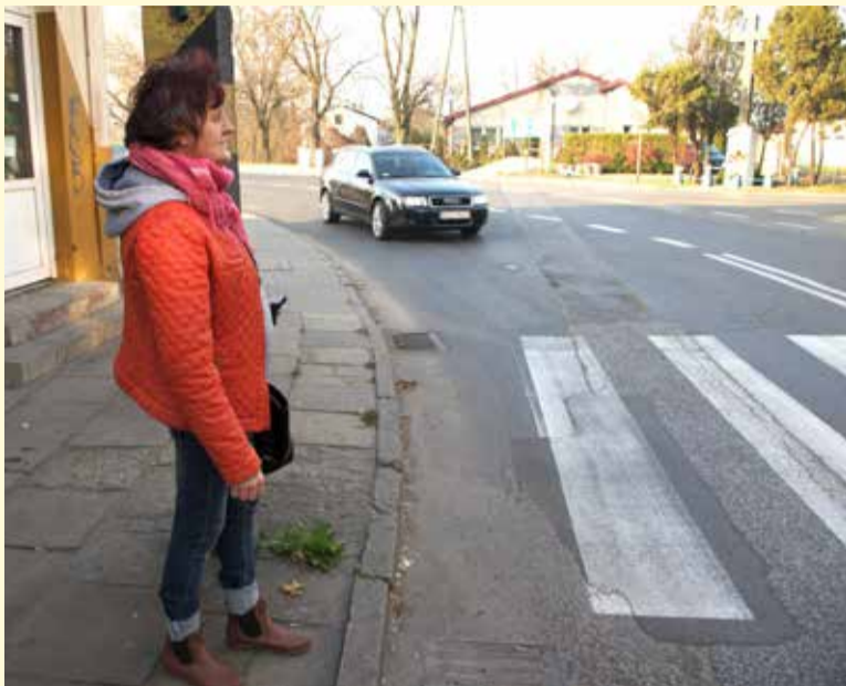
Przejście dla pieszych znajduje się tuż za łukiem drogi