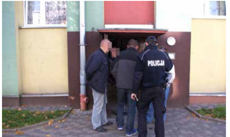
Policjanci interweniowali w bloku przy ul. Lotniczej

Ozorków Coraz więcej jest interwencji policji, która musi uspokajać krewkich mieszkańców.