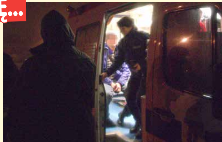
32-latek, po zejściu z komina, trafił wprost do karetki pogotowia

- Nie mogę z nią porozmawiać, bo wciąż nie odbiera telefonu. Zawieziecie mnie do Oli, czy jak