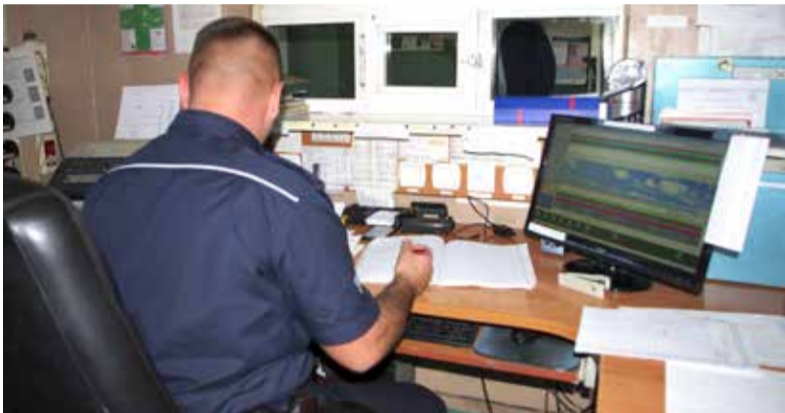
Wkrótce dyżurujący policjant będzie miał podgląd miejskiego monitoringu