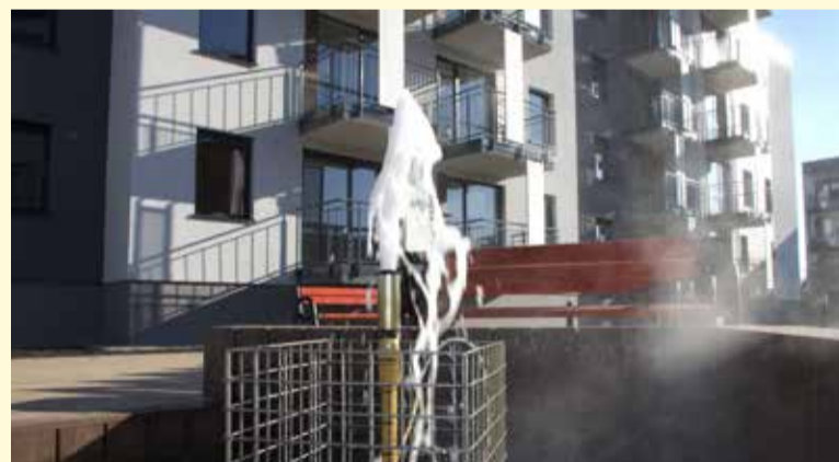
Na osiedlu znajduje się geotermalna fontanna