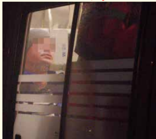
32-latek chciał popełnić samobójstwo