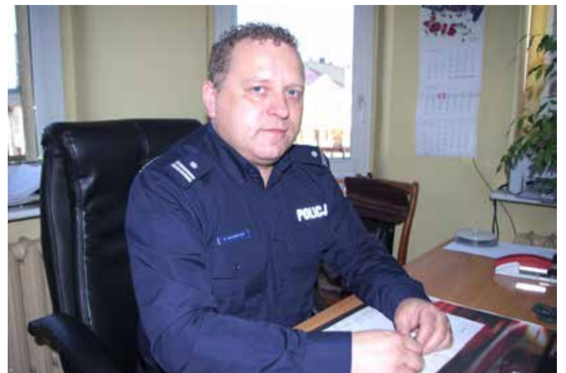
Komendant zapowiada korzystne zmiany w ozorkowskim komisariacie

- Jest taka opinia, że jak policjanci jeżdżą po mieście, to nie są skuteczni. To nie jest prawda. Chodzi m.in. o szybkość interwencji. Jak coś dzieje się na drugim krańcu miasta, to oczywiście, że policja będzie tam szybciej jadąc radiowozem – słyszy-