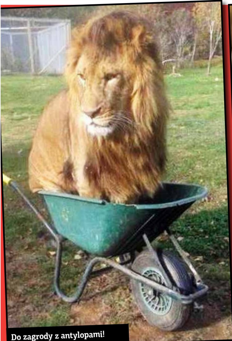
Do zagrody z antylopami!