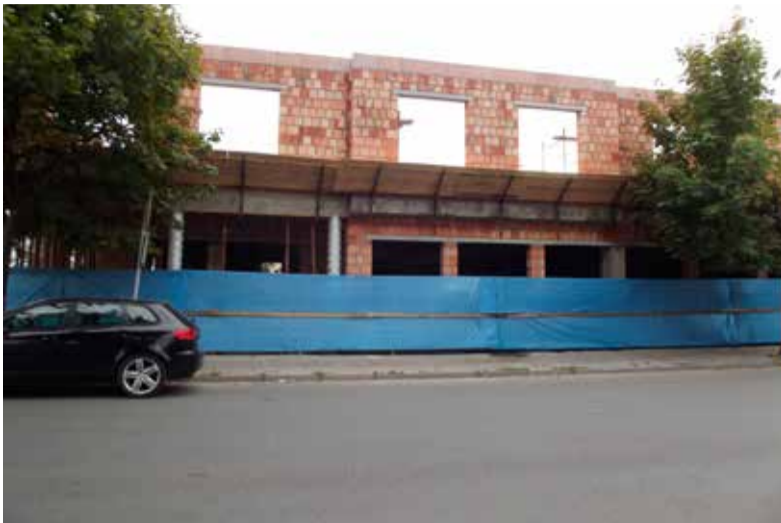
Co powstanie przy ul. Belwederskiej?

- Póki co, nie mogę wiele powiedzieć, bo jestem związany tajemnicą z firmą, która chce wynająć pomieszczenia. Zapewniam jednak, że będzie to bardzo ciekawa propozycja dla mieszkańców Łęczycy,