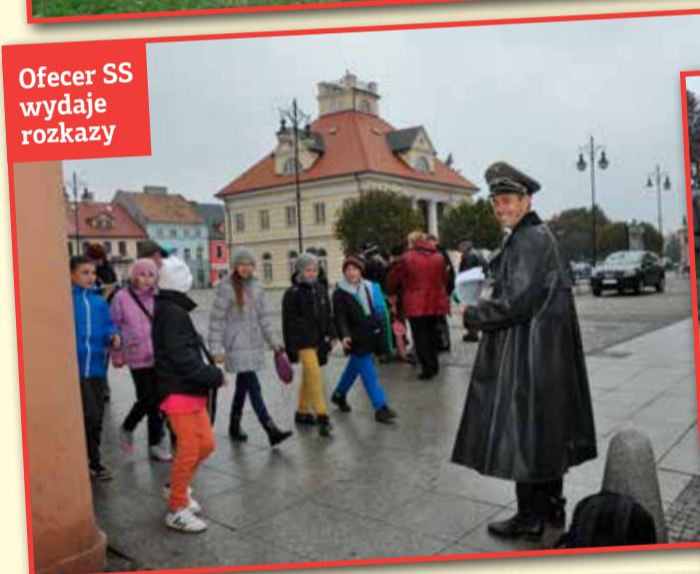
Oficer SS wydaje rozkazy