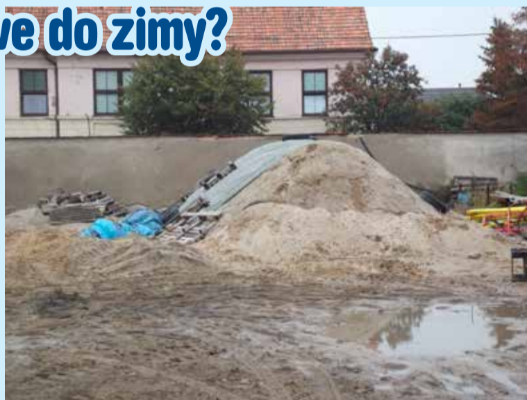
Na terenie bazy ZM nie ma dużych zapasów piasku

- Z ubiegłego sezonu zimowego (2014/2015) pozostało jeszcze do wykorzystania łącznie 200 ton soli i piachu. Dlatego też Zieleni Miejska w Łęczycy nie planuje obecnie zakupu tych materiałów. Do akcji zimowej na terenie miasta jesteśmy w stanie skierować 3 ciągniki, 3 pługi, 2 rozsiewacze oraz 2 wirlinowe odśnieżarki spalinowe, które są na wyposażeniu Zieleni Miejskiej. Posiadane przez jednostkę maszyny do zimowego utrzymania są obecnie w trakcie