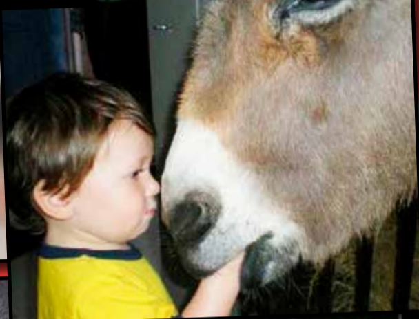
Ale rękę oddaj!