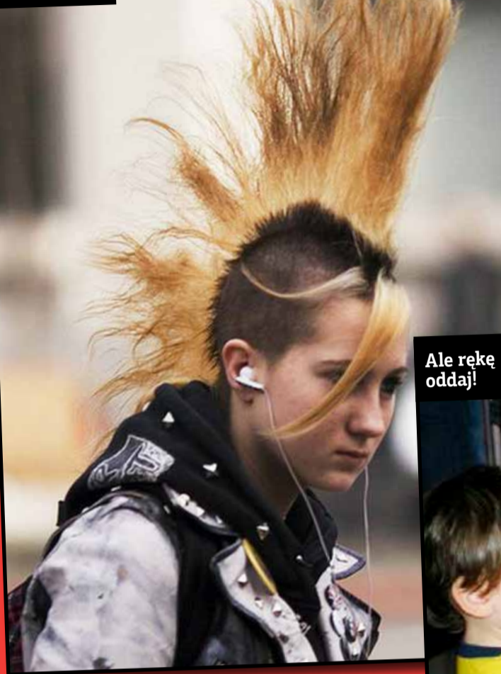
Fryzura pod prądem