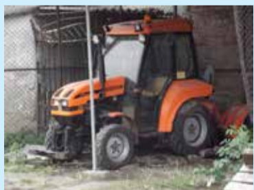
Sprzęt jest w trakcie przeglądu

Łęczycy Po ubiegłorocznej łagodnej zimy zapasy piasku, które zostały w dyspozycji Zieleni Miejskiej mają wystarczyć na zbliżający się sezon. Miasto jeszcze nie do końca jednak przygotowało się do zimy, maszyny dopiero przechodzą niezbędne przeglądy. Jak pokazuje przykład z minionego poniedziałku, kiedy to pogoda nagle się pogorszyła, trudno przewidzieć, kiedy trzeba będzie zająć się odśnieżaniem.