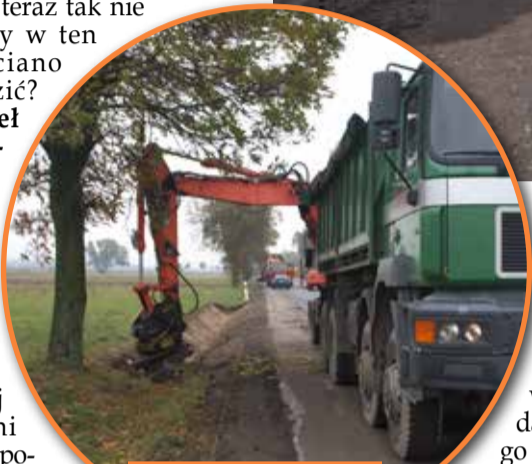
Przy drodze pogłębiane są rowy melioracyjne

wcześniej. Nie chciałbym się wypowiadać, dlaczego asfalt nie został położony na poboczach.