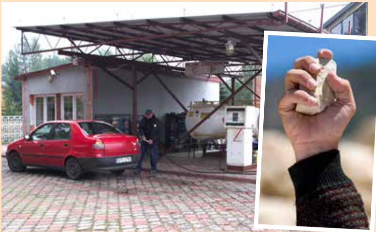
Na obrzeżach Poddębic doszło do nietypowego napadu

Dowiedzieliśmy się, że pracownik nie przestraszył się agresorów. W chwili napadu pił herbatę. Trzymał w ręku kubek, którym w