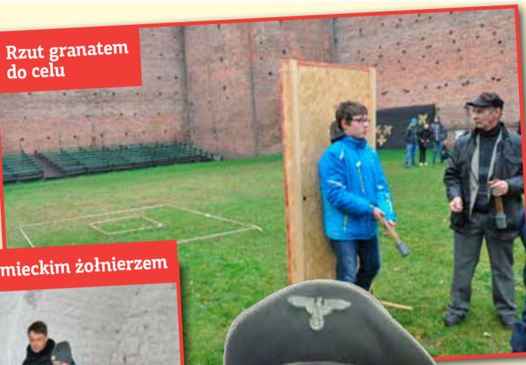
Rzut granatem do celu