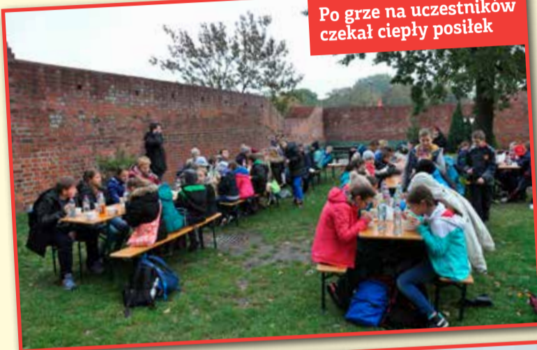
Po grze na uczestników czekał ciepły posiłek