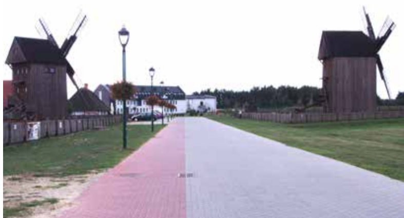
Planuje się, aby zadaszony tor narciarski stanął w pobliżu młynów i restauracji