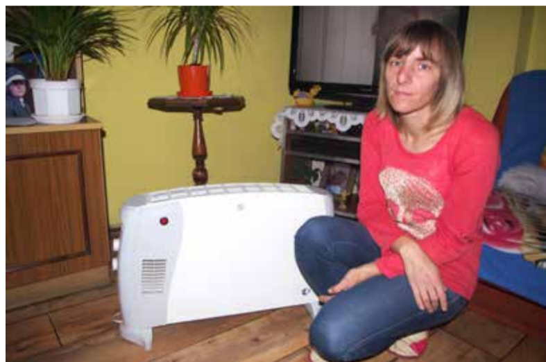
Rachunki za prąd będą kosmiczne – martwią się lokatorzy ogrzewający mieszkania elektrycznymi piecykami

Niech pan stąd idzie i nie robi zdjęć – usłyszeliśmy od pracowników ze zgierskiej firmy