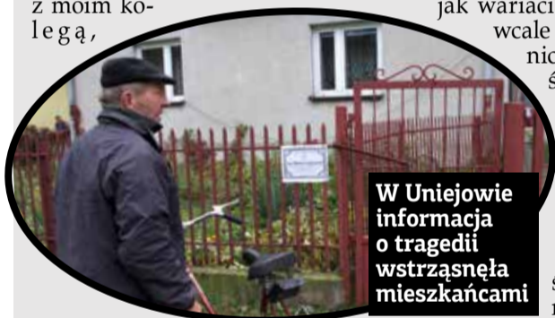
W Uniejowie informacja o tragedii wstrząsnęła mieszkańcami