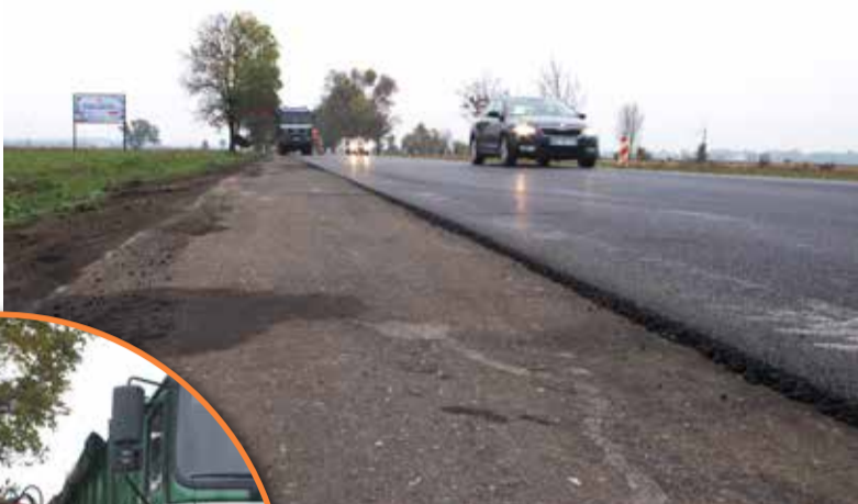
Pobocza nie zostały wyasfaltowane

- To prawda, że asfalt nie został położony na poboczach - przyznaje Tomasz Włodarczyk , kierownik budowy. - Jednak oznakowanie poziome, czyli pasy przy poboczach określające szerokość drogi do wykorzystania dla kierowców, będą w tym samym miejscu co