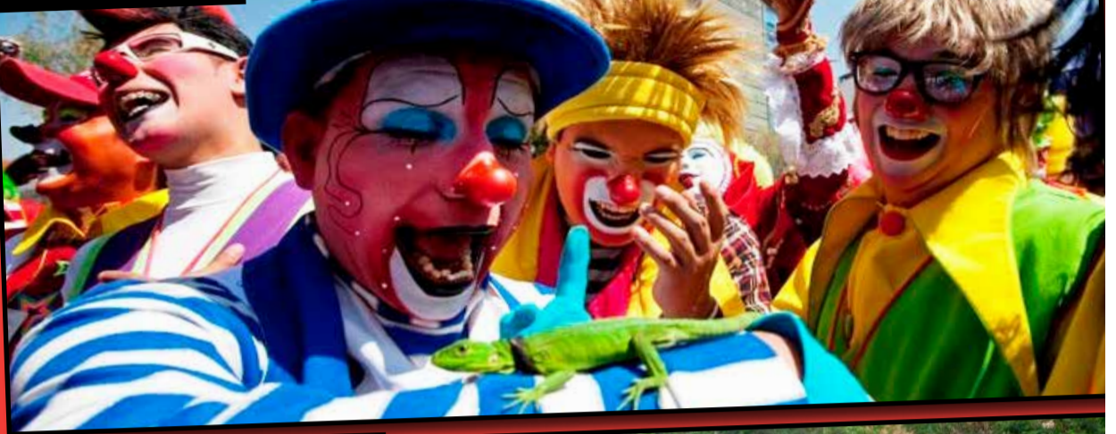
Zabawa z jaszczurką