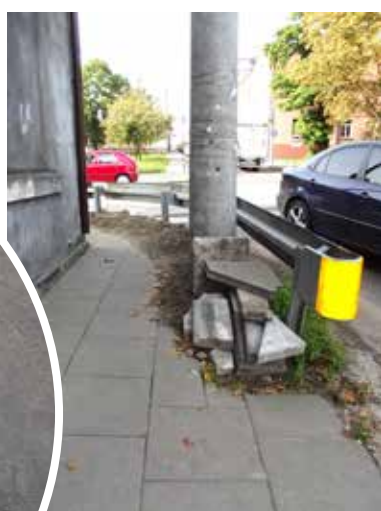
Pod słupem zostawiono stare płyty chodnikowe

uwagę, ile piachu tutaj zostawili. Usypano jakiś wał, nie wiem po co. W dodatku przed nowym słupem leżą porzucone płyty chodnikowe - usłyszeliśmy od właściciela pobliskiego sklepu. - Tak to już u nas jest, coś się robi, ale nic przy tym nie myśli. Zakręt jest teraz węższy przez ten piach, bariereki też wydają się być bliżej kamienicy.