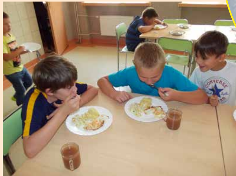
Dzieci z apetytem obiadów nie jedzą

żywienie dzieci, ale na pewno nie zgadzam się z nową ustawą. Pewne składniki można ograniczyć, ale ich wyeliminowanie jest niemożliwe przy zachowaniu smaku potrawy. Ustawa pozbawiła nas możliwości podawania zróżnicowanych i urozmaiconych posiłków. Dzieci najbardziej lubią kotlety schabowe i mielone, a jeśli