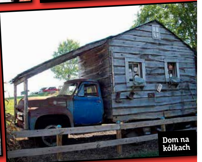
Dom na kółkach