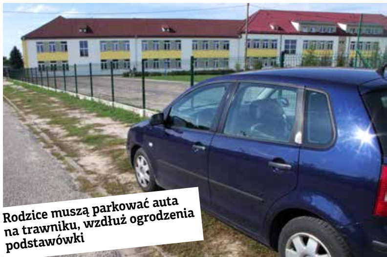
Rodzice muszą parkować auta na trawniku, wzdłuż ogrodzenia podstawówki