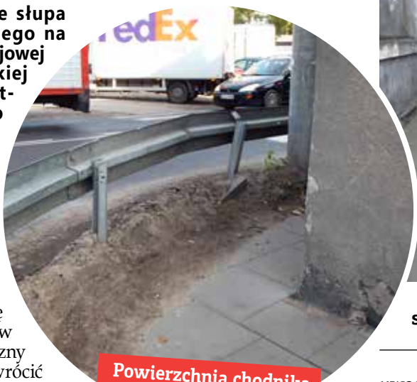
Powierzchnia chodnika została mocno zwężona

- Stup przewrócił się po lipcowej nawałnicy, w sierpniu zakład energetyczny go wymienił. Proszę zwrócić