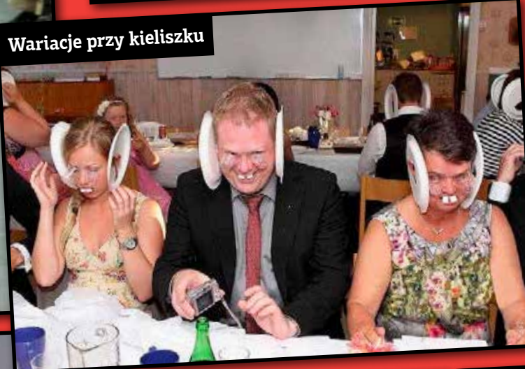
Wariacje przy kieliszku