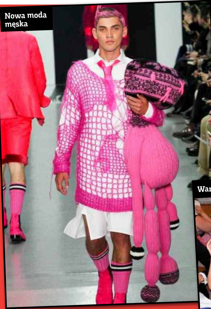
Nowa moda męska