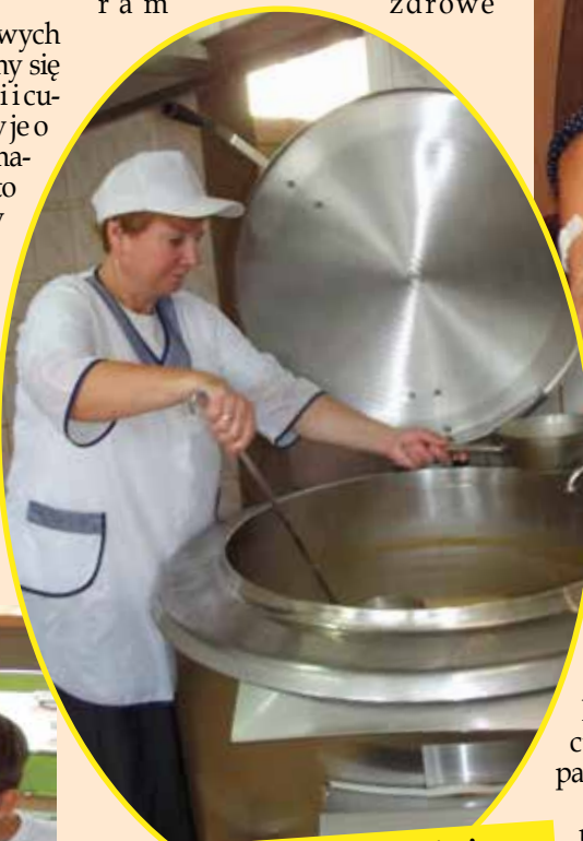
W szkolnej kuchni nie powtórzy się już wiele potraw