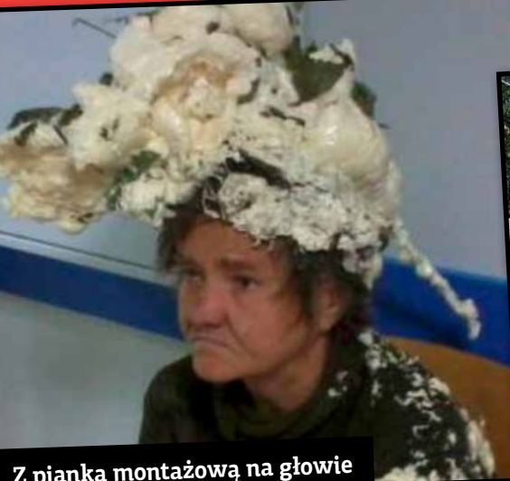
Z pianka montażową na głowie