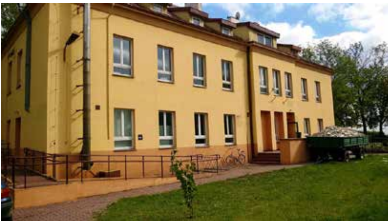
W budynku działać będzie Dzienny Dom Pobytu Seniora

- Lokatorzy pozostają w budynku, w swoich mieszkaniach na tych samych zasadach. Żaden z lokatorów nie otrzymał wypowiedzenia. Pogram Senior WIGOPR dotyczy zaadaptowania i wyposażenia pomieszczeń na parterze - informuje Barbara Welnicka z UG w Grabowie. - W ramach dotacji do końca roku będą świadczone usługi rehabilitacyjne dwa razy w tygodniu po 2 godziny. Na wyposażeniu sali ćwiczeń znajdują się urządzenia, które pozwolą seniorom na samodzielne ćwiczenia i treningi. Będą to m.in.: 2 rowerki rehabilitacyjne, zestawy do nordic walking, piłki, materace, drabinki, ciężarki czy taśmy.