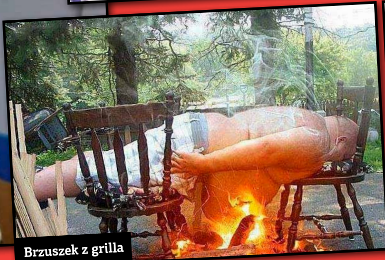
Brzuszek z grilla