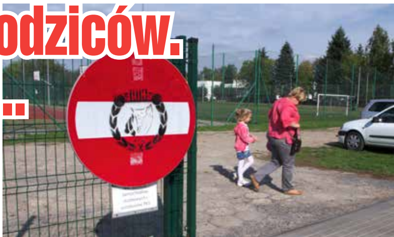
Zakaz wjazdu nie dotyczy samochodów nauczycieli i szkolnych autobusów

dniu w którym odwiedziliśmy podstawówkę, pomimo zakazu, niektórzy rodzice wjeżdżali na szkolny teren.