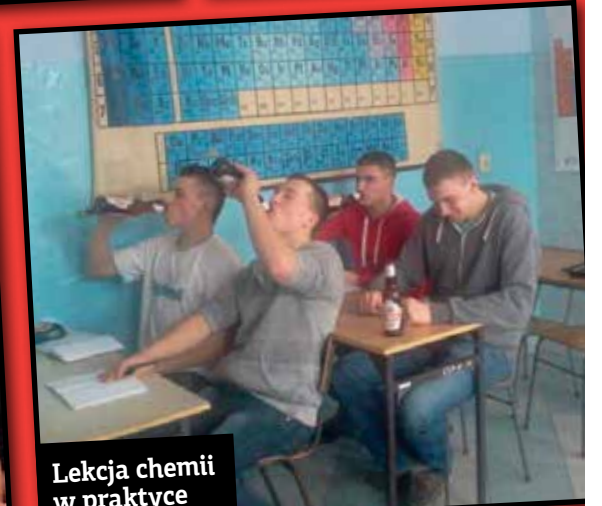
Lekcja chemii w praktyce