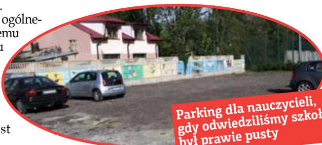
Parking dla nauczycieli, gdy odwiedziliśmy szkołę, był prawie pusty