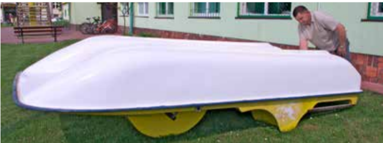
Przed MOSiR-em odnawiany był sprzęt pływający

dowiedzieliśmy do dyspozycji wypożyczających będą 4 kajaki i tak samo liczba rowerów wodnych. Wypożyczenie kajaka na pół godziny kosztować ma 4,90 zł, natomiast za pół godziny pływania rowerem wodnym zapłacimy 8,60 zł. Nad bezpieczeństwem kąpielących się czuwać będzie 2 ratowników. (stop)