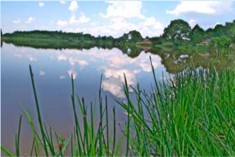
W wodzie ozorkowianin leżał najprawdopodobniej przez kilkanaście minut