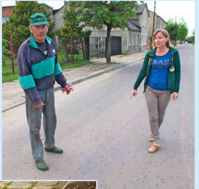
Mieszkańcy twierdzą, że remont ul. Praga był źle wykonany

- Przy silnych opadach deszczu studzienka w ul. Praga nie przyjmowała całej wody opadowej, dlatego w kwietniu tego roku został nacięty rowek odwadniająca przy krawężniku, od-