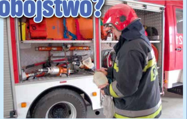
Strażakom udało się przywrócić funkcję życiową starszego mieszkańca. Niestety w zgierskim szpitalu pacjent zmarł