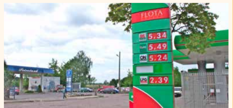
W mieście dwie stacje paliwowe są naprzeciwko siebie

ŁĘCZYCA Wyjeżdżając z miasta - w stronę Krośnice - kierowcy mają do wyboru dwie stacje paliwowe, położone naprzeciwko siebie zaledwie o kilkadziesiąt metrów. Wystarczy, że skręcą w prawo albo w lewo. Chyba w całym regionie nie ma tak blisko siebie położonych stacji paliwowych. Jak stacje konkurują ze sobą?