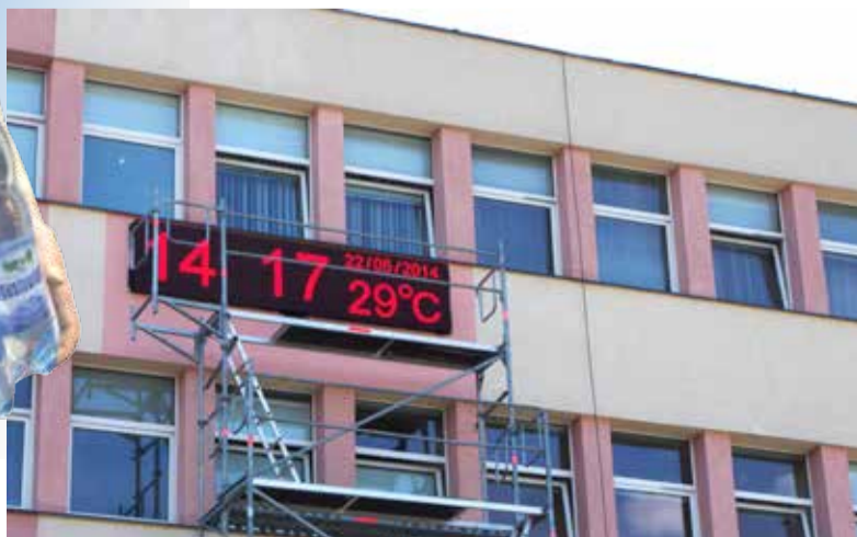
Termometr na urzędzie wskazywał 29 stopni w cieniu