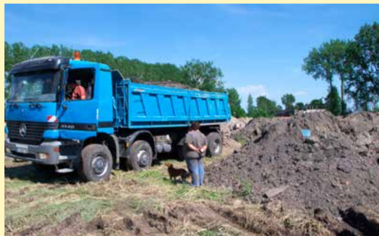
Kolejna „dostawa”. Czy w ziemi jest złom, który można sprzedać?

też miedzianych przedmiotów. Zbieracze złomu ryzykują swoim zdrowiem. W ziemi pełno jest ostrych prętów, drutów, gruzu. Łatwo o upadek. Nie zważają jednak na to dorośli a wśród nich dzieci. Chęć zarobku jest silniejsza od zdrowego rozsądku.