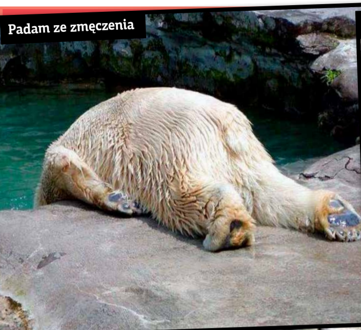
Padam ze zmęczenia