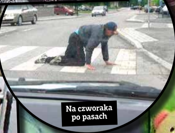
Na czworaka po pasach