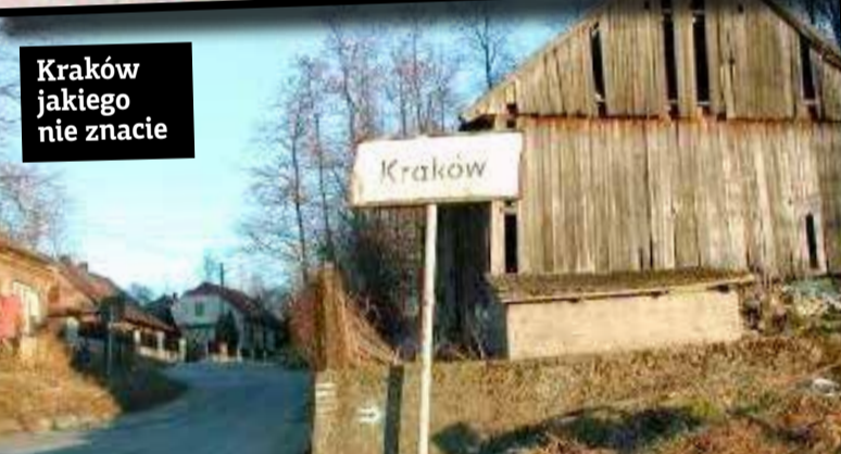
Kraków jakiego nie znacie