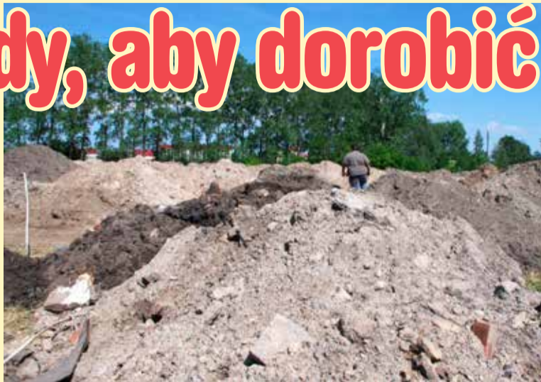
W hałdach przy Kopalnianej spotkać można ubogich mieszkańców

Jedni mają prymitywne saperki, drudzy porządne szpadle. Wszystkich łączy jeden cel – wykopać jak najwięcej metalowych, aluminiowych czy