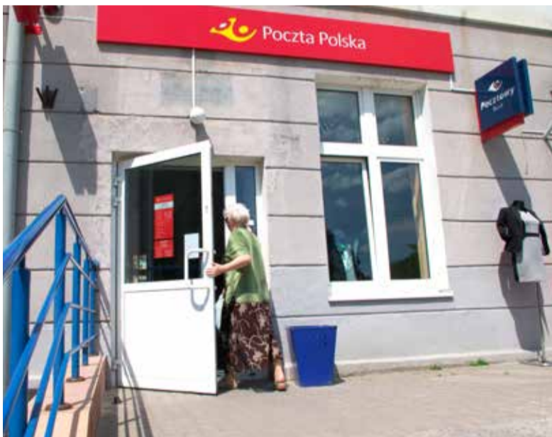
Na poczcie zaczęło działać towarzystwo ubezpieczeń