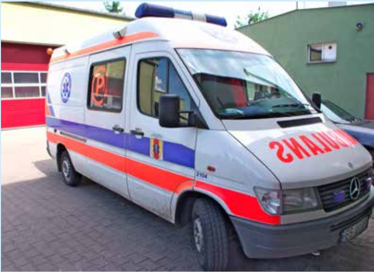
W czasie dramatu nad zalewem jedyna w mieście karetka była w Łodzi