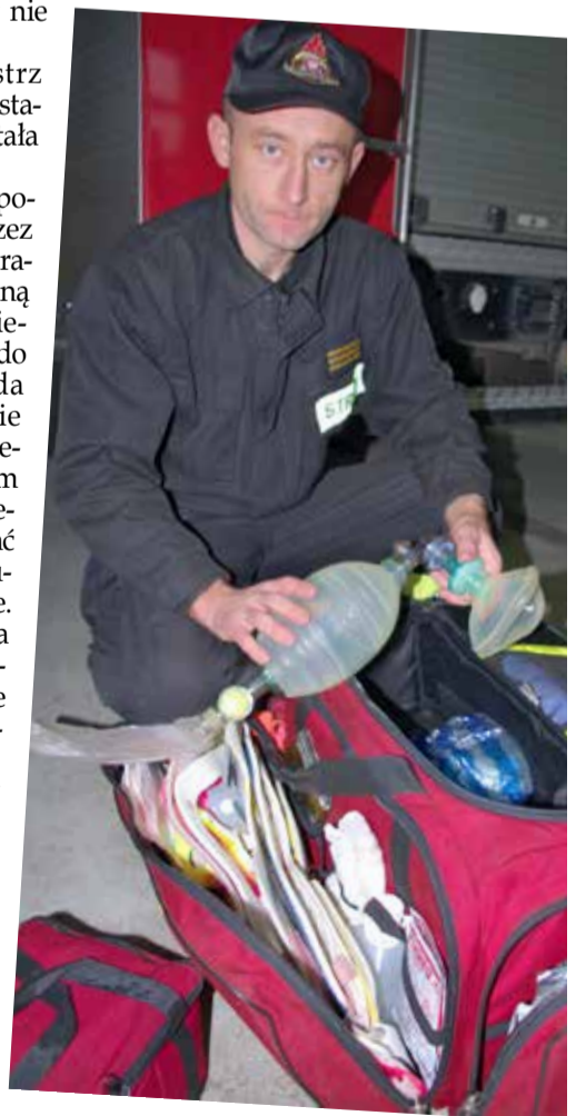
Strażak pokazuje specjalistyczną medyczną torbę z bogatym wyposażeniem

- Lokalizacja karettek pogotowia ustalana jest przez wojewodę łódzkiego. Wyraziłem na piśmie negatywną opinię odnośnie przeniesienia jednej z karettek do Zgierza. Pani wojewoda podejmując decyzję nie uwzględniła niestety mojego stanowiska. Spotkałem się również z panią wojewodą, by przedyskutować temat pozostawienia drugiej karetki w Ozorkowie. Pomimo prób wojewoda nie zmieniła swojej decyzji. Warto wspomnieć, że dzięki rozmowom prowadzonym bezpośrednio z panią dyrektorem NFZ w Łodzi oraz dyrektorem Wojewódzkiej Stacji Ratownictwa Medycznego w Łodzi przywrócono w Ozorkowie nocną i świąteczną pomoc ambulatoryjną. W rezultacie mieszkańcy Ozorkowa mogą na miejscu korzystać z pomocy lekarskiej w niedziele i święta - mówi burmistrz.