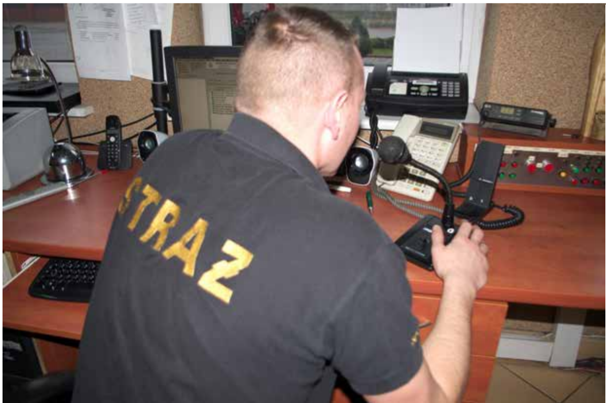
Strażacy coraz częściej odbierają sygnały z centrali pogotowia, aby jechać do chorych

Dowódca JRG w Ozorkowie nie chce komentować tego, że w Ozorkowie stacjonuje od niedawna tylko jedna karetka - notabene przy strażackiej jednostce.