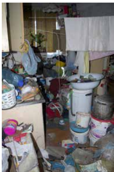
Śmieci zalegają też w kuchni