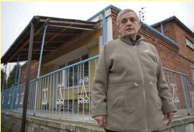
„Żałuję, że ustanowiłam darowiznę dla syna sąsiadów”

66-latką nie potrafi zrozumieć, dlaczego sąd nie uznaje jej racji.