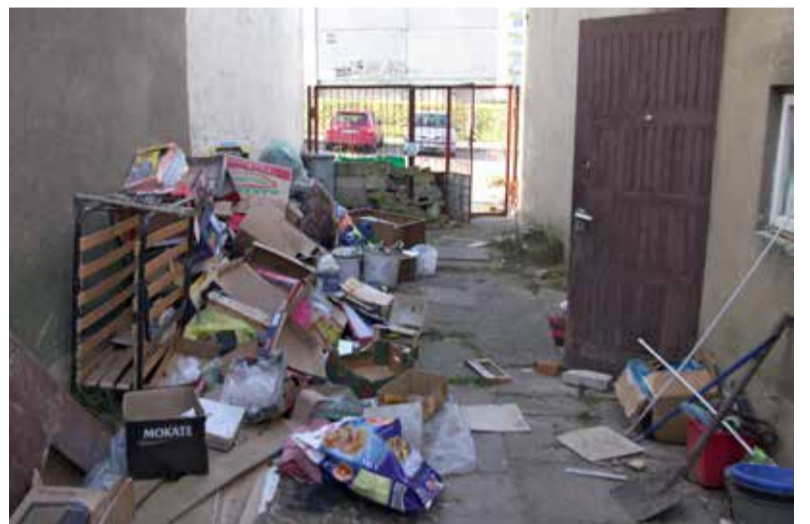
Drzwi na podwórko i do domu były otwarte

- Niewątpliwie w tym budynku jest duże zagrożenie pożarowe. Ale kłopot jest taki, że to prywatna posesja i nie możemy wiele zrobić. Najlepiej jakby najbliższa rodzina właścicielki domu zamykała drzwi, by nikt niepożądany nie mógł wejść do środka. Moim zdaniem, gdyby nieruchomość była dalej otwarta, należałoby powiadomić policję. (stop)