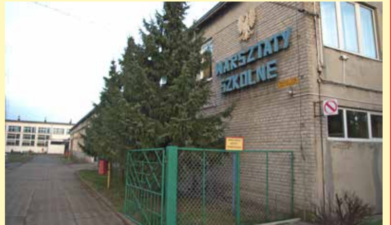
Ten budynek powiat planował sprzedać. Póki co uchwała w tej sprawie nie była omawiana przez radnych. Czy pomysł będzie nadal forsowany przez starostwo?

- Informacja przekazana mi przez przedstawicieli szkoły o zamiarze sprzedaży przez powiat szkolnych warsztatów bardzo mnie zaskoczyła. W uzasadnieniu do uchwały przeczytałam, że środki pozyskane ze sprzedaży nieruchomości powiat planuje przeznaczyć na rozbudowę szkoły i stworzenie nowych pomieszczeń dla pracowni kształcenia praktycznego. Starosta niestety nie podał żadnych konkretów, które mogłyby świadczyć, że rzeczywiście szkolny budynek przy ul. Słowackiego zostanie zmodernizowany.