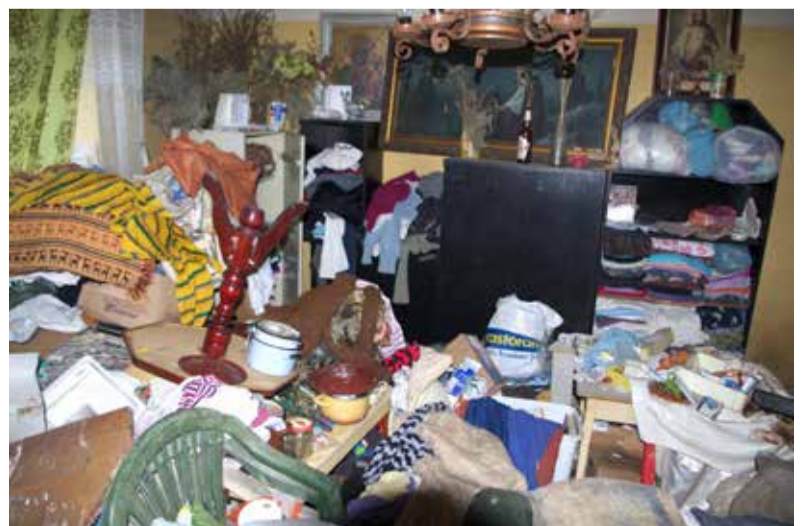
Tak wygląda największy pokój