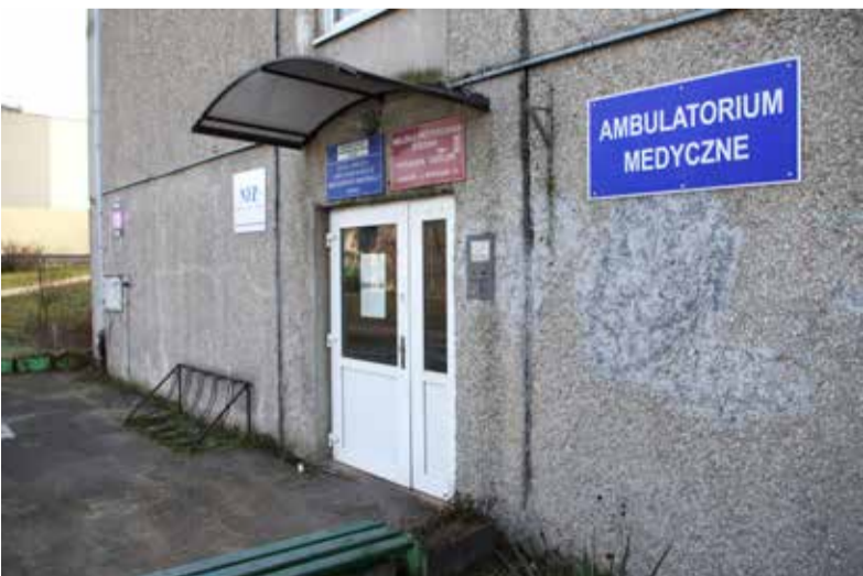
Przy Spokojnej 10 uruchomiona została nocna i świąteczna pomoc ambulatoryjna. Niestety drugiej karetki nie udało się utrzymać. Burmistrz zapowiada, że nadal będzie walczył o powrót drugiego ambulansu

ski, szef ozorkowskiej straży pożarnej. - Gdy trzeba, jedziemy także do chorych, by ratować ich życie. Moi ludzie są doskonale przygotowani do takich zadań. Już na etapie wstępnych szkoleń, młodzi strażacy są uczeni podstawowych zasad związanych z ratowaniem życia ludzkiego.