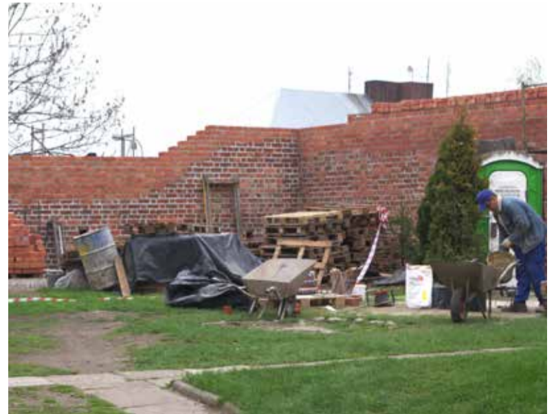
Trafili niestety na remont