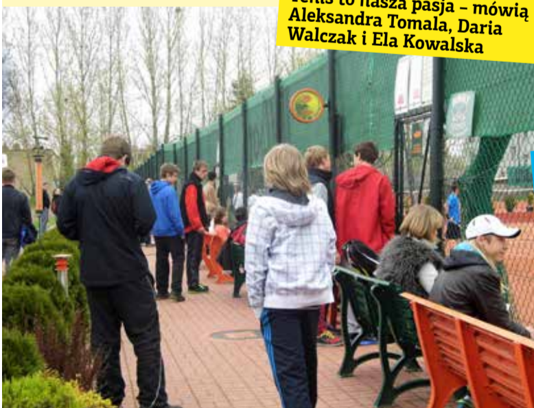
Pomimo nie najlepszej pogody, turniej obserwowało sporo osób