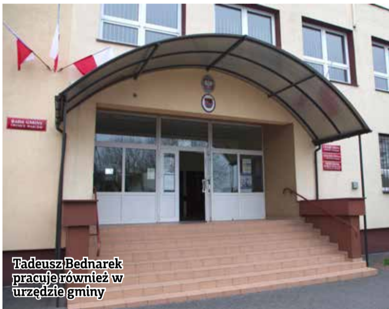
Tadeusz Bednarek pracuje również w urzędzie gminy