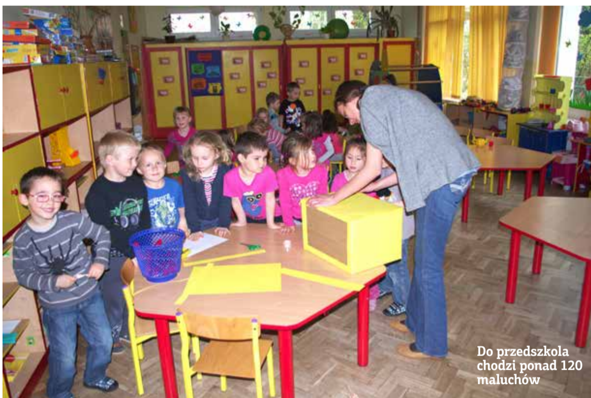
Do przedszkola chodzi ponad 120 maluchów

Rozmawialiśmy jeszcze z wieloma rodzicami o