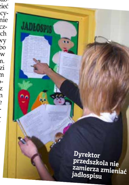
Dyrektor przedszkola nie zamierza zmieniać jadłospisu

- Nie wiem, kto chce mi zrobić przykrość. Uważam, że rodzice, którym nie podoba się jadłospis powinni przyjść do mnie i porozmawiać o tym w cztery oczy. Do tej pory nikt nie skarżył się na menu w przedszkolu. Czuję się z taką niezadowoloną moim zdaniem krytyką źle, ale nie zamierzam niczego zmieniać. Robię to dla zdrowia dzieci... (stop)