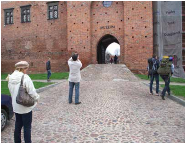
Do Łęczycy przyjechali na długi weekend turyści