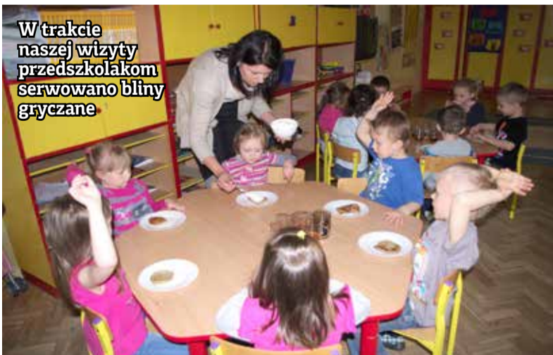
W trakcie naszej wizyty przedszkolakom serwowano bliny gryczane