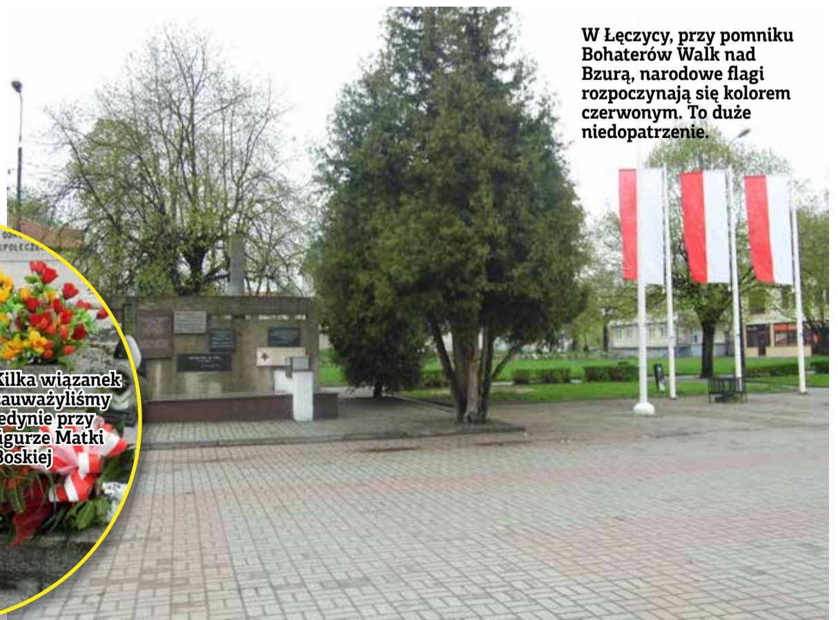
W Łęczycy, przy pomniku Bohaterów Walk nad Bzurą, narodowe flagi rozpoczynają się kolorem czerwonym. To duże niedopatrzeń.

W tym roku nie składano kwiatów pod pomnikiem. Główne uroczystości 3 Maja odbyły się w kościele