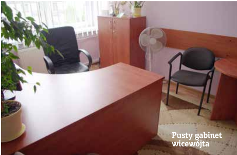
Pusty gabinet wicewójta