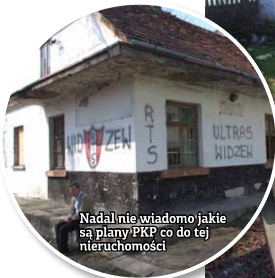
Nadal nie wiadomo jakie są plany PKP co do tej nieruchomości