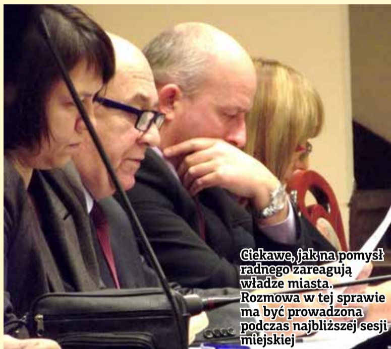
Ciekawe, jak na pomysł radnego zareagują władze miasta. Rozmowa w tej sprawie ma być prowadzona podczas najbliższej sesji miejskiej

Na zdjęciu samorządowiec trzyma pisma do parlamentarzystów w których przedstawia zasadność swojego pomysłu