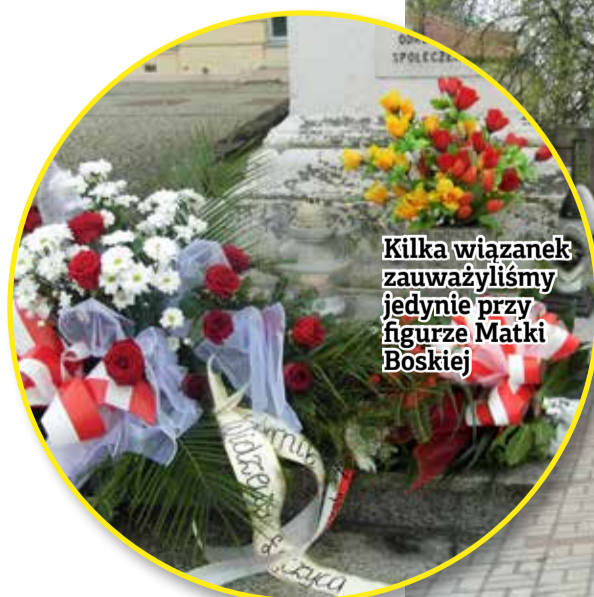
Kilka wiązank zauważyliśmy jedynie przy figurze Matki Boskiej