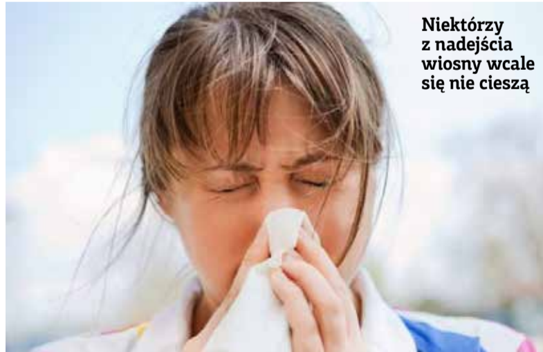
Niektórzy z nadejścia wiosny wcale się nie cieszą