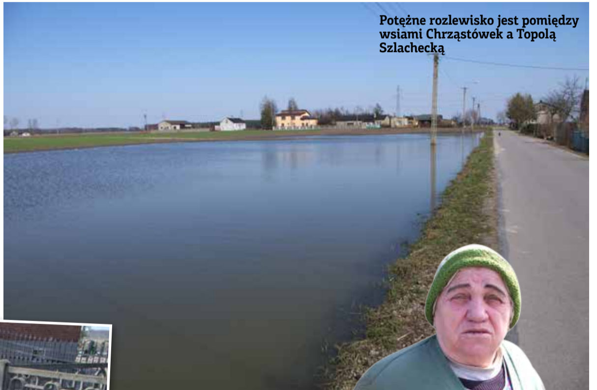
Potężne rozlewisko jest pomiędzy wsiami Chrząstówek a Topolą Szlachecką