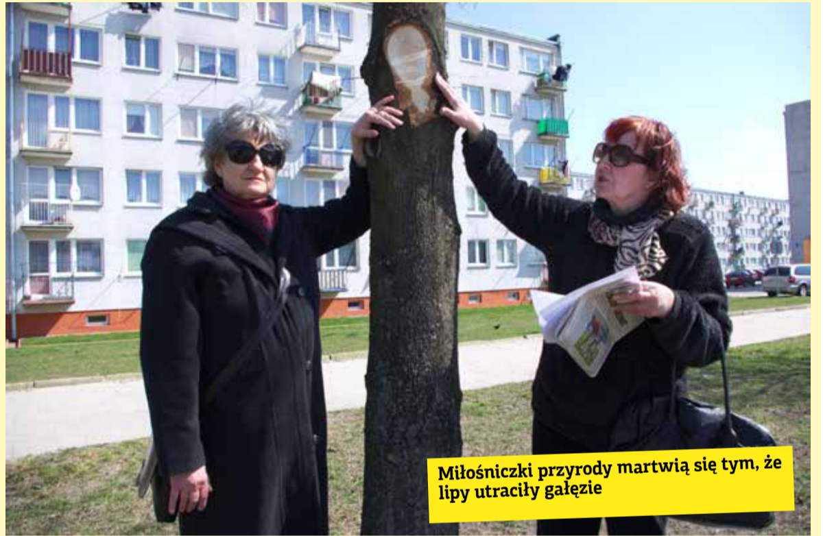
Miłośniczki przyrody martwią się tym, że lipy utraciły gałęzie