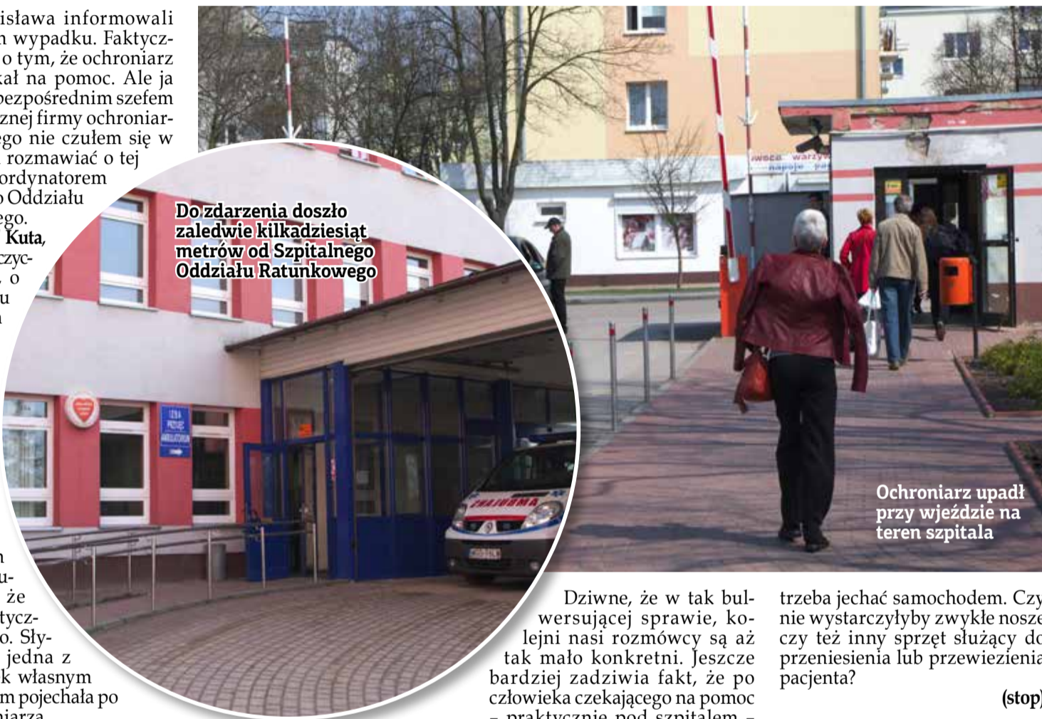
Ochroniarz upadł przy wjeździe na teren szpitala

Do zdarzenia doszło zaledwie kilkadziesiąt metrów od Szpitalnego Oddziału Ratunkowego