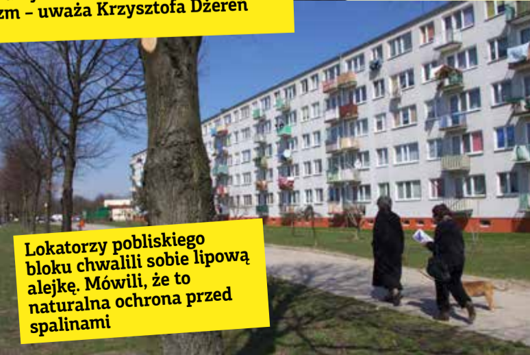
Lokatorzy pobliskiego bloku chwalili sobie lipową alejkę. Mówili, że to naturalna ochrona przed spalinami