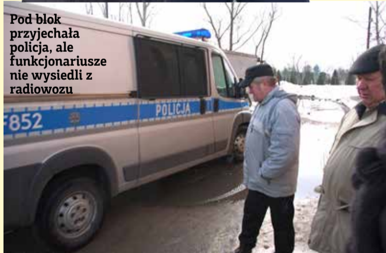
Pod blok przyjechała policja, ale funkcjonariusze nie wysiedli z radiowozu