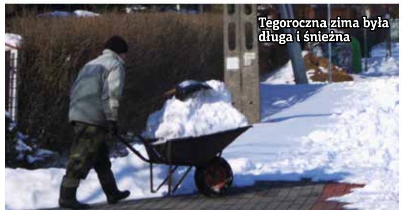
Tęgoroczna zima była długa i śnieżna

praktycznie wydały już wszystkie pieniądze przeznaczone na odśnieżanie chodników i dróg.