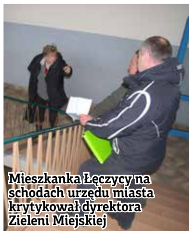
Mieszkanka Łęczycy na schodach urzędu miasta krytykowała dyrektora Zieleni Miejskiej

W tym roku odejście zimy znacznie się przedłużyło. Dla wielu mieszkańców oznacza to większe koszty związane z opłatami za ogrzewanie lokali. Rosną rachunki za prąd, opał, gaz. Zimowa aura to również kłopot dla poszczególnych gmin, które