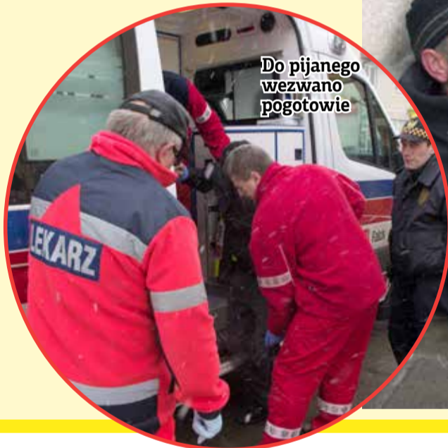
Do pijanego wezwano pogotowie