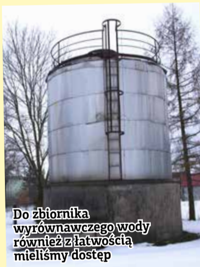
Do zbiornika wyrównawczego wody również z łatwością mieliśmy dostęp