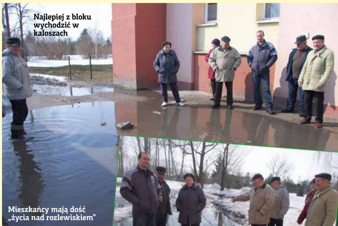
Najlepiej z bloku wychodzić w kaloszach

Pan Kazimierz powiedział mi, że do magistratu w