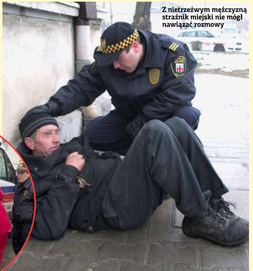
Z nietrzeźwym mężczyzną strażnik miejski nie mógł nawiązać rozmowy