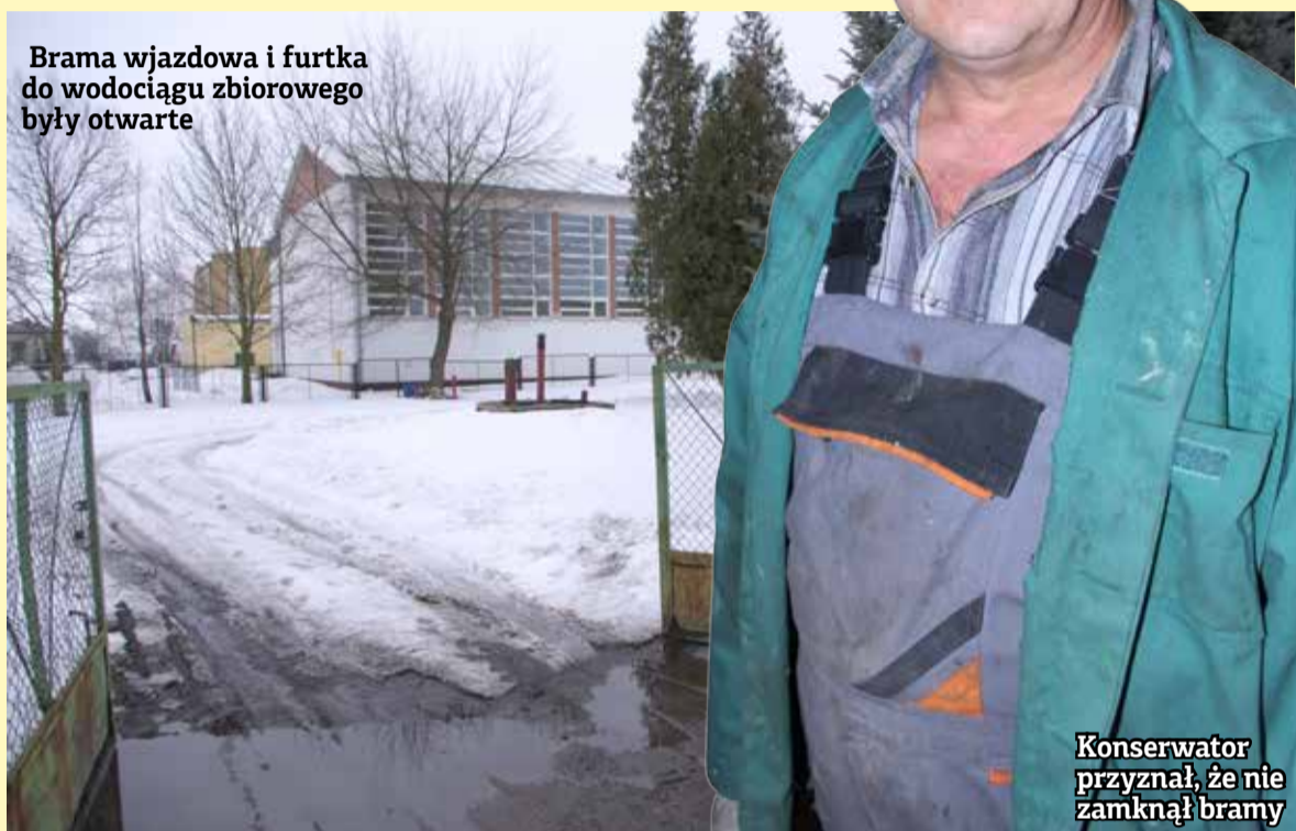
Konserwator przyznał, że nie zamknął bramy

Brama wjazdowa i furka do wodociągu zbiorowego były otwarte