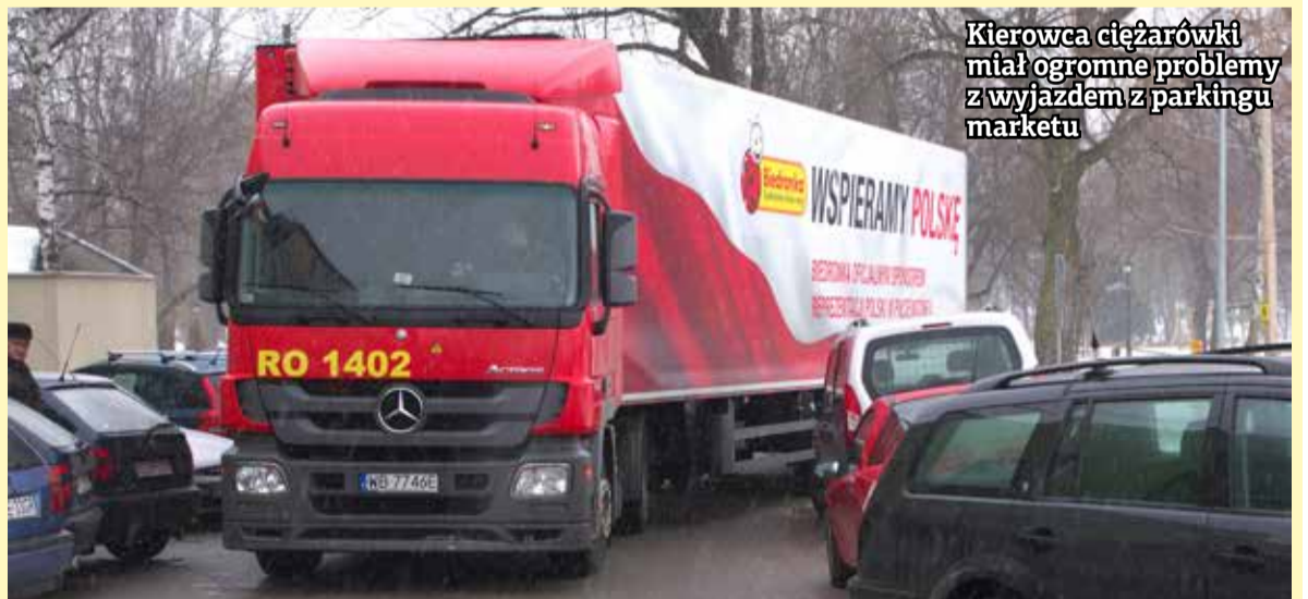
Kierowca ciężarówki miał ogromne problemy z wyjazdem z parkingu marketu

W ubiegłym tygodniu byliśmy świadkami, jak przez dobrych kilka minut potężna ciężarówka nie mo-