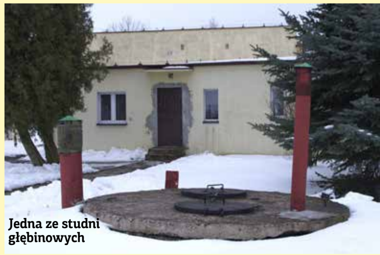
Jedna ze studni głębinowych

Ptaka zostało przywieziono do jednostki w wiklinowym, wielkanocnym koszyku