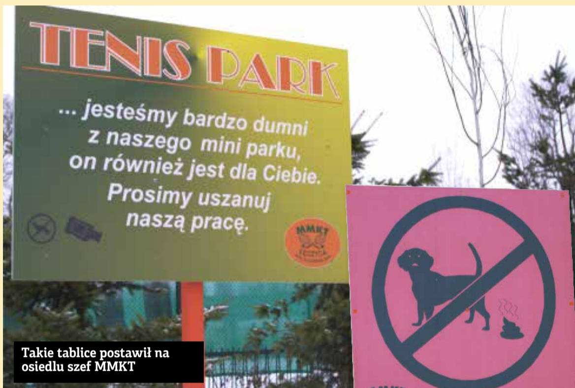
Takie tablice postawił na osiedlu szef MMKT

- To osiedle jeszcze kilka lat temu wyglądało fatalnie. Te wszystkie inwestycje, które tutaj zostały zrealizowane, nie są dla mnie. Są dla mieszkańców, dzieci. Wokół kortów wsadziłem setki drzew, teren się zazielenił. Wymagam jedynie, aby właściciele psów sprząkali nieczystości po zwierzakach. A ze strażą miejską i policją owszem współpracuję. Bo nie pozwolę na to, aby pod blokiem, w pobliżu kortów pito alkohol.