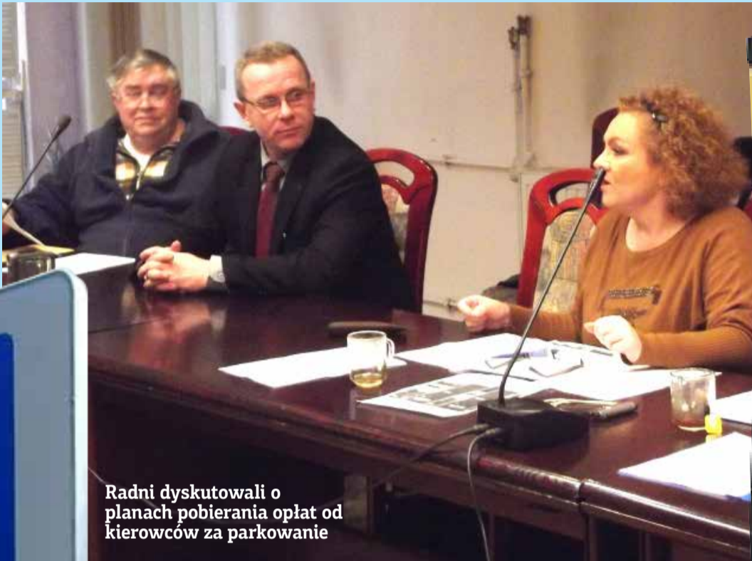
Radni dyskutowali o planach pobierania opłat od kierowców za parkowanie

Najwięcej kontrowersji wzbudzają plany pobiera-