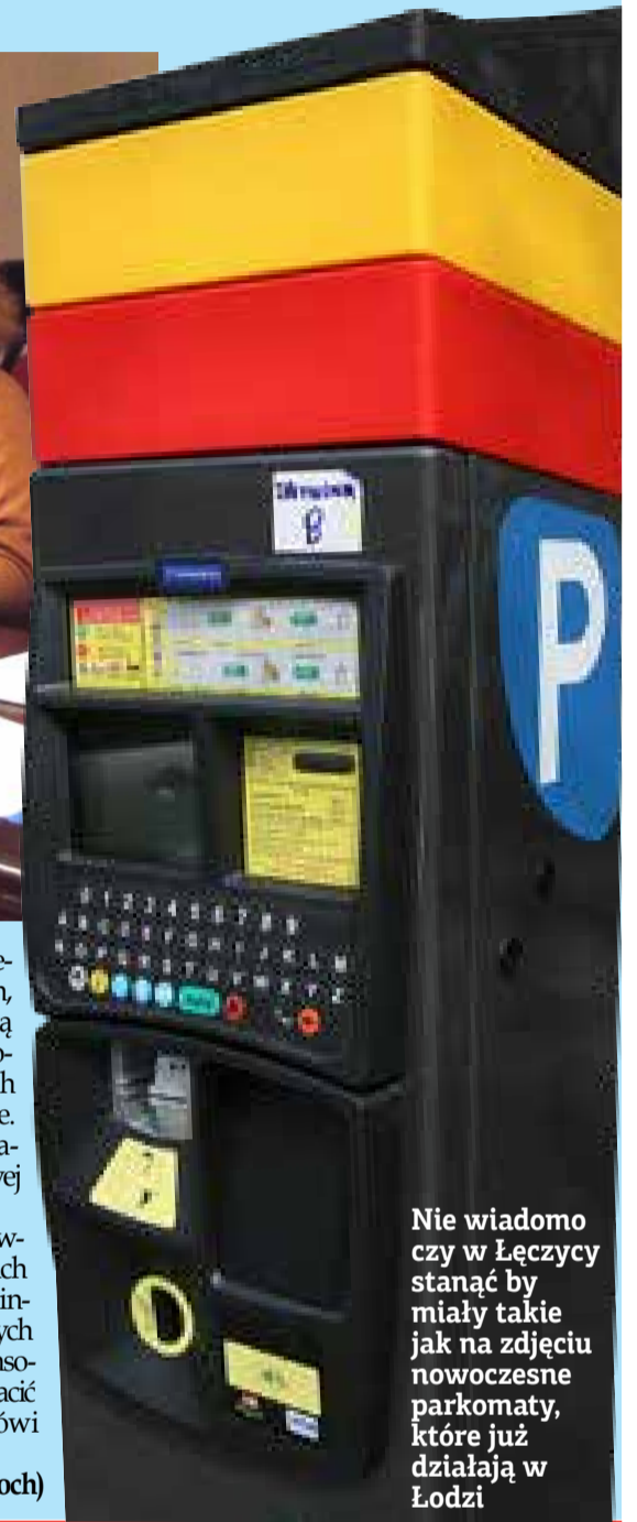
Nie wiadomo czy w Łęczycy staną by miały takie jak na zdjęciu nowoczesne parkomaty, które już działają w Łodzi