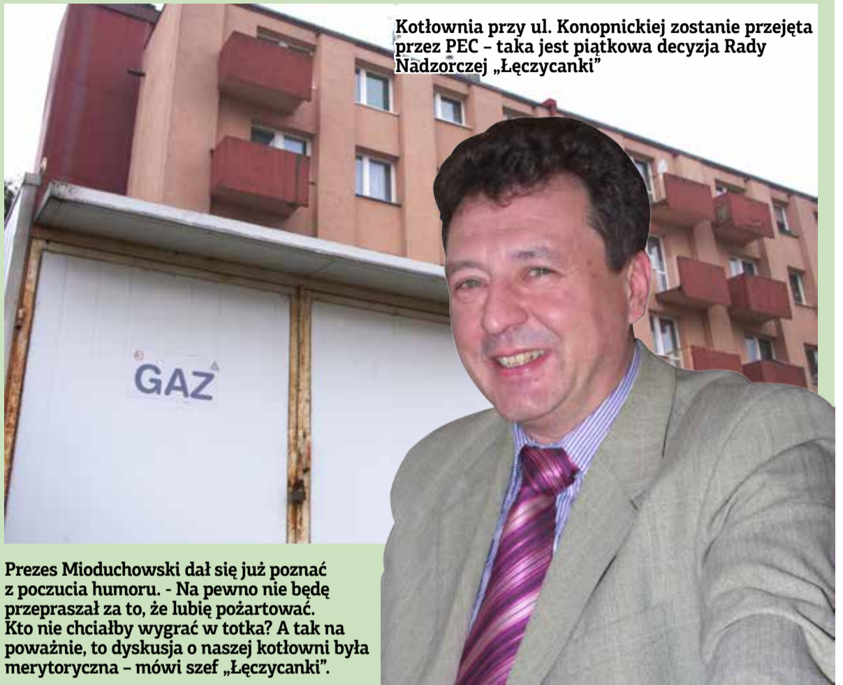
Kotłownia przy ul. Konopnickiej zostanie przejęta przez PEC – taka jest piątkowa decyzja Rady Nadzorczej „Łęczycanki”