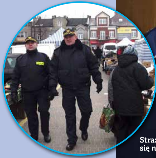
Strażnicy dość często pojawiają się na targowisku

- Proszę mi wierzyć, że straż miejska nie wlepia jedynie mandatów za nielegalny handel. Choć wielu niestety tak uważa. Mam nadzieję, że gdy ponownie spotkamy tego rolnika na targowisku, już będzie miał wymagane pozwolenia na handel - mówi komendant. (stop)