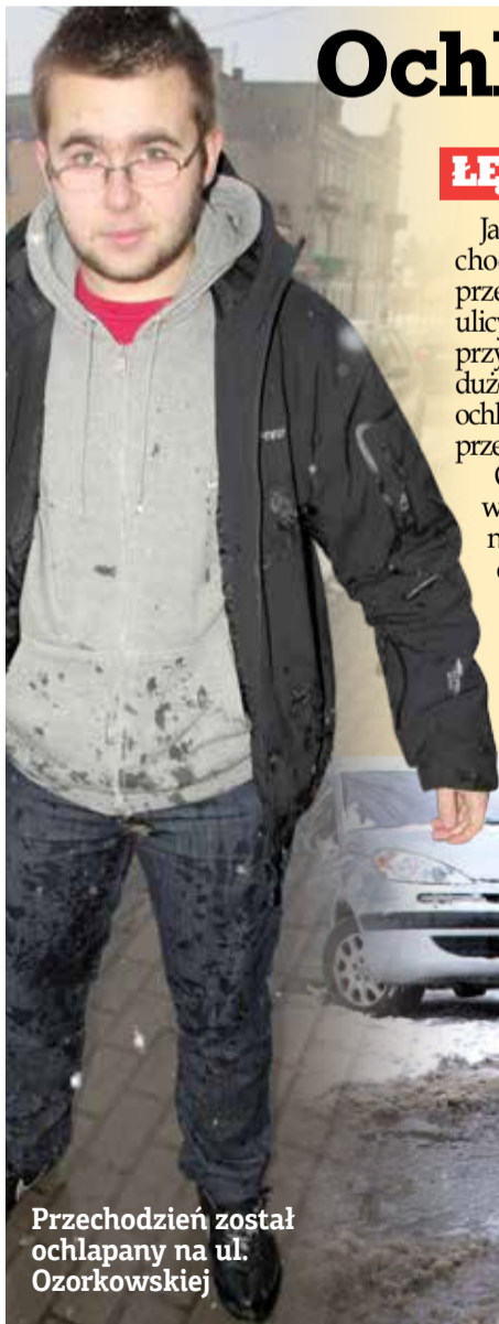
Przechodzień został ochlapany na ul. Ozorkowskiej