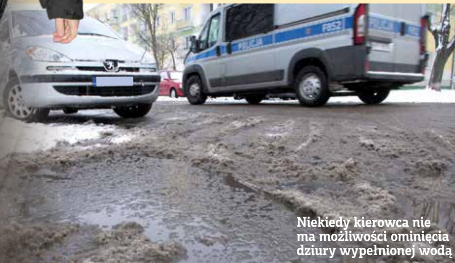
Niekiedy kierowca nie ma możliwości ominięcia dziury wypełnionej wodą