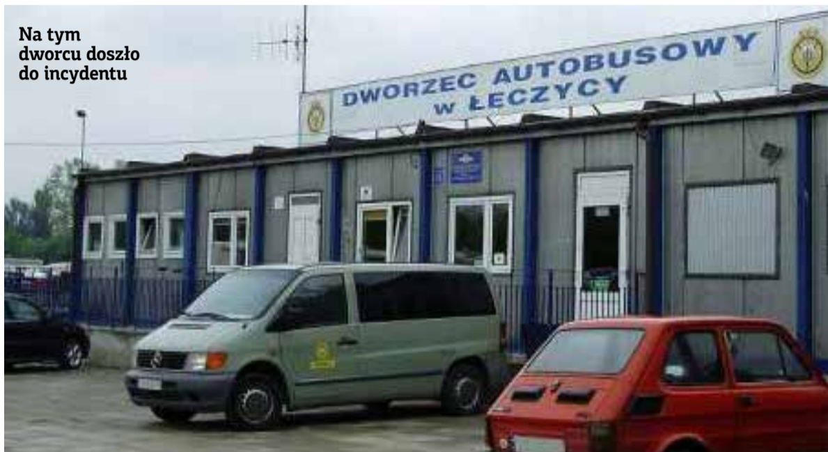
Na tym dworcu doszło do incydentu