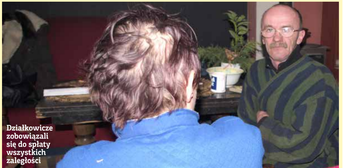
Działkowicze zobowiązali się do spłaty wszystkich zaległości