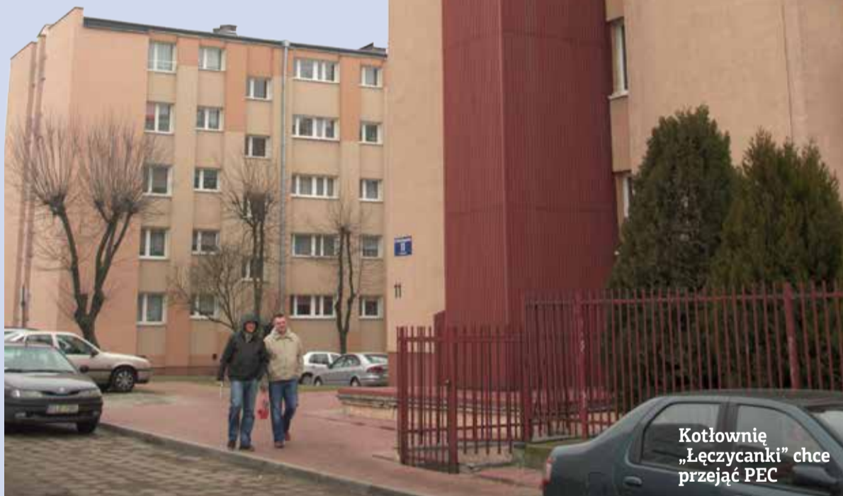
Kotłownię „Łęczycanki” chce przejąć PEC