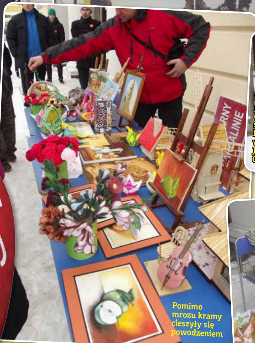
Pomimo mrozu kramy cieszyły się powodzeniem