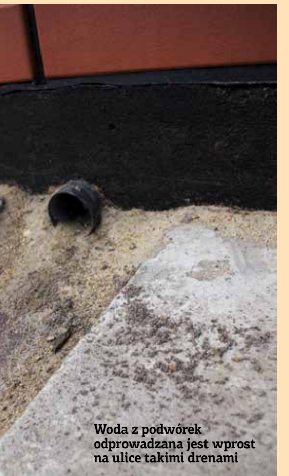
Woda z podwórek odprowadzana jest wprost na ulice takimi drenami