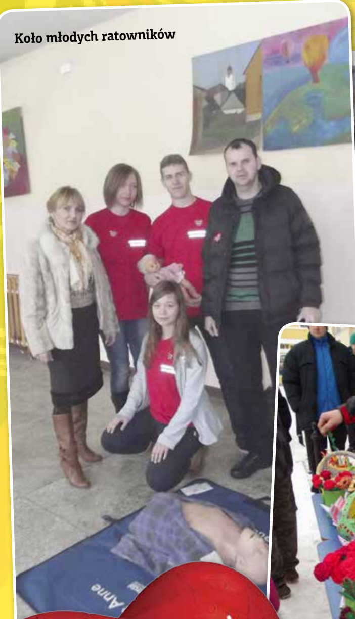
Koło młodych ratowników