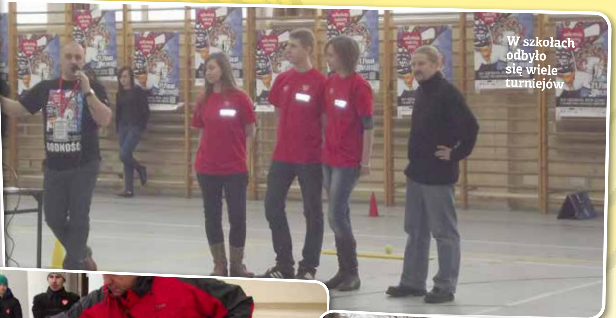
W szkołach odbyło się wiele turniejów