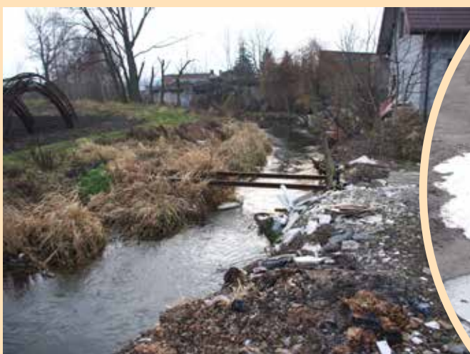
Nieczystości wpływają wprost do rzeki Maliny