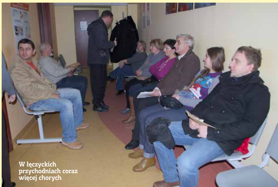
W łączyckich przychodniach coraz więcej chorych