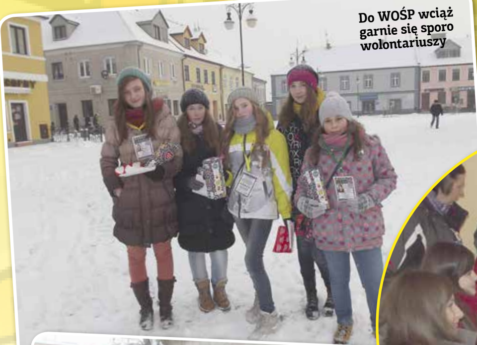
Do WOŚP wciąż garnie się sporo wolontariuszy