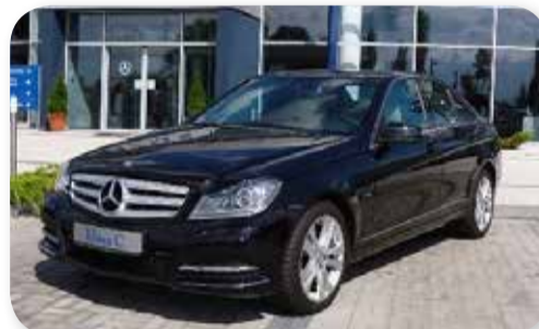
Mercedes-Benz C 200 CGI AVANTGARDE

06/2011, 183 KM, 23 tys. km. czarny metalik, xenony, klimatyzacja, automatyczna skrzynia biegów, czujniki parkowania, nawigacja, podgrzewane fotele, skórzana tapicerka cena: 123 900 zł z VAT ZW