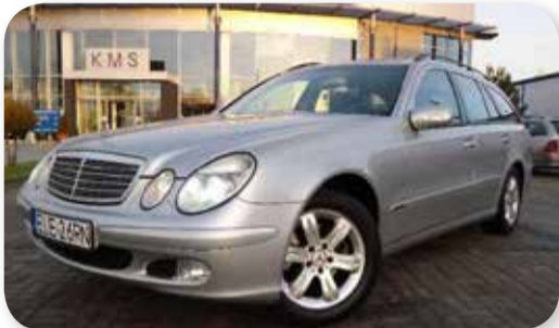
Mercedes-Benz E 200 T Kompresor

08/2003, 163 KM, 221 tys. km. srebrny metalik, klimatyzacja, automatyczna skrzynia biegów, czujniki parkowania, xenony, podgrzewane fotele cena: 33 500 z VAT ZW