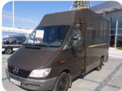
Mercedes-Benz Sprinter 308 CDI

11/2001, 82 KM, 227 tys. km., lakier brązowy, automatyczna skrzynia biegów, radio cena: 19 999 zł z VAT ZW