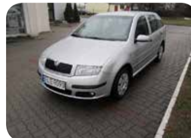
Skoda Fabia Combi Elegance 1.4

ABS, zamek centralny, elektryczne lusterka, elektryczne szyby, immobiliser, klimatyzacja, komputer, poduszka powietrzna, światła przeciwmgielne, wspomaganie kierownicy Cena: 21500 zł