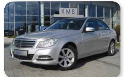
Mercedes-Benz C 220 CGI BLUEEFFICIENCY

11/2011, 170 KM, 16 tys. km. srebrny metalik, klimatyzacja, manualna skrzynia biegów, czujniki parkowania, radio CD, podgrzewane fotele cena: 105 900 zł + 23% VAT