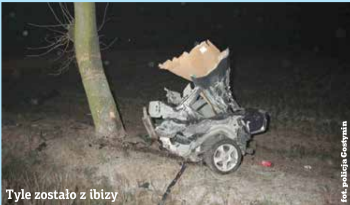
Tyle zostało z ibizy