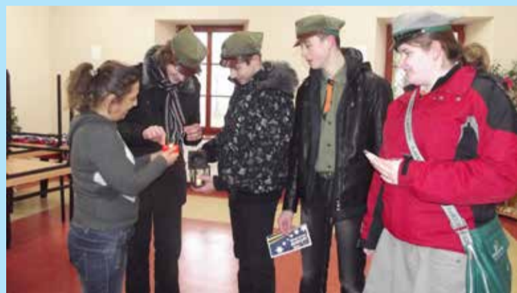
Grupa harcerzy z Klonowca Starego roznosiła betlejemskie światelko do zaprzyjaźnionych instytucji, osób. Trafił też do Gminnego Ośrodka Kultury i Sportu w Łanietach. Światelko towarzyszyło uczestnikom piątkowej wigilii zorganizowanej w miejscowej świetlicy dla sympatyków i pracowników GOK.